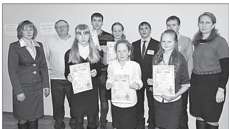
Призеры в краеведческой секции и их руководители.