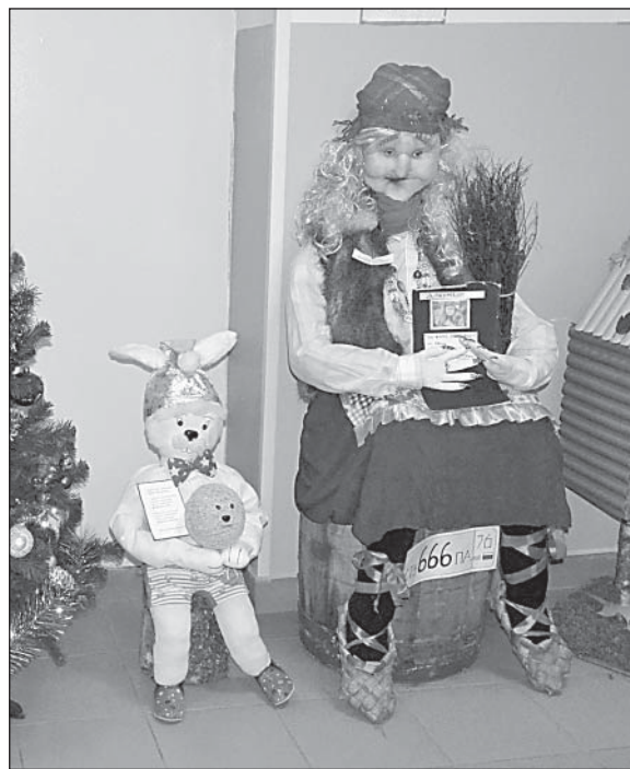
Первое место присудили Бабе-яге (коллектив поликлиники) и экспозиции Нижнекулойской участковой больницы. Зайцу (физиокабинет) — второе.