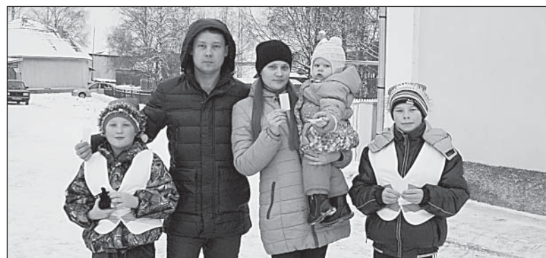
Ребята из отряда ЮИД «ЗЕБРА» вручали верховажанам светоотражающие полоски.

Нынешний 2014 год начался для юных помощников инспекторов ГИБДД с про-