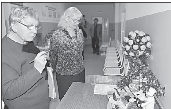
Жюри в замешательстве — кому отдать 1 место.