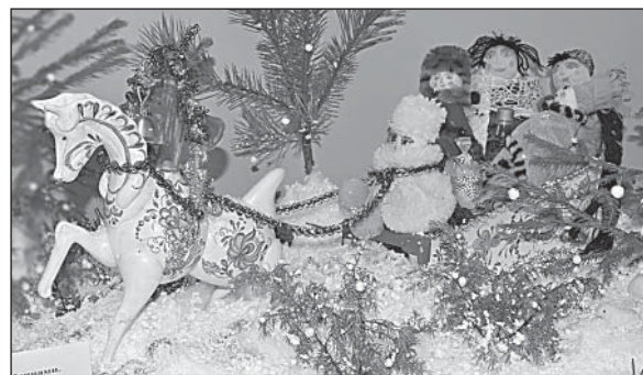
«Едем мы на праздник с бубенцами», детская консультация, 2 место.