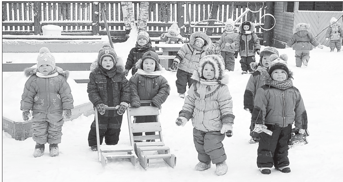
Наконец-то наступила зима. Да и у родителей закончились «каникулы». Они пошли на работу, а мы - в садик...

...Настойчивый стук в дверь под громкую залиvistую игру на гармошке. Хозяин открывает дверь, и в прихожей... вер-