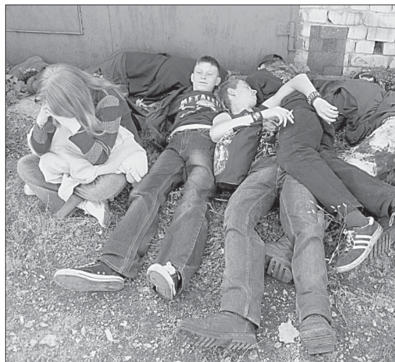
Алкоголь и табак до добра не доведут.

Отец, видимо, тоже не очень сведущ в этих вопросах. После долгой беседы и убеждений подросток согласился, что он совершил правонарушение и в результате папа заплатит