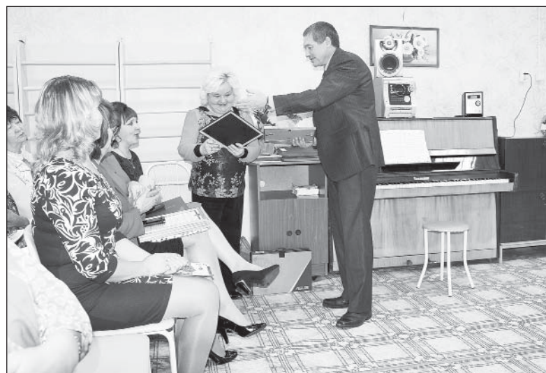
Поздравление с 80-летним юбилеем детскому саду №1 «Радость»