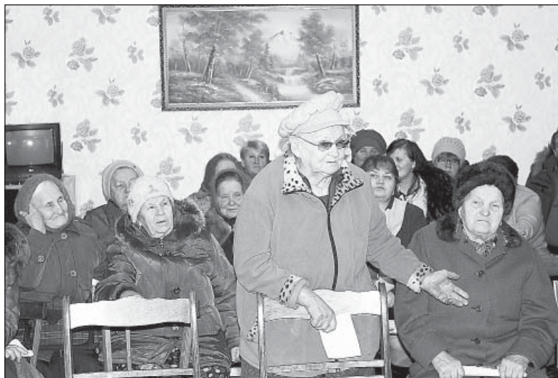
На встрече в Климушинском поселении

ствующим. К сожалению, всю концертную программу депутату посмотреть не удалось, поскольку через сорок минут была запланирована встреча с руководителями сельхозпредприятий, которые занимаются молочным животноводством.