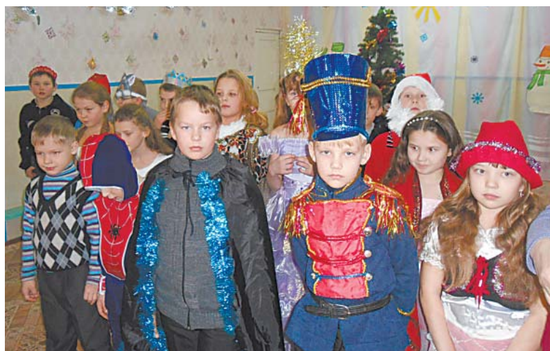
Спектакль «Волшебные витамины» показали детям ученики 2 и 4 классов.