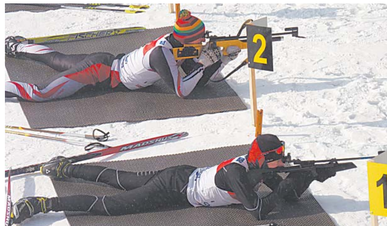
Биатлон — один из ведущих видов спорта в районе.

Пулевая стрельба. С одной стороны, как вид спорта она в районе отсутствует, но потенциал еще остался. В планах на 2014 год вернуть в строй тир в селе Верховажье, пер-