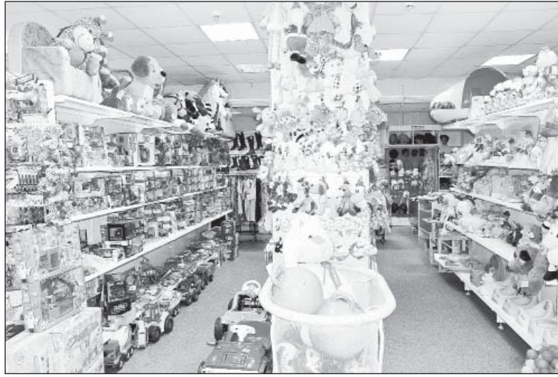
Магазин «100 одежек» (фото слева) называется теперь «Бегемотик» (фото справа). Чувствуете разницу?