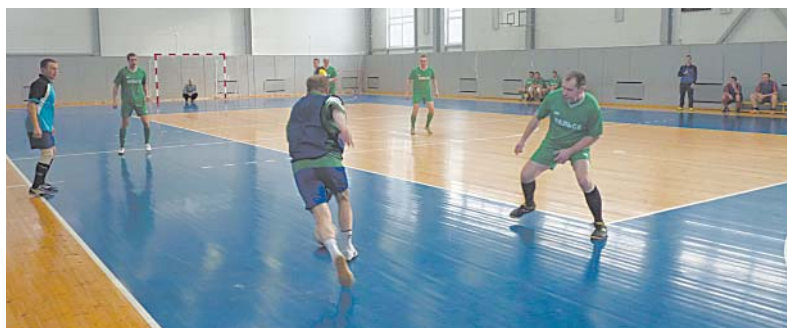
Спонсоры могли бы помочь в строительстве футбольных сооружений

старании директора, Центр загружен только при проведении соревнований.