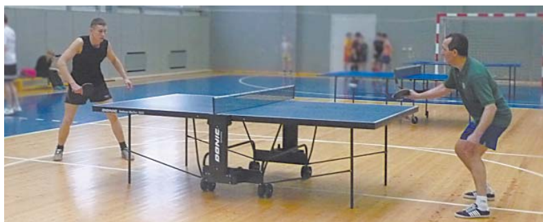
Верховажский настольный теннис в перспективе может выйти и на межрегиональный уровень.