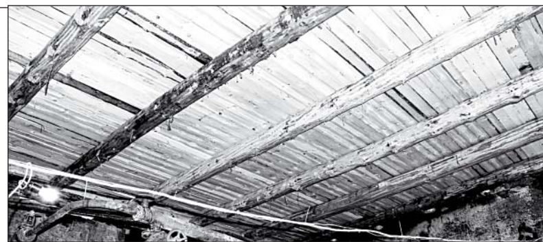
Кровля котельной отремонтирована силами добровольцев при помощи местных предпринимателей