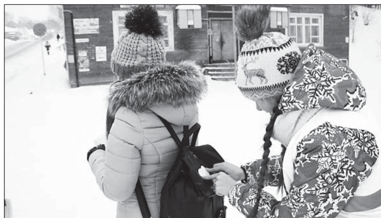
Светоотражающие наклейки юные инспектора дорожного движения наклеивали на сумки пешеходов