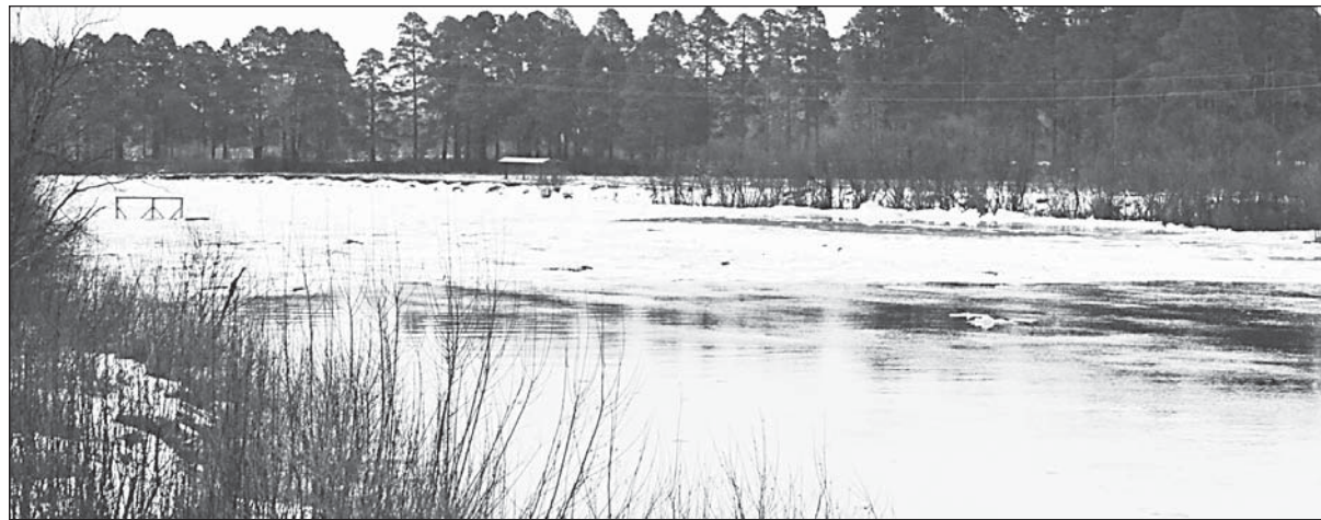
Погода в декабре была до того теплой, что на Ваге начался ледоход