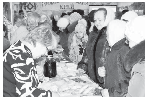
Изобилие предложенных товаров удивляло.

ства и местной власти. Поставьте свою оценку власти! Отнесите к этому ответственно и сознательно.