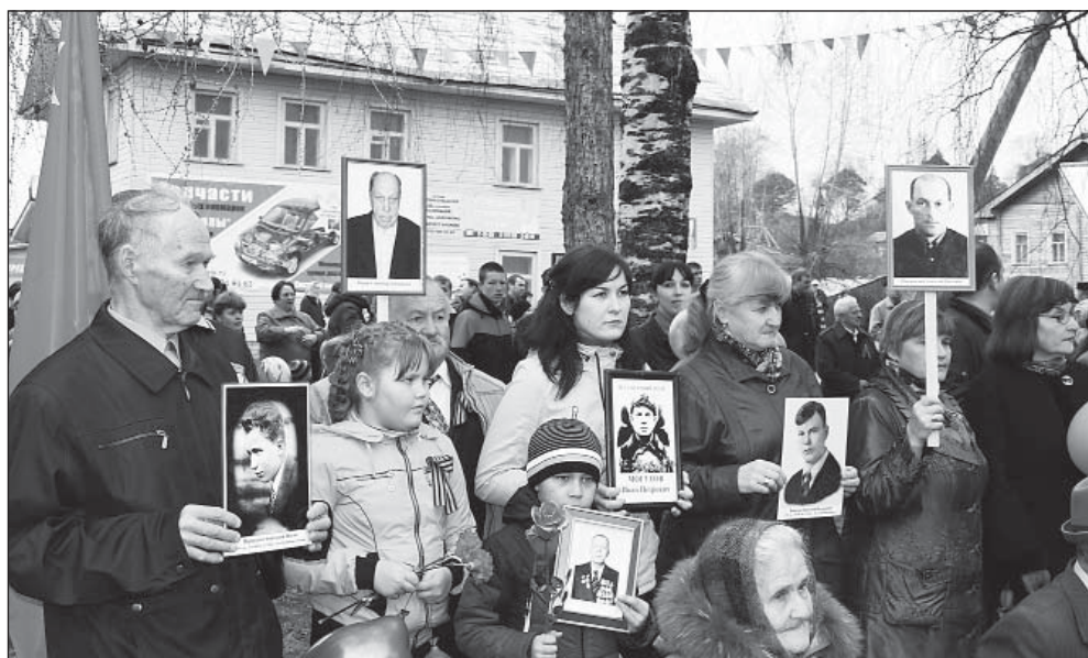
Митинг 9 мая 2014 года. Участники акции «Бессмертный полк».

Проект редакции при поддержке Управления информационной политики правительства Вологодской области