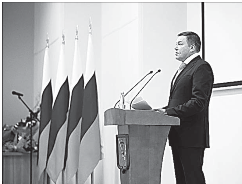
Олег Кувшинников представил антикризисный план действий на 2015 год.

Мы также обратились к представителям торговли с просьбой минимизировать наценки, особенно на социально значимые товары, к оптовым организациям - с предложением обеспечить двухме-