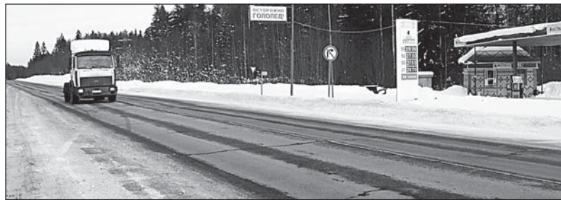
Наш отрезок автотрассы Москва-Архангельск в следующем году отметит юбилей

- Я тоже летами не вышел, чтобы помнить те годы, но рассказов о них слышал хоть отбавляй. Примерно до конца 60-х прошлого века проблемой были поездки практически в любую «точку» района. Хоть в Коленьгу, хоть в Морозово, хоть в Олюшино. Не говоря уже о Вологде. По воспоминаниям старожил, дорога туда в оба конца, если не повезет, могла занять целую неделю. Особенно много «приятных» отзывов слышал о знаменитом в старых шоферских кругах Жиховском волоке. Там машины попросту