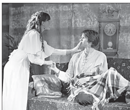
Молодое поколение купеческих семей.