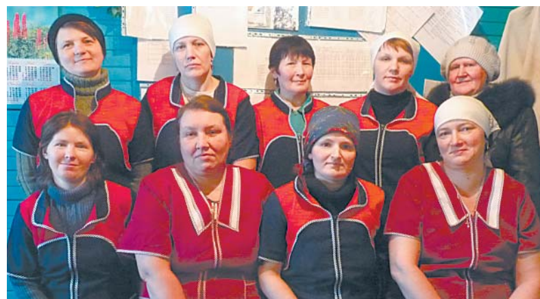
Коллектив Урусовской фермы.

- В 2013 году наши животноводы добились хороших показателей. От 465 коров получен валовой надой 27994,23 центнера молока. Плюс 3394,21 центнера. Удой на фуражную