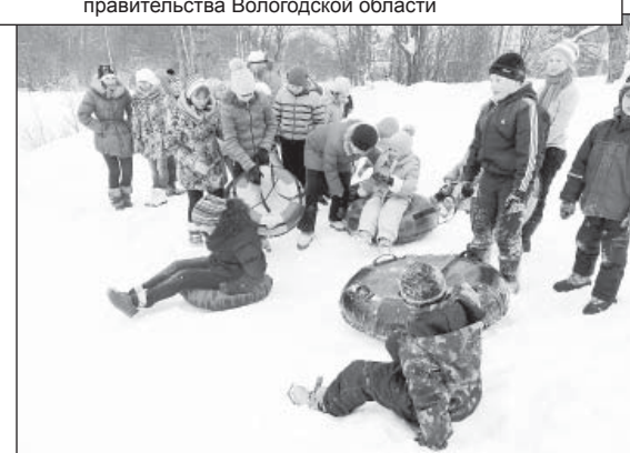
«Ватрушек» на всех не хватало.