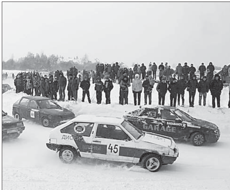
Вельский автокросс, 1 этап 2014 года.