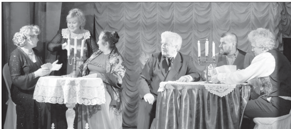
На званом ужине у Персиковых.