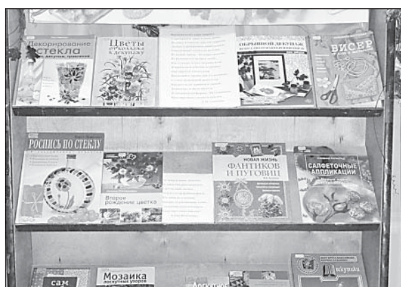
Экспонаты выставки «Чудеса рукотворные».