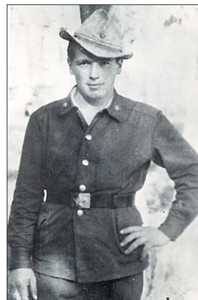
Во время прохождения службы в Афганистане.

«...Немного о себе. Служба и здоровье — нормально. Занимаемся своим делом, ходим на задания. Погода стоит теплая, правда, ночью похолодней. Но в палатках топим печки, так спать тепло. С гражданским населением не