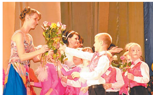
Цветы — любимому преподавателю.

Но «Комильфо» — коллектив танцевально-спортивный. Это значит — зачеты, состязания, выезды на турниры. В 2013 году состоялись несколько соревнований по спортивным танцам, организованные спортивным комитетом, МБУ «Спорт» и СТК «Комильфо». Верховажские танцевальные пары сдают зачеты, участвуют в турнирах в Вельске, Вологде, Москве.