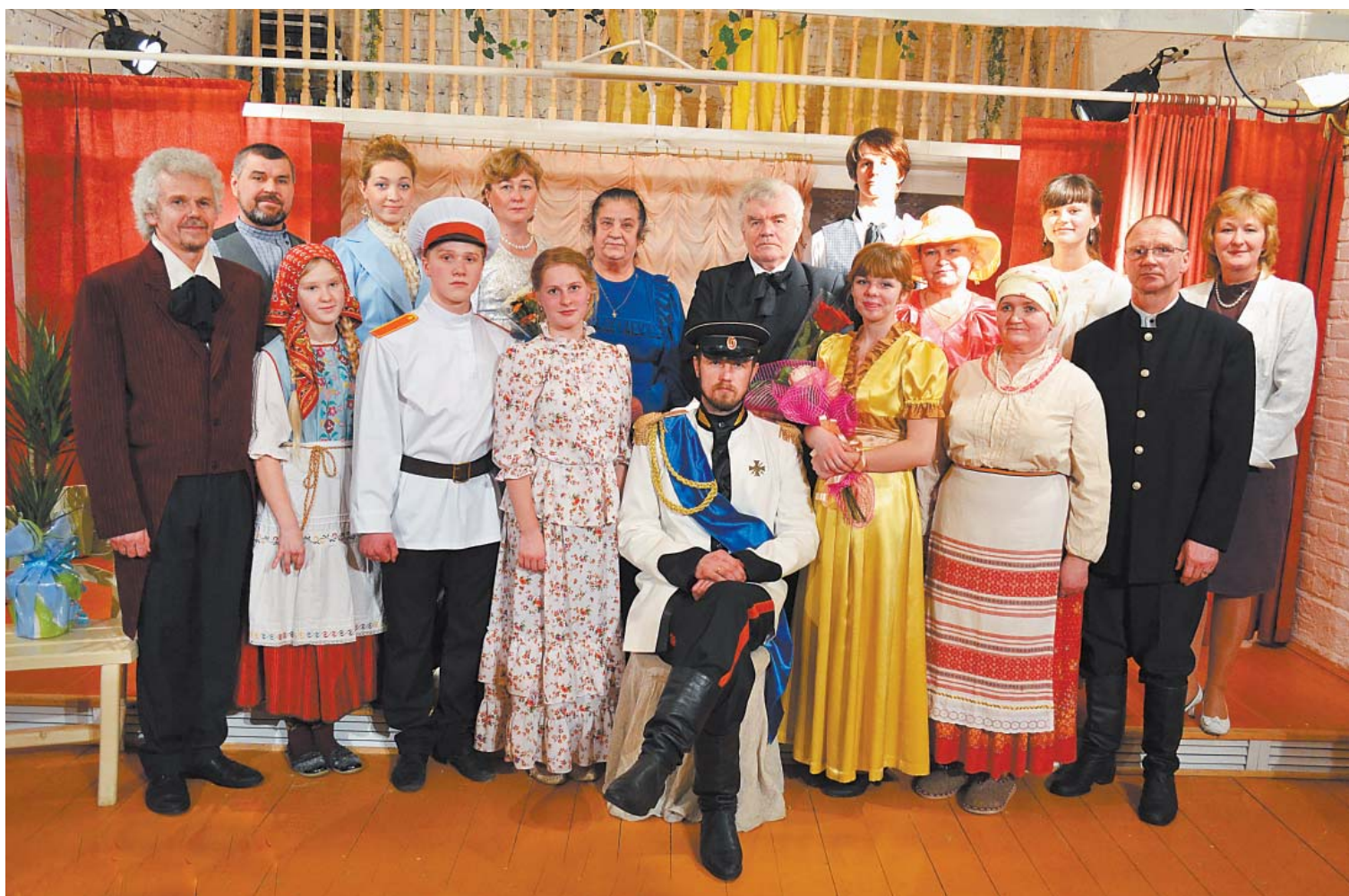
Участники спектакля «Посадская история» в камерном театре Центра традиционной народной культуры.