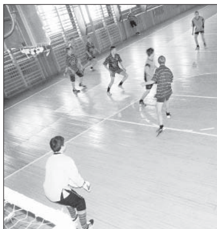
Матч по мини-футболу.