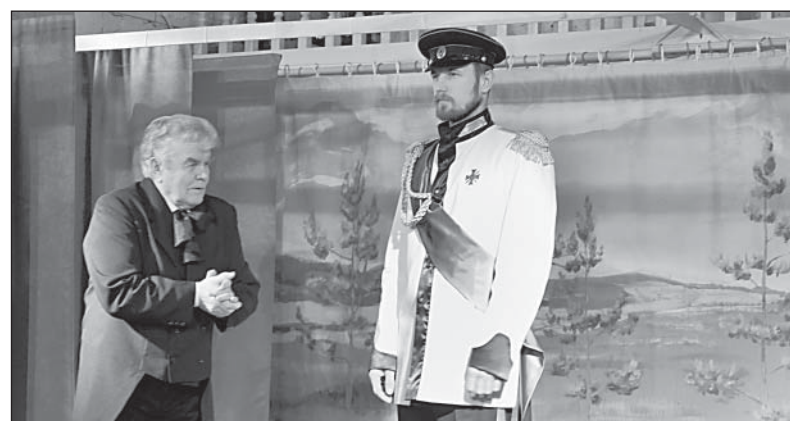
Тайная встреча в Пестеревской роще.