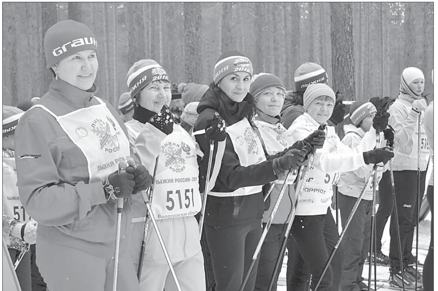
Мягкая погода, свежий лесной воздух и единомышленники сопутствовали отличному настроению всех участников «Лыжни России-2016». На старте личного зачета – женщины и девушки