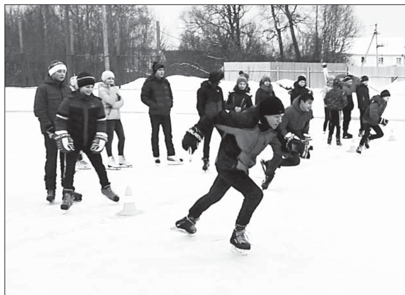
«Ледовые забавы» в исполнении учащихся Верховажской средней школы