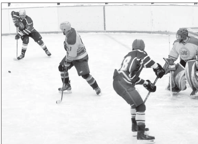
Встреча «Ваги» и «Устье-Кубены». Хозяевам так и не удалось «распечатать» ворота соперника