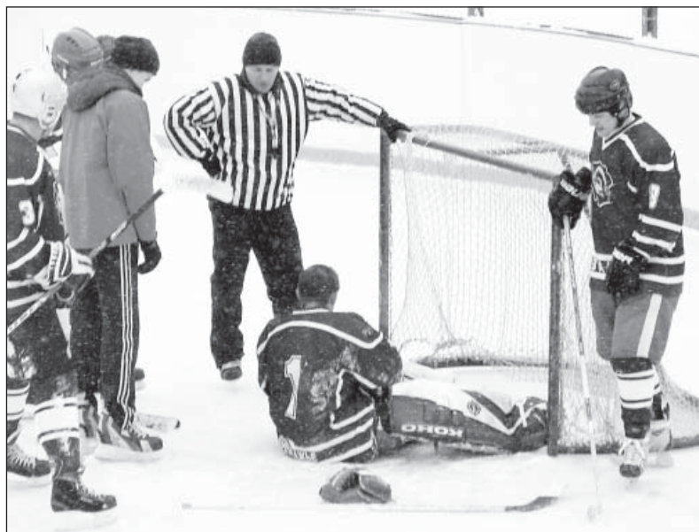
Матч «Вага»-«Тарнога». Нашему вратарю приходилось нелегко