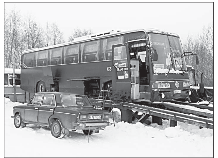
Автобус на эстакаде