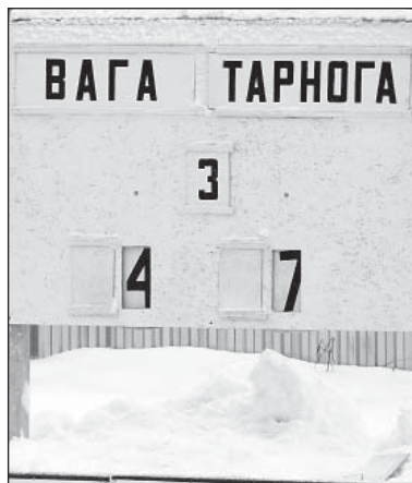
Окончательный итог встречи

Воскресный день на хоккейной площадке начался с детских ледовых забав. Четыре команды, составленные из мальчиков и девочек седьмых, восьмых и девярых классов Верховажской средней школы, продемонстрировали умение владения коньками, быстру и ловкость. Преподаватели физкультуры и ОБЖ подготовили для участников несколь-