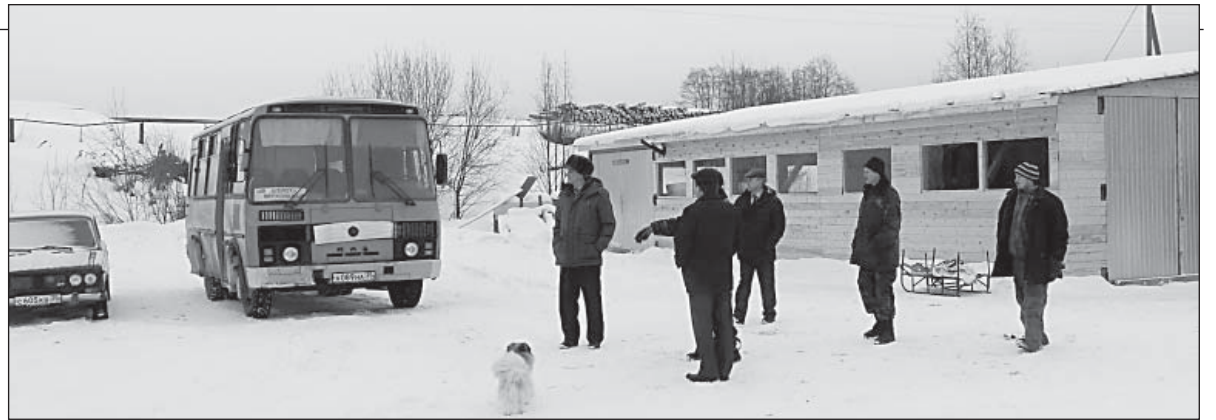
Новый ремонтный бокс (справа)

– Именно такой, социально ориентированный бизнес