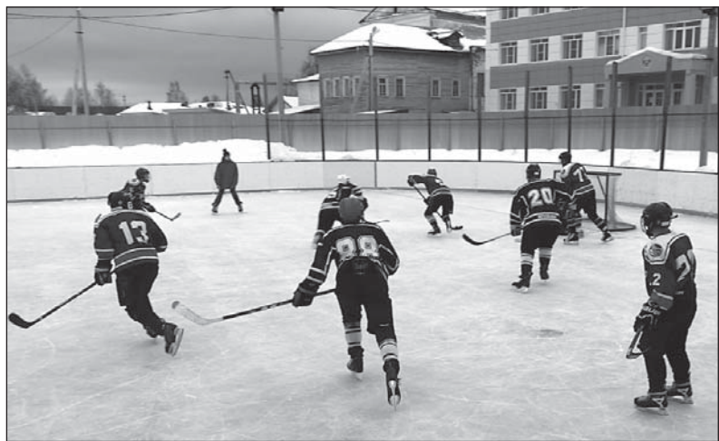
Одна из атак «Ваги»