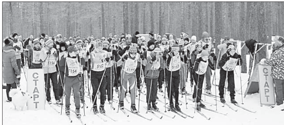
Среди мужчин на старт личного зачета вышел 41 человек