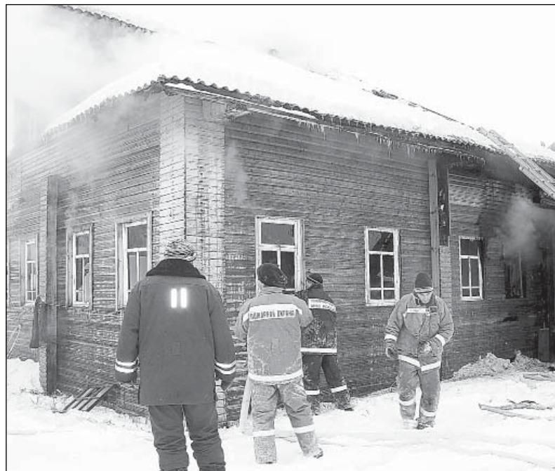
Тушение пожара в жилом доме в деревне Ореховская.

- На первом месте стоит нарушение правил устройства и эксплуатации печей и теплопроизводящих уста-