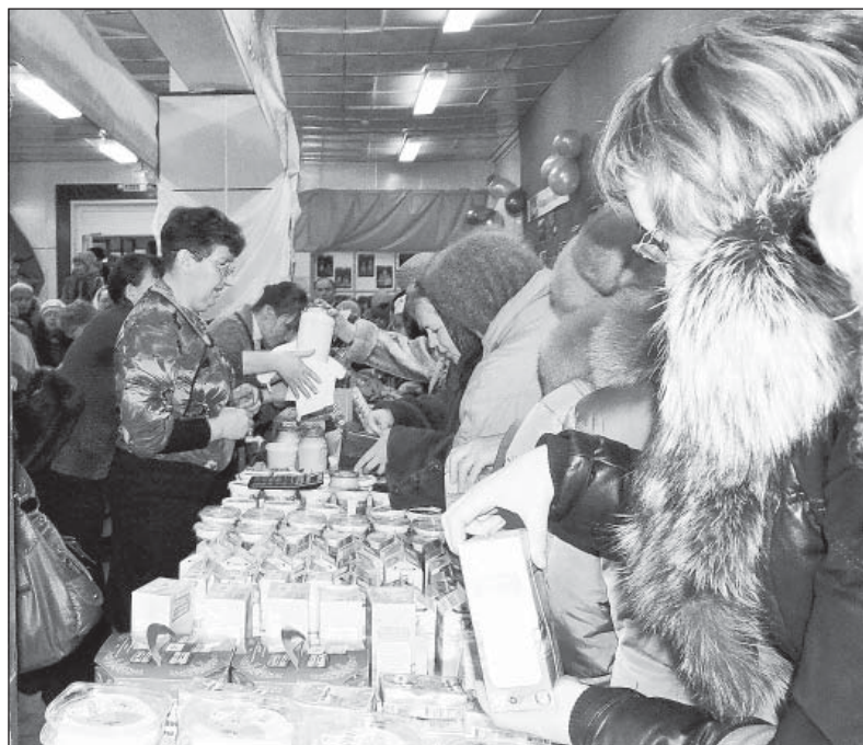
На прилавке и цельное молоко, и сметана, и творог...

Мы не раз рассказывали читателям о том, что качество молока в хозяйствах района из года в год улучшается. В том числе и в СПК колхозе «Н-Кулово».