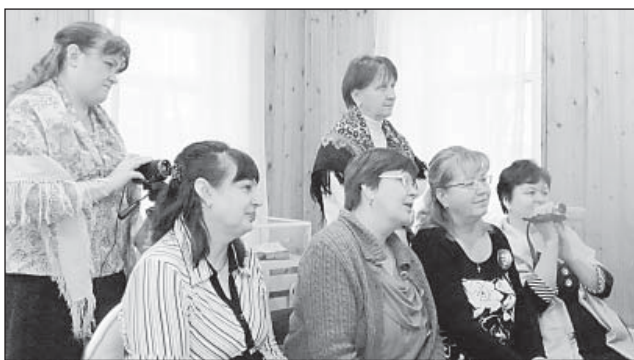
Участники мастер-класса внимательно слушали и смотрели.