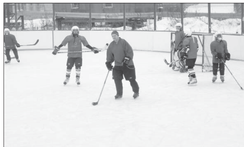
Тренер (в центре) со своими воспитанниками.

В составе команды также выступали вратари Дмит-