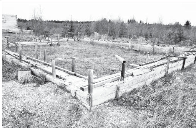
Дальше фундамента дело не пошло...

Более того, с 1 февраля 2014 года вступил в силу Федеральный закон от 28 декабря 2013 года №415 «О внесении изменений в Лесной кодекс РФ и КоАП РФ». Он устанавливает прямой запрет на отчуждение или переход от одного лица