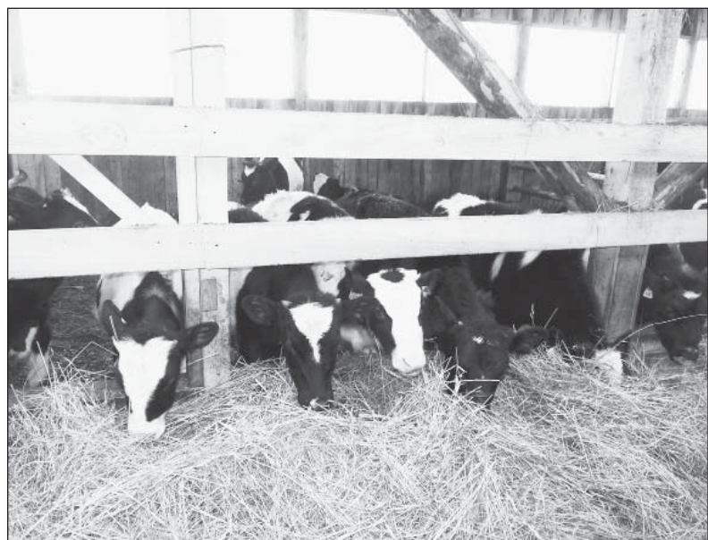
Телятам тепло, светло, сытно.