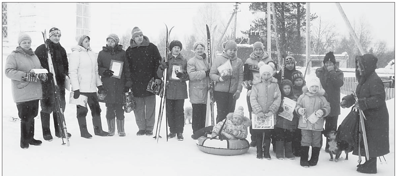
Участники «Лыжни России» в Морозове после награждения