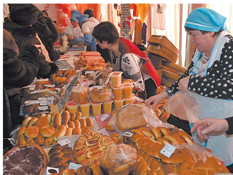
Изобилие пирогов и хлебобулочных изделий.

Не последнее место в жизни морозовцев занимает и культурная жизнь. В поселении работают две библиотеки, Дом культуры, три сельских клуба. Многие жители — активные читатели и участники художественной самодеятельности. Работают клубы по интересам, кружки, проводятся конкурсы, литературные и информационные часы. Организован клуб «Ветеран», фольклорный ансамбль «Прялица» в Пезме — старейший в районе. Ежегодно проводятся в Морозове — день села, в п. Пезма — день Святых Петра и Февроньи, в Коскове — Девятая пятница. Действуют ФОК и стадион, располагающийся футбольным и волейбольным полями и тремя спортивными площадками. Морозовские спортсмены — лучшие в районе. Возрождается и духовная жизнь. В поселении вос-