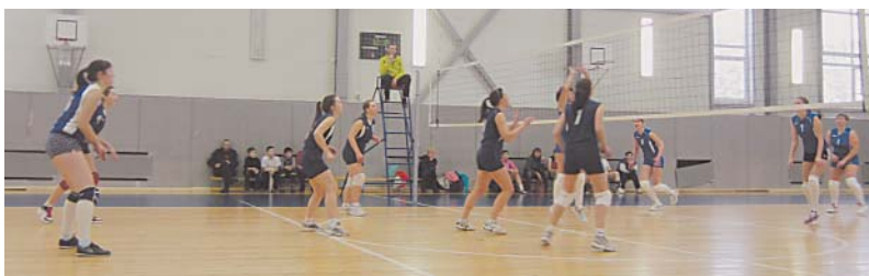
Верховажские волейболистки стали третьими.