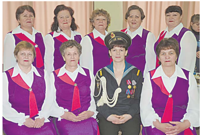
Коллектив Терменгского дома культуры.