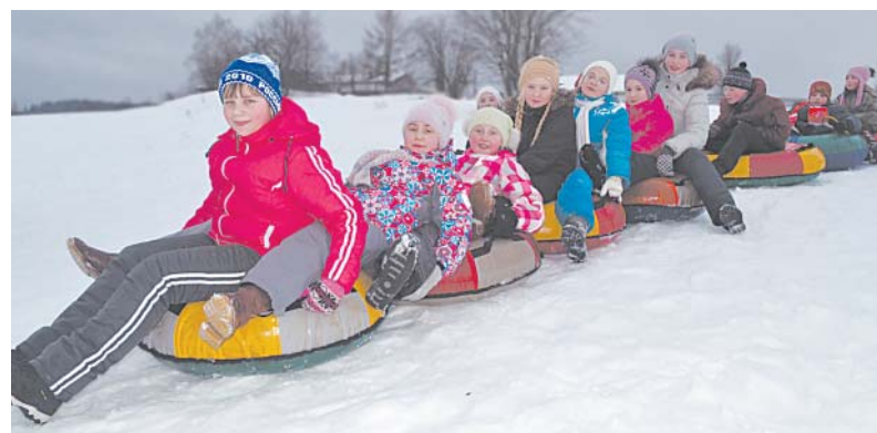
На «ватрушках» катались «паровозиком».