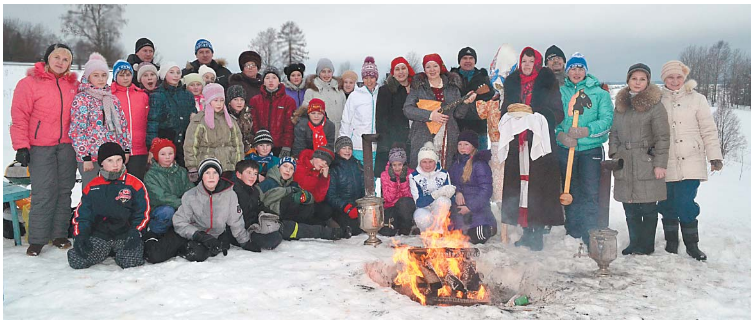
6 «в» класс с родителями встречают Масленицу в деревне Рогачиха.