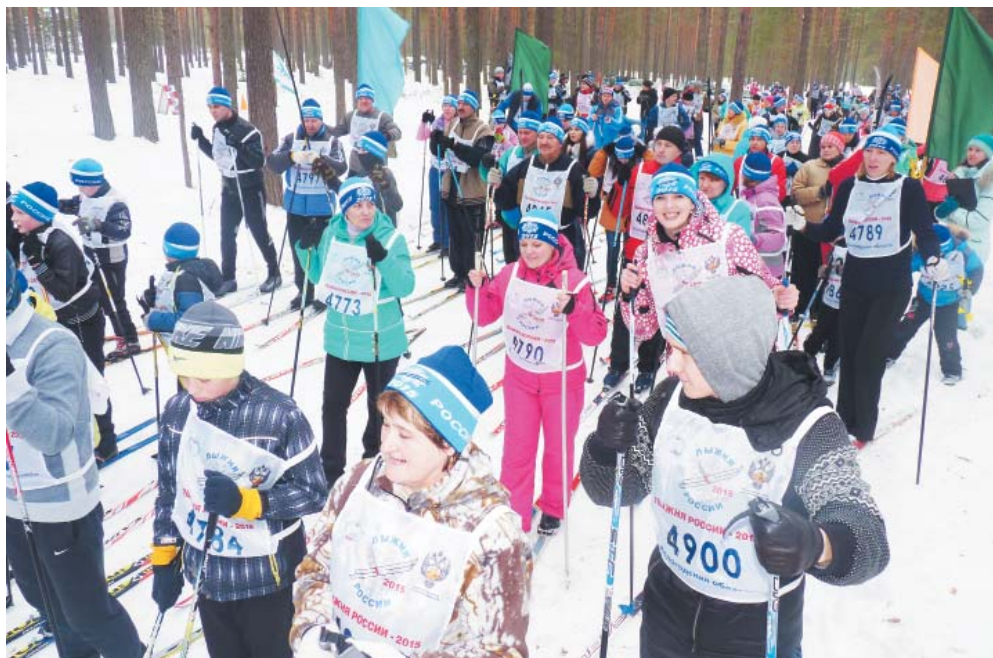
Участники забега стартовали все разом