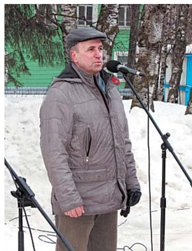
Глава Верховажского с/п открыл праздник