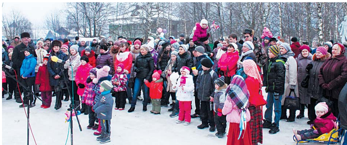
Верховажане и гости села с удовольствием смотрели выступление артистов