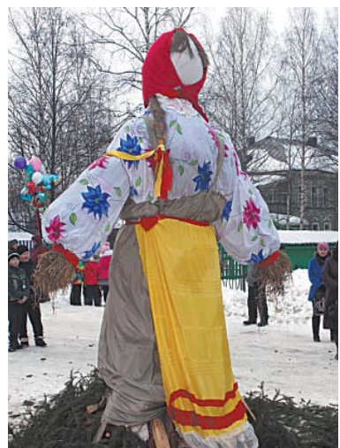
Масленицу изготовили мастера ЦТНК