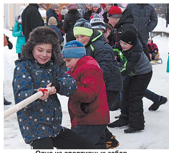
Одна из спортивных забав — перетягивание каната