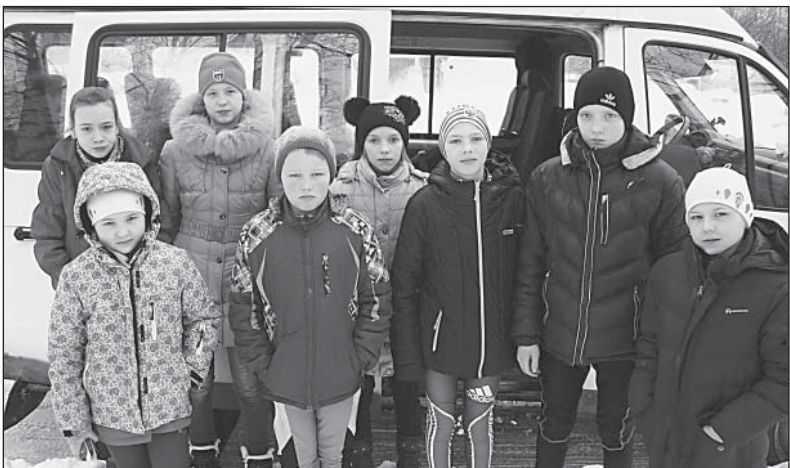
Верховажская команда лыжников в Вожеге