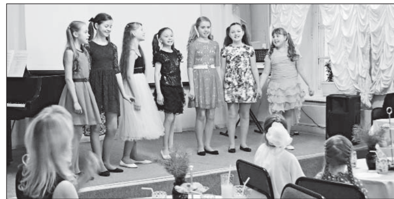
Младший вокальный ансамбль исполнил эстрадную песенку в джазовом стиле «Я учу английский»