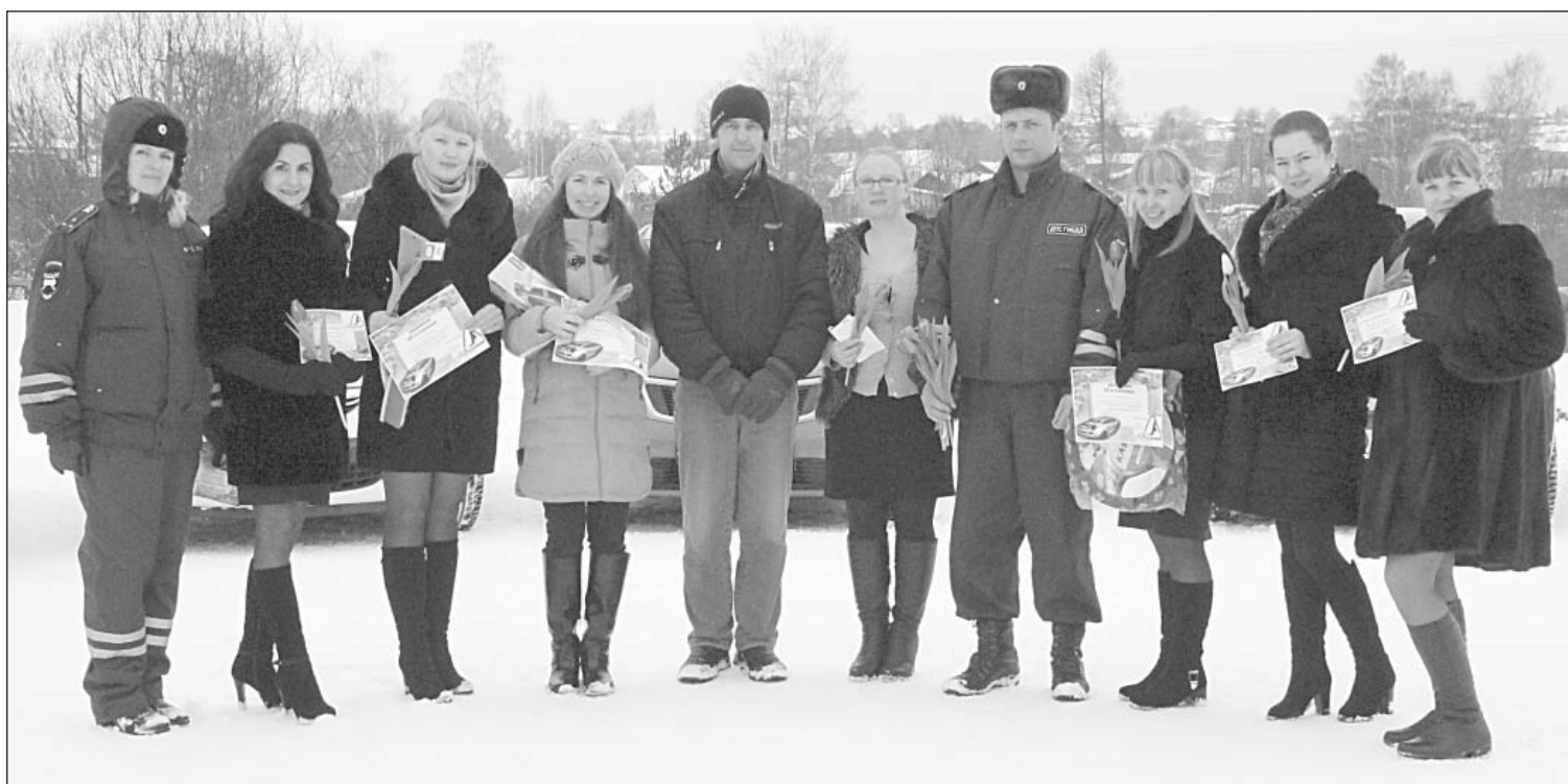
Участницы конкурса «Автоледи-2016» с членами жюри и организаторами