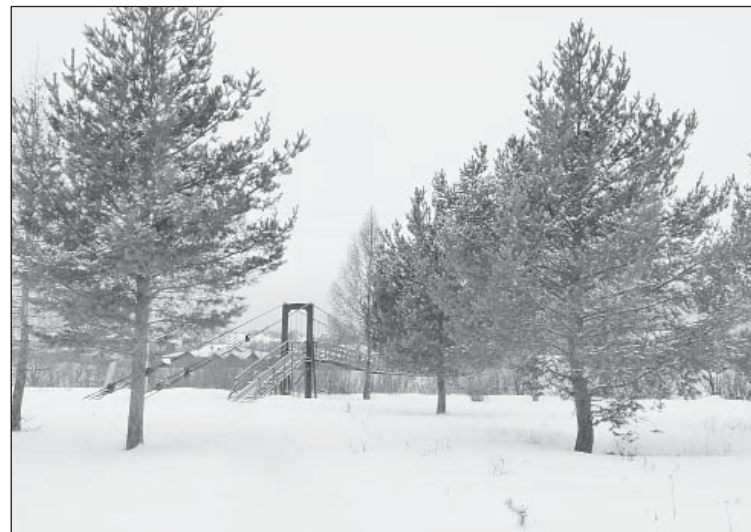
Пока в парке лежит снег, но весной здесь наведут порядок волонтеры

Проект редакции при поддержке Управления информационной политики правительства Вологодской области