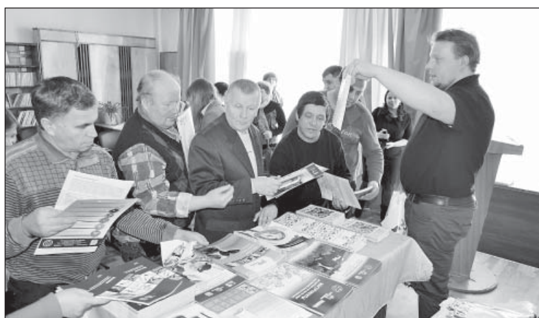
Верховажские аграрии продукцией компании «Лаллеманд» заинтересовались