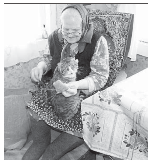
Хозяйку я застал за вязанием, 2016 г.

застоях не думали. Уж не знаю, кто такое выражение придумал.