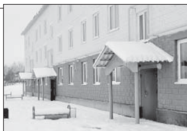
Многоквартирный дом на Кошеве построен по федеральной программе

На сегодняшний день в рамках 1 и 2 этапов программы уже переселено 3993 человека, расселенная площадь составляет 65,5 тыс. кв.м. По причине срыва сроков ввода в эксплуатацию пяти домов в четырех муниципалитетах регионе