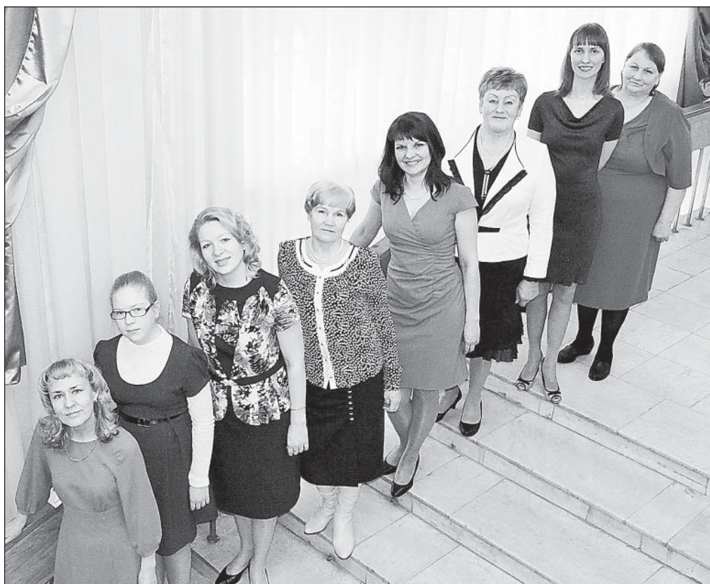
Верховажская делегация на праздничном мероприятии в Вологодском областном драматическом театре.