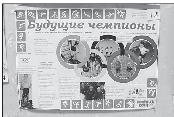
«Самая познавательная газета» семьи Остапенко.