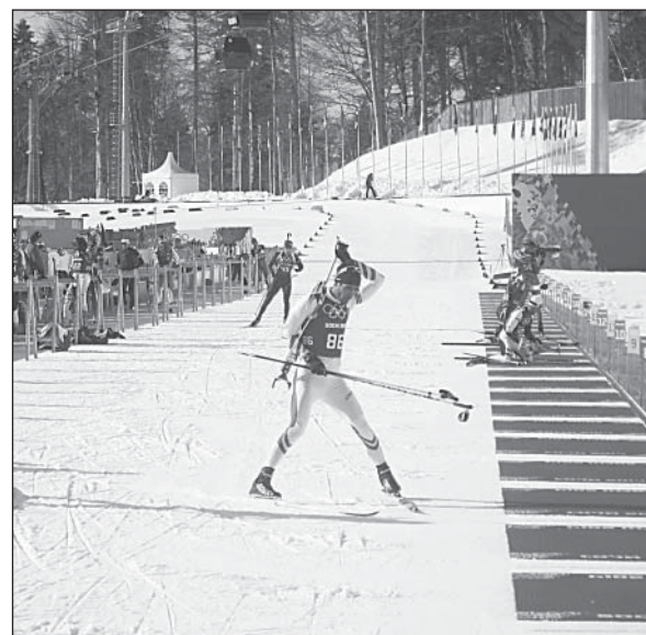
Мартен Фуркад прибыл на огневой рубеж.