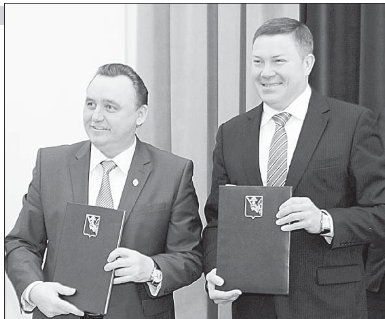
Мэр Вологды Евгений Шулепов и губернатор Вологодской области Олег Кувшинников подписали договор о сотрудничестве.

«Сегодня нам крайне необходимы регулярные рейсы в Москву и Санкт-Петербург. Поскольку это напрямую будет отражаться на развитии города. Вологда позиционирует себя как культурная и научная столица региона. Кроме того, Вологда – это еще и крупный туристический