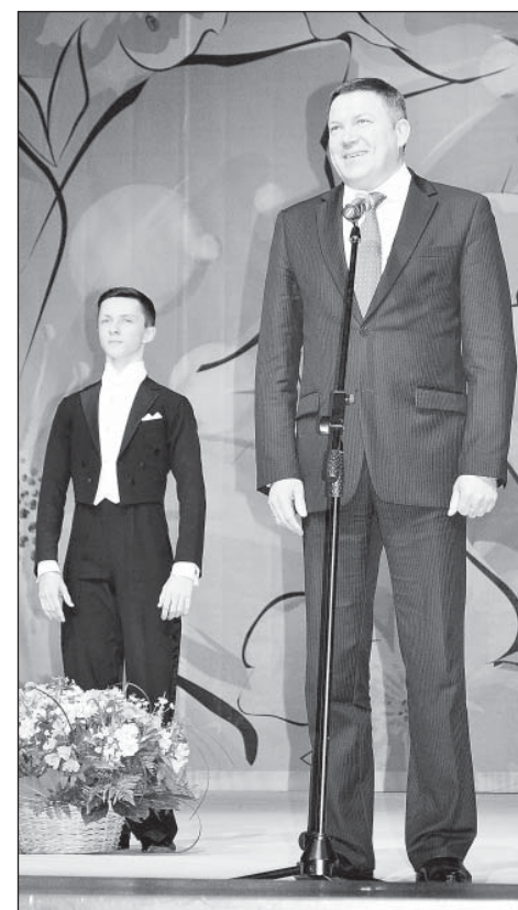
Поздравляет губернатор области О.А. Кувшинников.