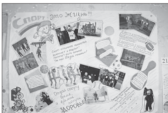
«Самая спортивная газета» семьи Пищалева.