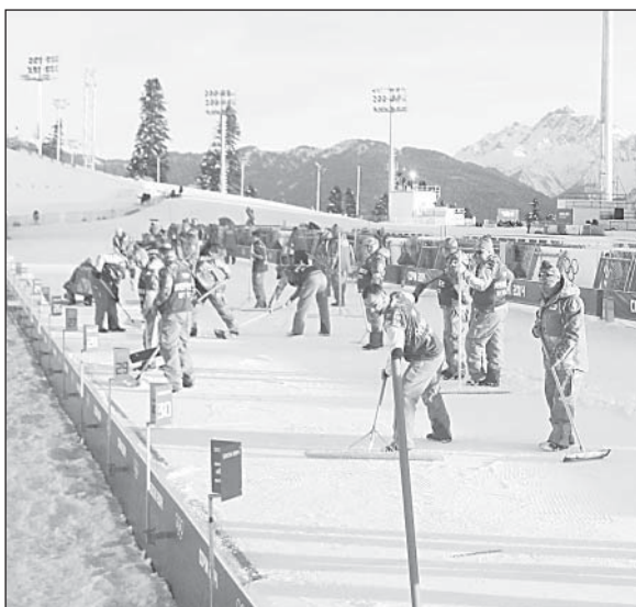
Судьи за работой по подготовке трассы на стрельбище.