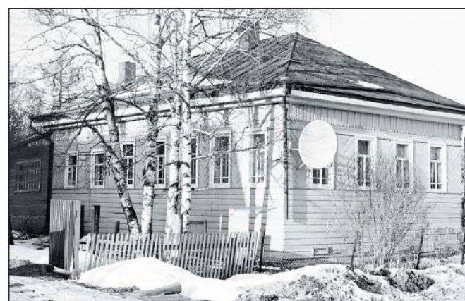
«Дом Третьяковых» построен в 80-е годы XIX века