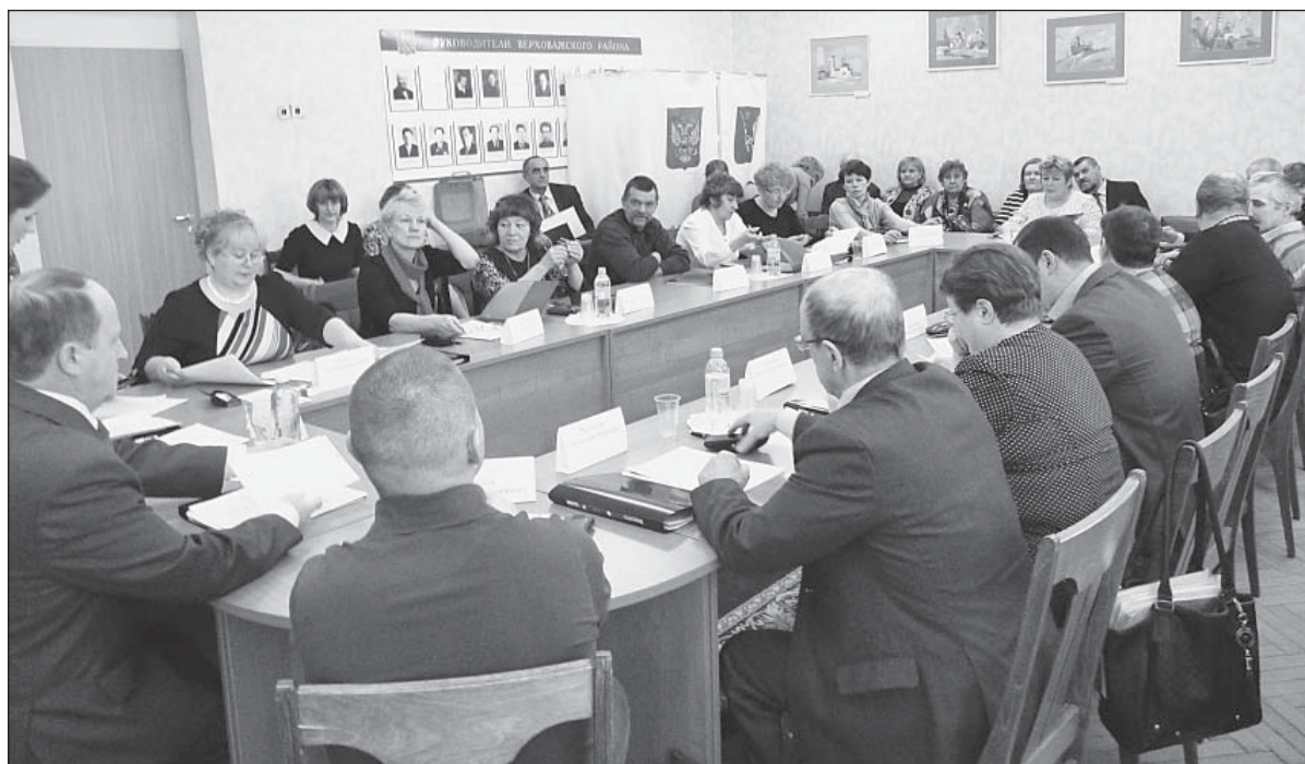
Новый состав Представительного собрания во время заседания. Для тайного голосования в зале установили кабинку

Уже в открытом режиме большинством голосов депу-