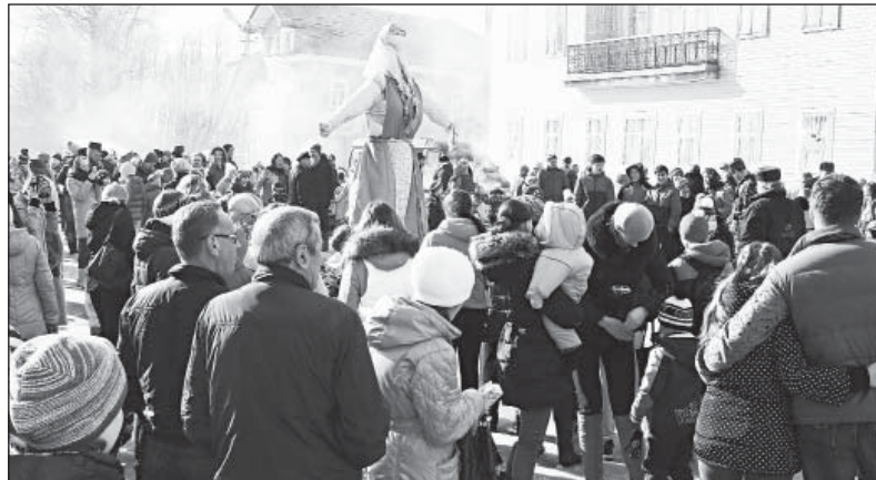
По традиции народные гуляния собрали много народу