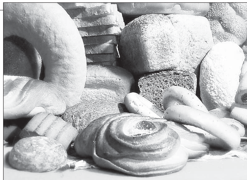
На социально значимую продукцию Вологодского хлебокомбината цены в 2015 году повышать не будут.

Меньше всего рост цен коснулся яиц, молока, свинины, белокачанной капусты и помидоров. Стоимость первых регулируется местными