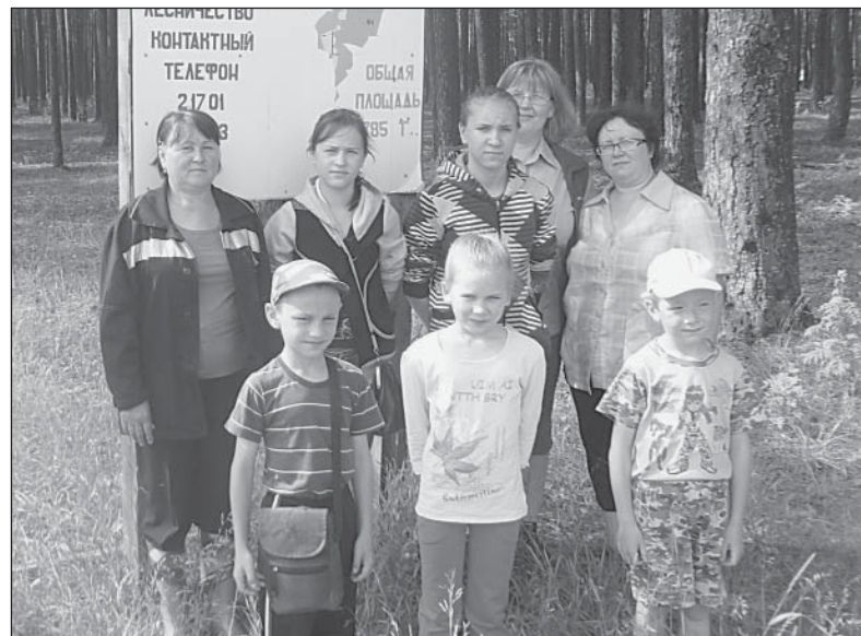
Экспедиция в ландшафтный заказник «Верховажский лес».

Флора заказника насчитывает около 120 видов высших растений и лишайников. Из редких в Вологодской области видов на территории государственного природного заказника отмечены: княжик сибирский, калина обыкновенная, волчегонник, дифазиастрем