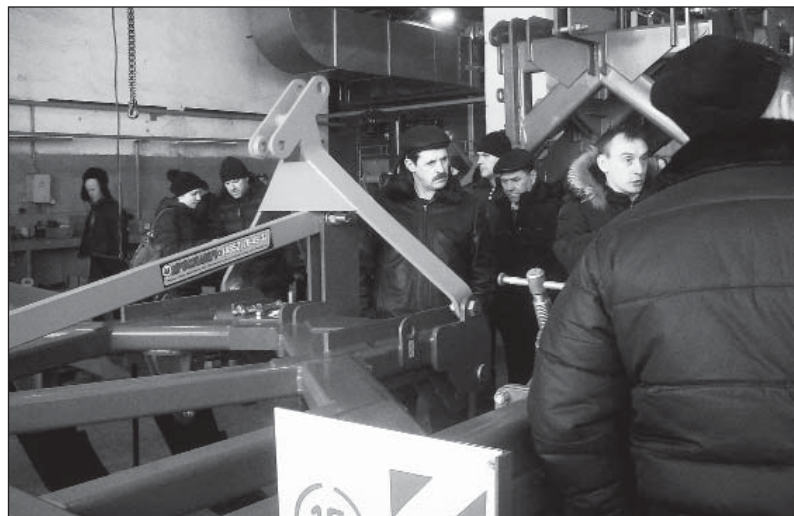
В цехе завода «Ярославич»

Молозиво новорожденным телятам размораживают, подогревают и развозят «молочным такси». Каждый теленок получает его по норме, не более пяти процентов от своего веса в день. На четвертый