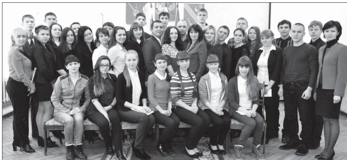
Новое поколение парламентариев.

Первые Молодежные парламенты возникали по инициати-