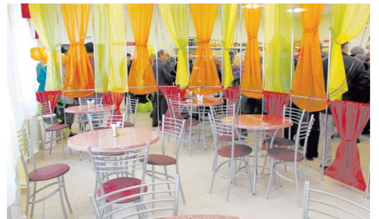
Кафетерий на 26 посадочных мест

Продолжается ДОСРОЧНАЯ ПОДПИСКА на «Верховажский вестник» на 2 полугодие 2016 года ВО ВСЕХ ПОЧТОВЫХ ОТДЕЛЕНИЯХ РАЙОНА. Только в марте выписывайте «ВВ» по прошлогодним ценам: 6 месяцев - 670,86 руб.