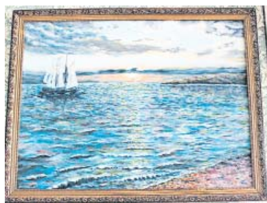
Картины Валентины Романовны