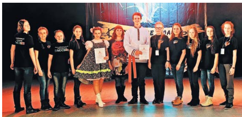
«Рассвет» получил диплом II степени в номинации «Народный танец»

Трехдневный фестиваль завершился гала-концертом, где свои лучшие номера показали лауреаты конкурса и его гости.