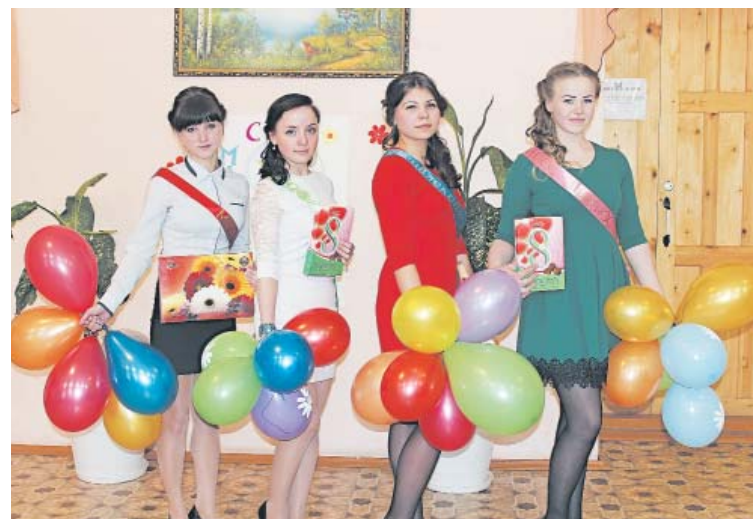
Участницы хороши как на подбор

Проект редакции при поддержке Управления информационной политики правительства Вологодской области