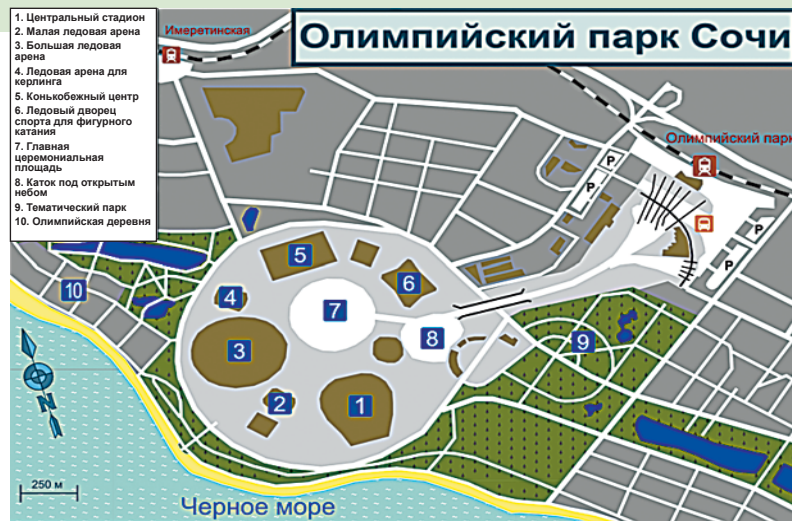
Схема парка Сочи.