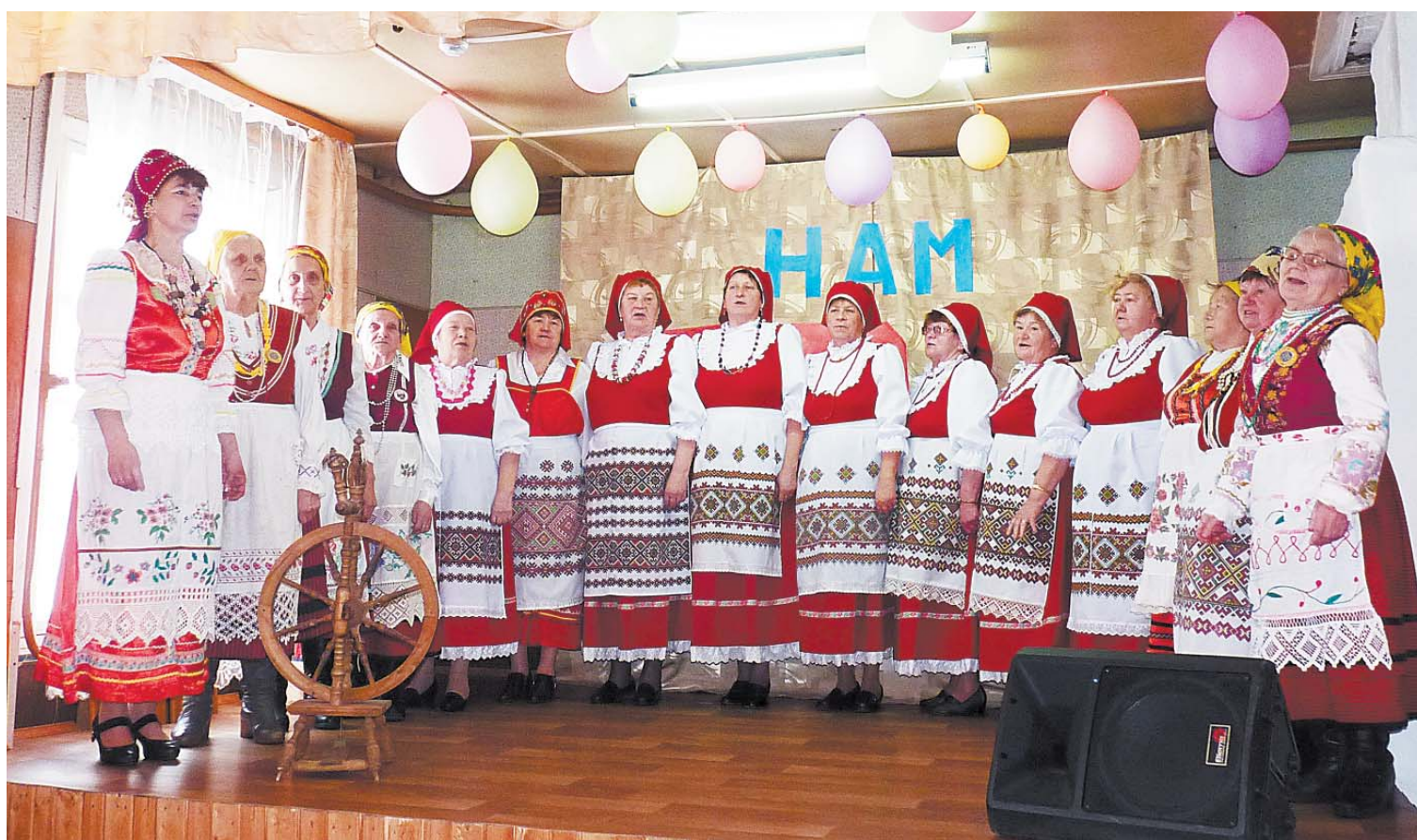
Фольклорно-этнографический коллектив «Прялица» в полном составе.