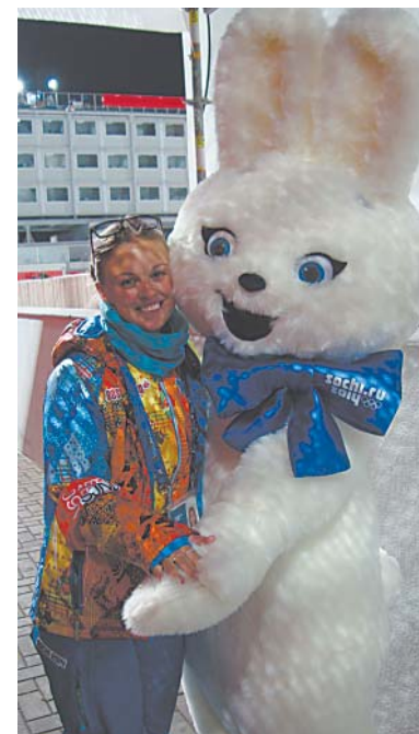
С олимпийским зайкой.

С таким чувством радости и гордости за Россию я и покидала олимпийский Сочи. Осознание всей грандиозности этого мероприятия и то, что все закончилось, пришло ко мне уже, когда я приехала домой. Естественно, немного взгрустнулось, ведь закончилась моя Олимпиада! Закончились три лучшие недели в моей жизни! Но очень хочется верить, что когда-нибудь мне вновь посчастливится увидеть олимпийский огонь.