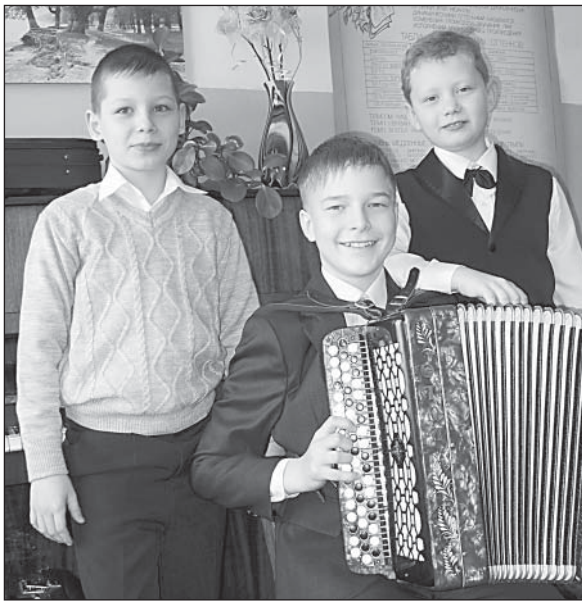
Верховажские баянисты и художники — участники конкурса в Соколе.