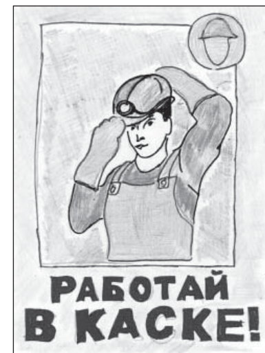
Детский рисунок по теме безопасности труда (2012 год) выполнен достаточно профессионально.

ющее поколение. Для юных вологжан предусмотрен конкурс «Охрана труда глазами детей». Причем, для разных возрастов: до 9 лет, с 9 до 14 лет и от 14 до 18 лет. Принимаются рисунки, открытки, брошюры, плакаты. Темы соответствующие: «Труд должен быть безопасным», «Безопасность труда моих родителей», «Инструктаж по охране труда в картинках», «Спецодежда может быть модной», «Соблюдаем требования безопасности дома и в школе» и так далее. Главная цель, цитирую: «Обучение детей и подростков навыкам безопасного труда и сохранения здоровья путем актуализации в их творчестве тем, связанных с отработкой методов безопасного выполнения работ и сохранения здоровья при возможном воздействии на организм чело-