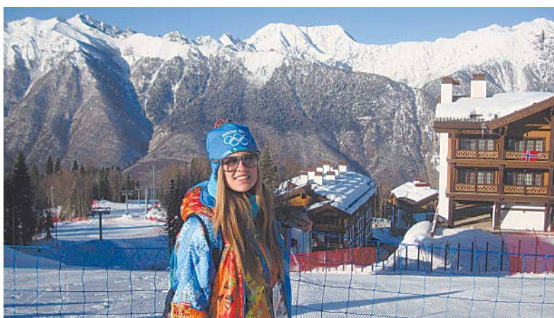
На фоне гор.

стран значительно подтянуло мой английский. В свободное время атлеты сами подходили к нам поболтать. На удивление, они все очень просты в общении, без признаков так называемой «звездной болезни».