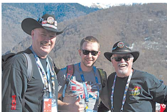
С болельщиками из США.