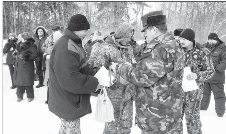
Награждение победителей и призеров.

Несомненно, перед стартом главным фаворитом состязаний считалась шелотская команда, прошлогодняя победительница биатлона. Шелотяне и в самом деле заняли призовое место, но лишь третье. А победителем в командном зачете стали чушевицкие охотни-