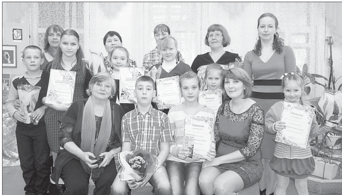
Участники конкурса «Творческая семья».