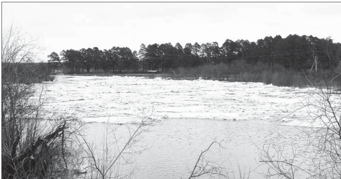
Ледоход на Ваге, 2011 год.

Каких «высот» достигнет весенний паводок нынче, остается только гадать. Это зависит от массы условий природного характера, так что сделать прогноз с минимальной степенью погрешности практически невозможно. Да и нужно ли? Важнее заре-