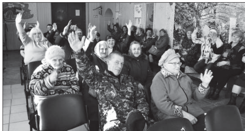
Жители Климушина проголосовали против объединения.

13 марта в сельских поселениях Верховажское, Наумовское, Климушинское и Терменгское состоялись публичные слушания по вопросу объединения.