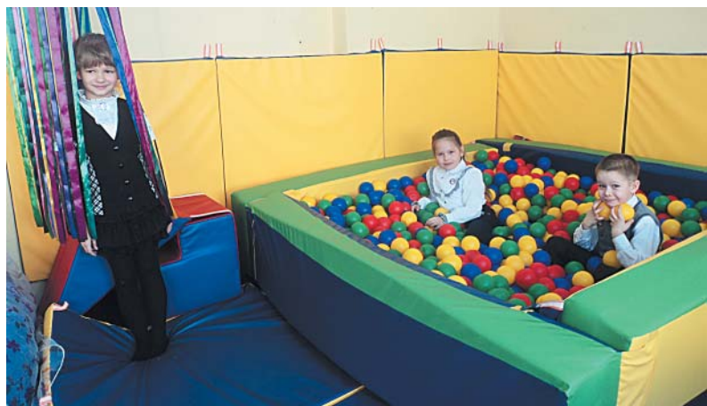
Сенсорный кабинет для детей с ограниченными возможностями здоровья

Учителя школы активно общаются и распространяют свой опыт, участвуют и добиваются высоких результатов в мероприятиях муниципального, регионального и федерального уровней. В 2013-2014 учеб-