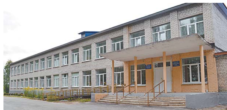
Верховажская средняя школа им. Я.Я. Кремлева