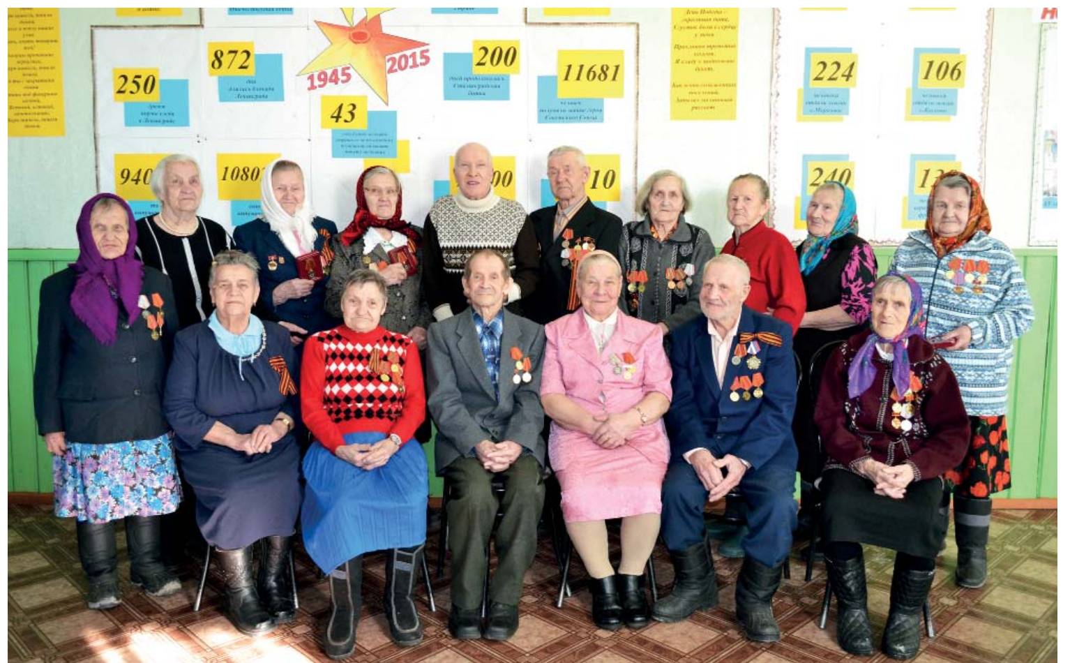
Труженики тыла и солдатские вдовы из Морозова, Коскова и Печмы после торжественного вручения юбилейных медалей.