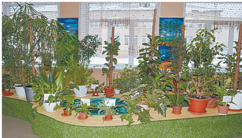
Зимний сад в одной из рекреаций