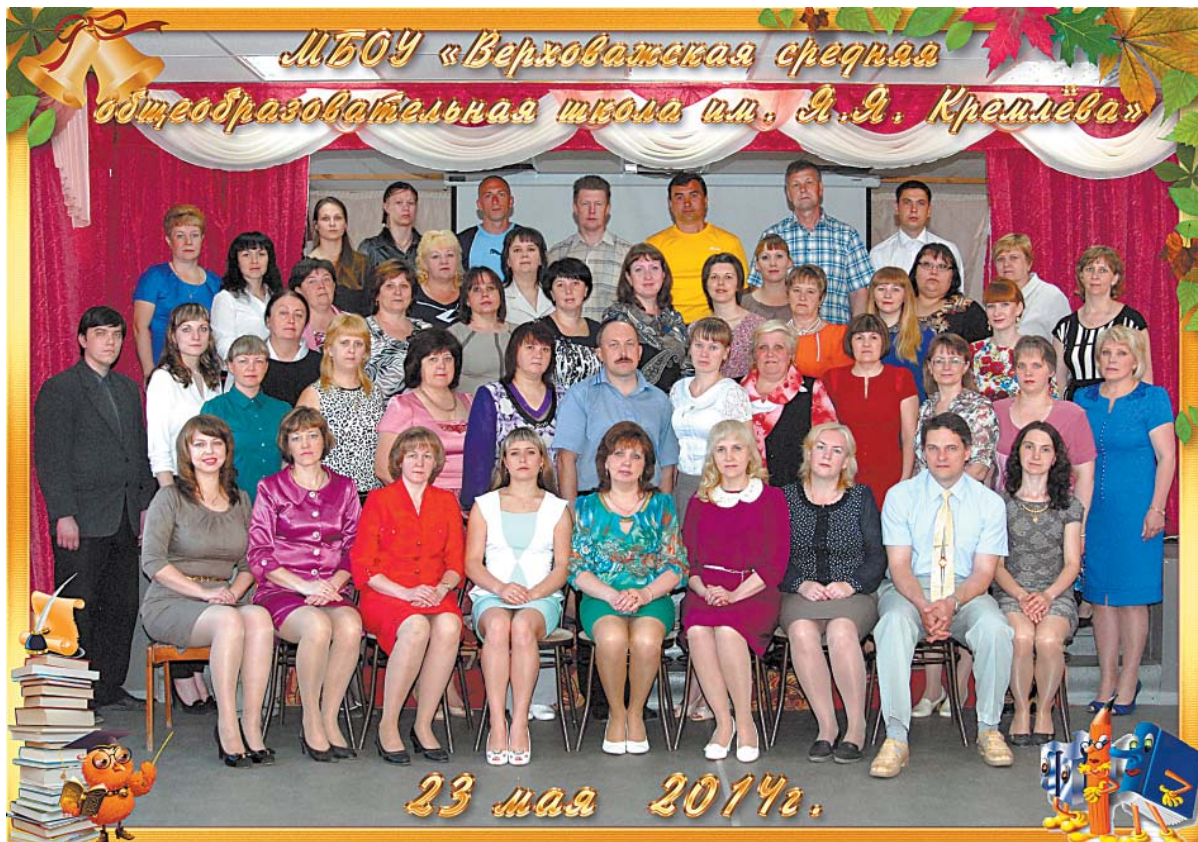
Педагогический коллектив школы