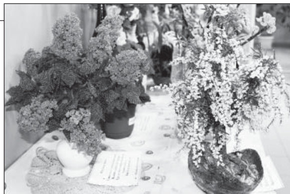
Изготовление поделок на конкурс требовало аккуратности, старания и и хорошего вкуса.