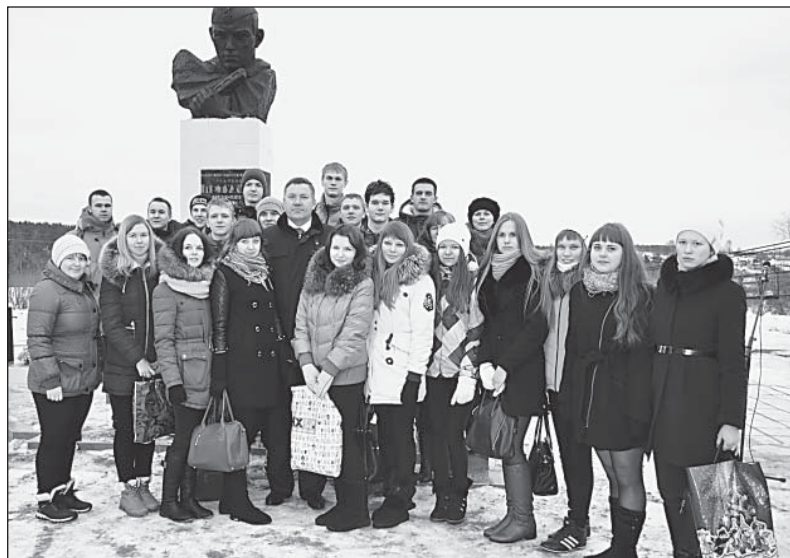
Губернатор области О.А. Кувшинников со старшеклассниками. Март 2015 года