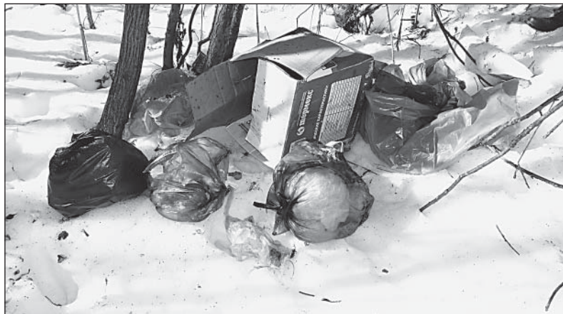
Проснется ли совесть у намусоривших?

знаем и поддерживаем чистоту не только у своих домов, но и вокруг деревни. А тут нам такой вот «подарочек» подбросили. Сейчас днями очень хорошо тает, и вся эта грязь попадет в ручей, который находится внизу. А мы из него и на поливку воду берем, и белье полощем. Да не только мы! Ручей впадает в речку Кошевку, а та — в Вагу. Может быть, проснется совесть у того, кто это сделал, и он уберет свой мусор?