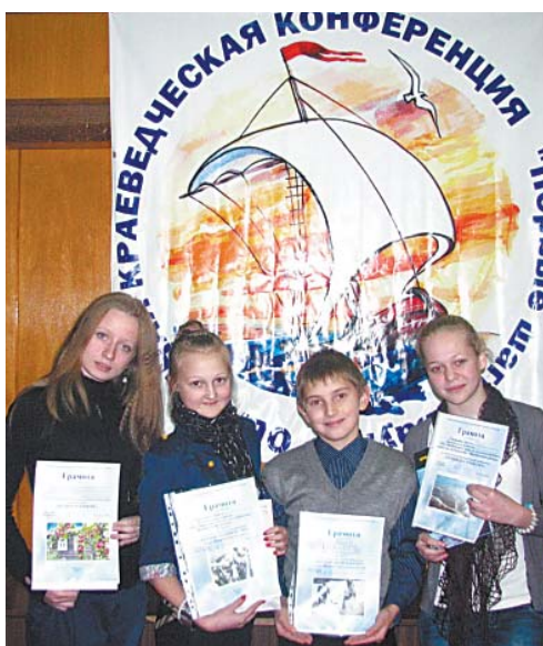
Участники краеведческой конференции «Первые шаги в науку»