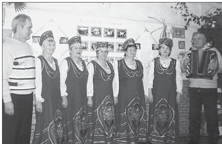
Шелотский ансамбль «Горенка»