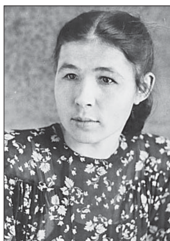
Вот такой Ангелина приехала в Верховажье