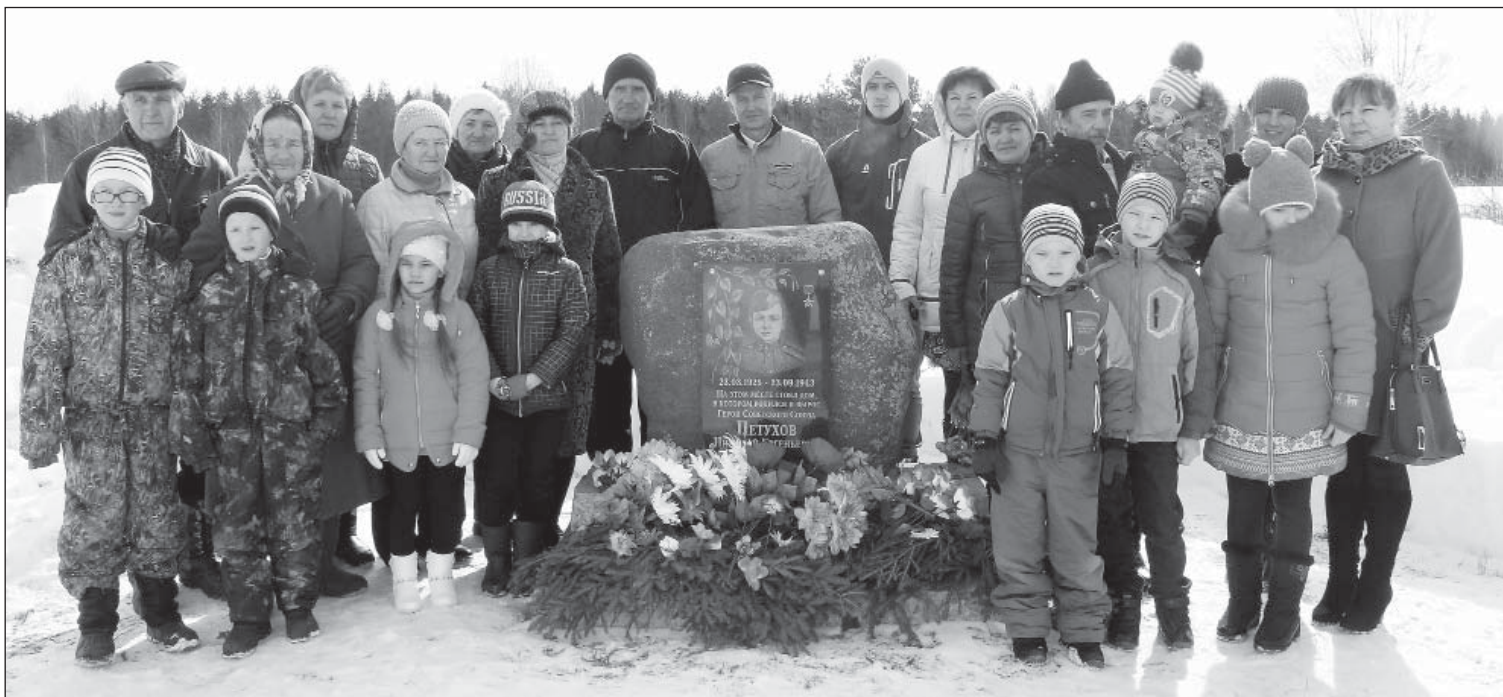
Родственники Героя у памятного знака на месте его родительского дома (д. Михалево, Шелотское сельское поселение).

Подготовили Владимир Басов, Ольга Гулина