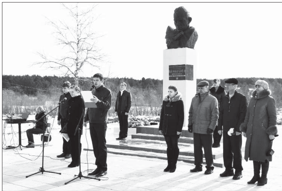
Митинг у памятника Н.Е. Петухову в Верховажье.