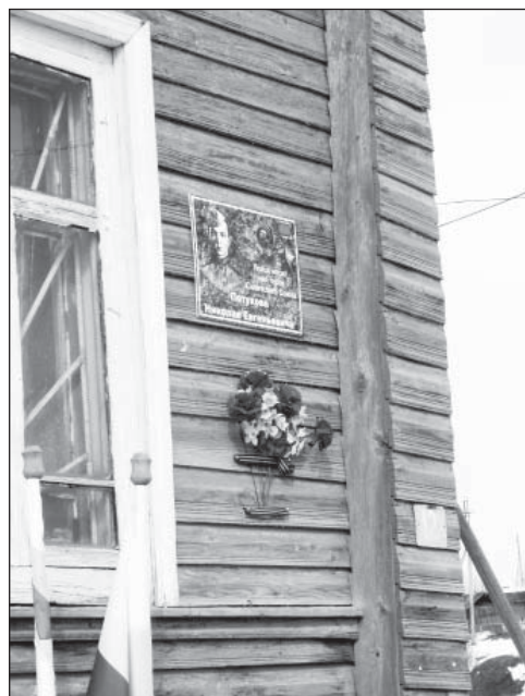
Памятная доска на здании краеведческого музея Шелотской школы.