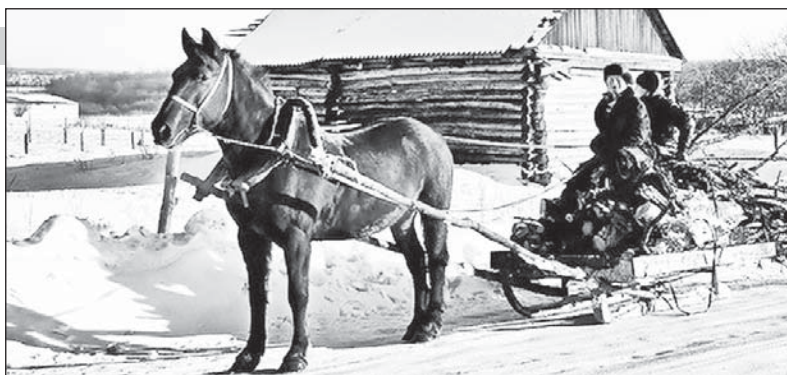
Лошадь была в деревне главным транспортом.

Чтобы по дороге назём не высыпался, на сани-дровни