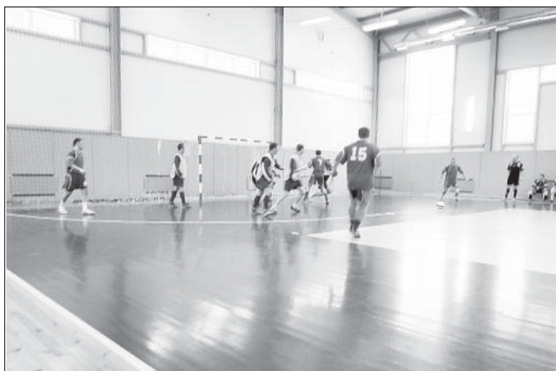
Момент встречи верховажских «Ветеранов» с командой Грязовца.

В самом конце турнирной таблицы оказалась верховажская «Лига». На мой взгляд,