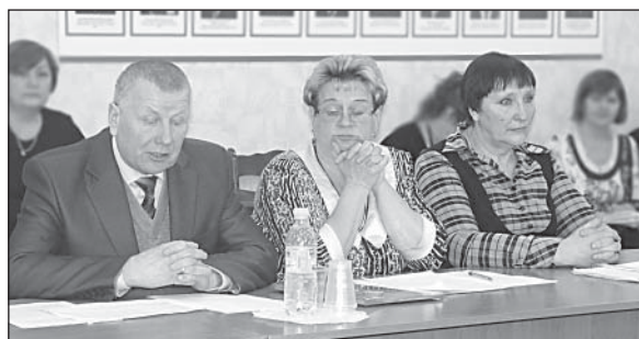
Управление сельского хозяйства отчиталось перед Представительным Собранием о состоянии дел в отрасли.

Тему сельского хозяйства можно обсуждать долго и по-разному. Реформы конца XX века не принесли селу ничего хорошего. Ругать или оправдывать их, реформы, можно, но нет смысла. Дело сделано, а жить надо сегодня, сейчас. Тем более, что в последние годы на высоких трибунах (жаль, не на самых высоких) стали обсуждать положение дел в сельском хозяйстве, поднимать тему продовольственной безопасности, предлагать меры поддержки ответственного сельхозпроизводителя