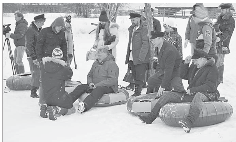
Участники готовятся отправиться вниз — за пирогом.