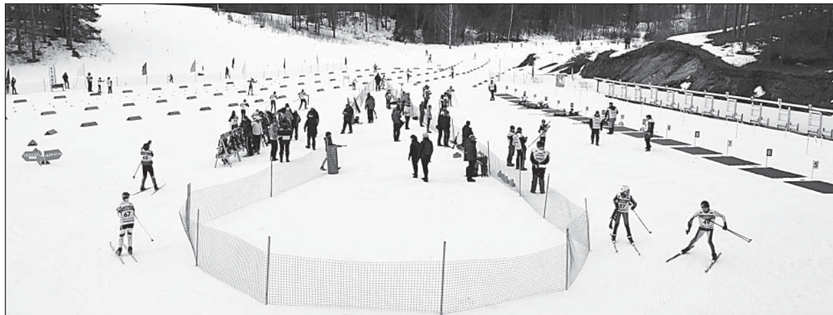
Вид на огневой рубеж и штрафной круг