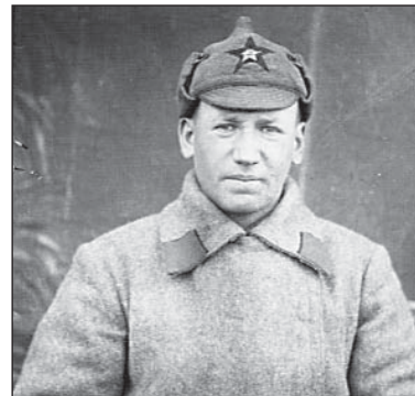
Перед отправкой на фронт, июль 1941-го.