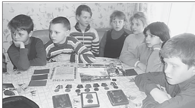
Рассказ ветерана заинтересовал всех

Чтоб снова на земной планете Не повторилось той зимы, Нам нужно, чтобы наши дети Об этом помнили, как мы! Я не напрасно беспокоюсь, Чтоб не забылась та война: Ведь эта память — наша совесть, Она, как сила, нам нужна.