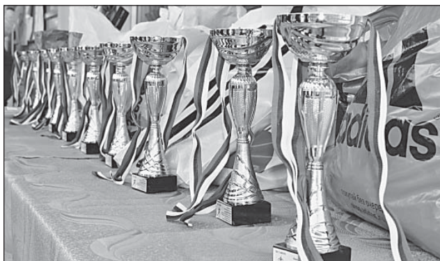
В этом году было разыграно десять комплектов наград