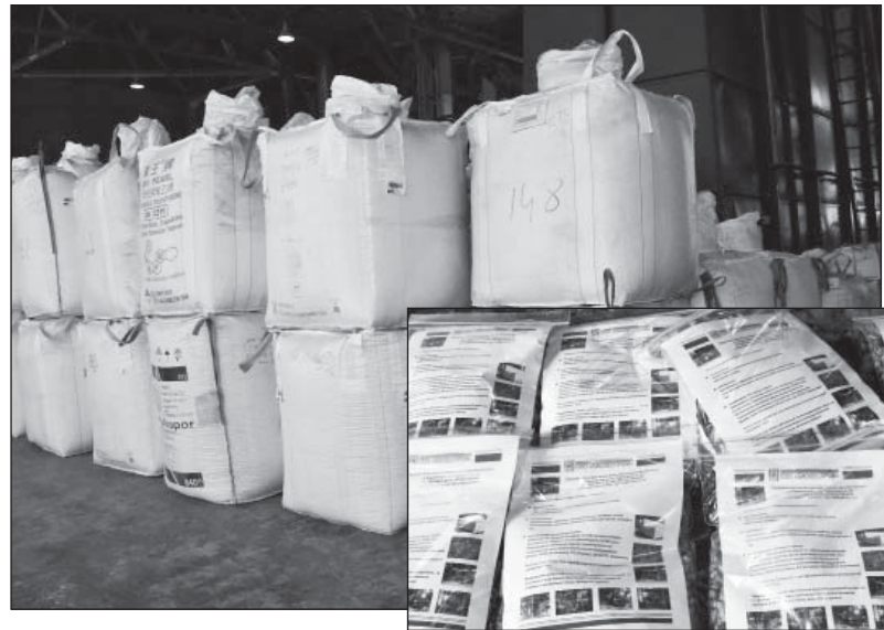
Пеллеты производства ООО «БиоЛесПром» в разной упаковке.

И дело тут не только в том, что 84 процента лесфонда находится в долгосрочной аренде, а для расторжения договора аренды нет оснований. И даже не в том, что последние зарезервированные свободные кварталы отданы под реализацию инвестиционного проекта. По мнению главы района, сама схема отпуска древесины несправедлива и неэтична. По инициативе депутатов планируются обращения в Законодательное собрание области, общественную палату, чтобы побудить департамент лесного комплекса пересмотреть регламент и процедуру. Трудно сказать, даст ли