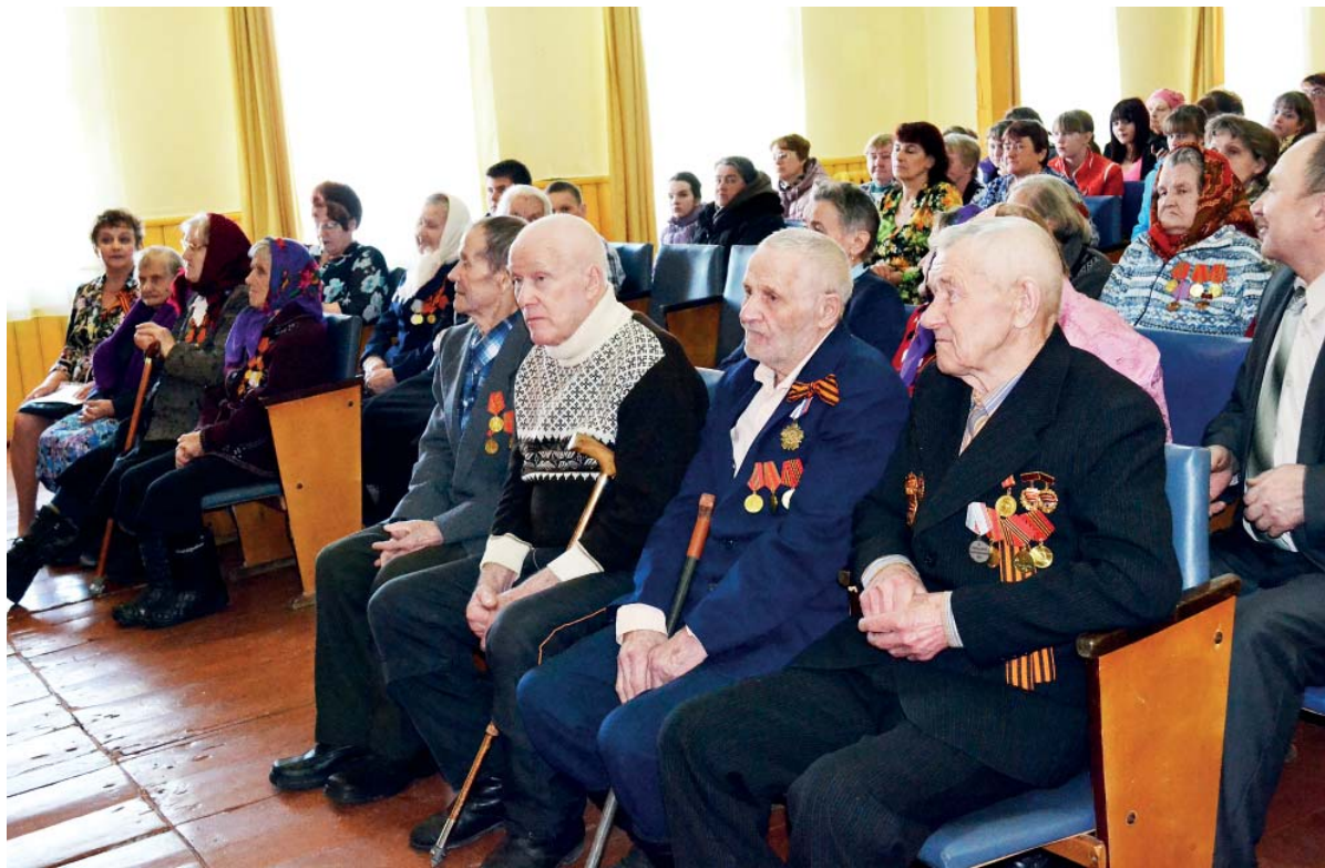
Зрительный зал был полон