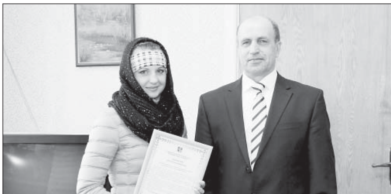
Глава района вручил чемпионке России Благодарственное письмо и памятный подарок

Сотрудники администрации не скрывали гордости и радо-