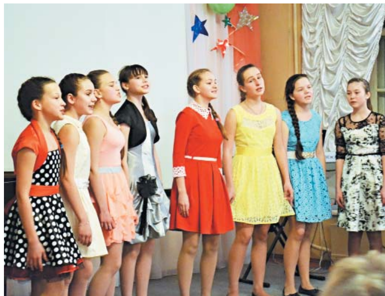
Вокальный ансамбль «Радуга песен»