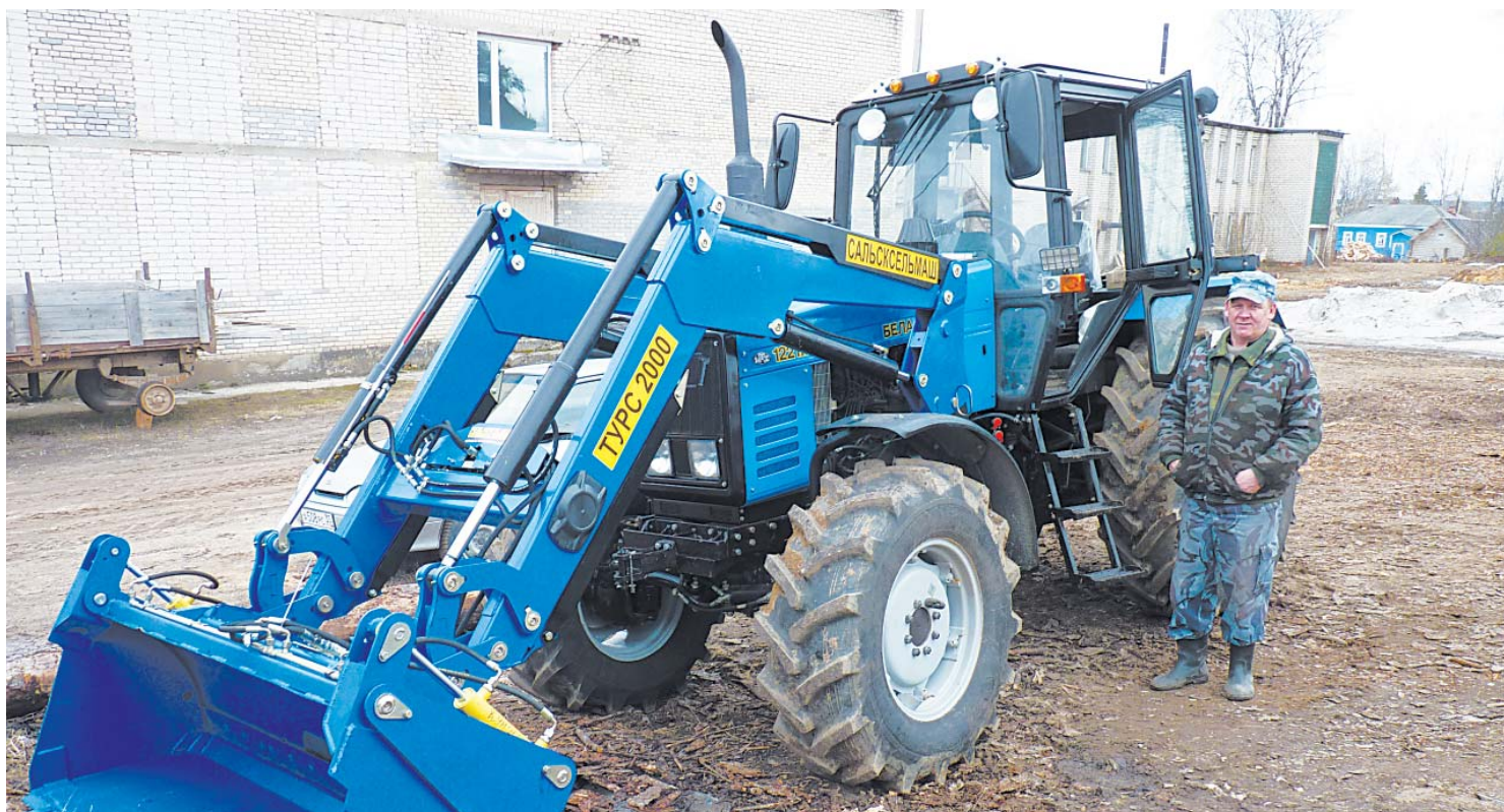
Новый трактор доверили опытному механизатору Юрию Кондакову