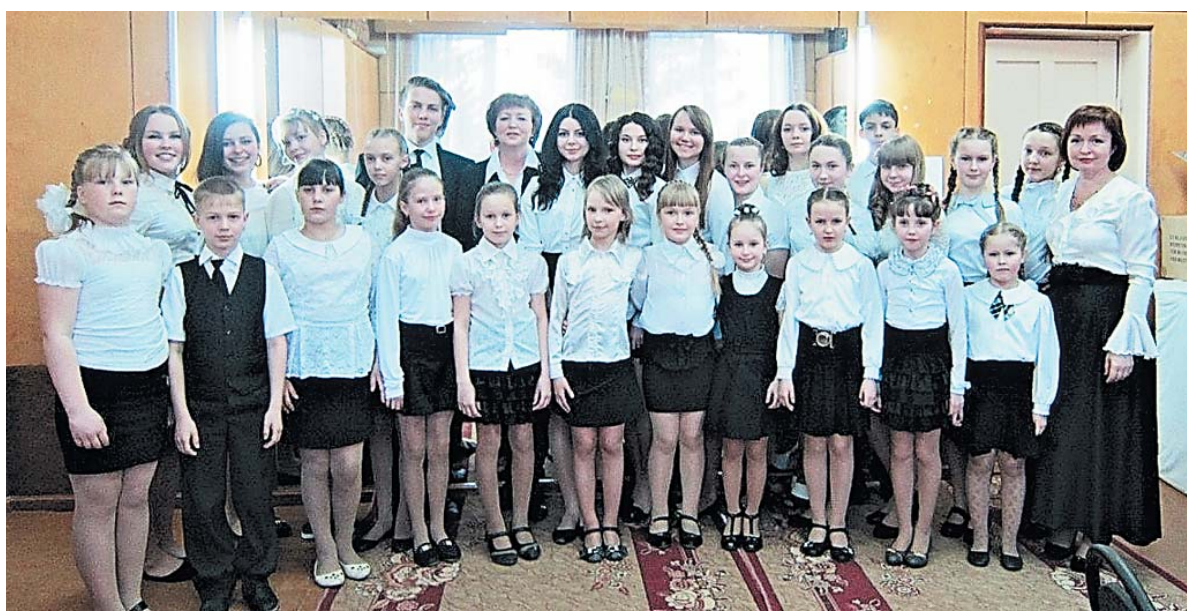
Учащиеся и преподаватели Школы искусств в с. Чушевицы

ная», где ожидаются интересные выступления семейных ансамблей, а также состоится традиционный концерт фортепианного отделения.