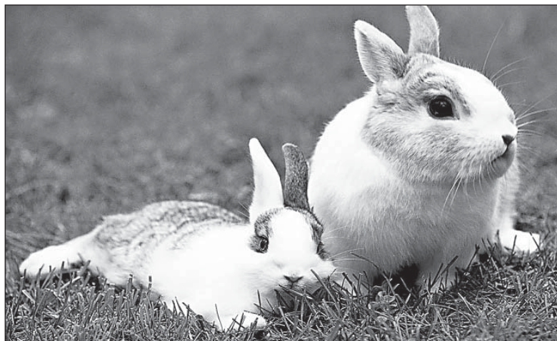
Зайчонок – сирота при родной матери

Считается: где осины, там и зайцы. Но не всегда. Конечно, в лесосеке он не преминет ошкурить сучья, вершину поваленной осины. И все же, прежде всего, он потребитель веточного корма. Зимой, чем снег глубже, сугробы выше, тем удобней ему добраться до вожделенных верхних сучков. Причем, по утверждениям специалистов, предпочитает остальным деревьям побеги ивы. Например, в декабре-марте, то есть в самое снежное время года, почти половину его кормового рациона составляет ива, треть – береза, потом уже – осина. Другое дело гари, зарастающие поляны. Там, случается, почти весь подрост осинки возрасту трех-пяти лет бывает подгрызен зайцами.