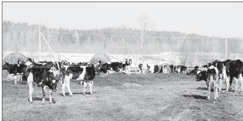
Телята успешно перезимовали под открытым небом

сте по удельному весу валового производства молока – СПК к-з «Н-Кулое» – 25% от общего объёма, на втором месте – СПК к-з «Липки» – 15%, на третьем – ООО СП «Вага» – 10,4%.