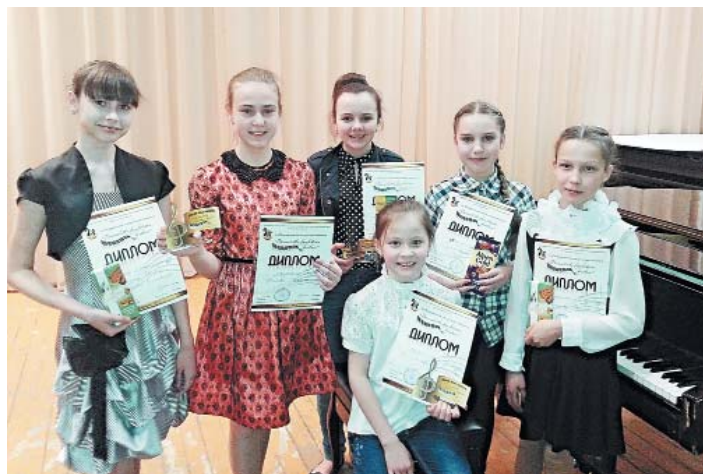
На конкурсе пианистов, г. Вельск

Продуктивно работают творческие коллективы школы: хоры, оркестр русских народных инструментов, ансамбли баянов, флейт, домристов, гитаристов, вокальный ансамбль преподавателей «Вдохновение». Особой гордостью ДШИ является образцовый художественный коллектив «Раду-