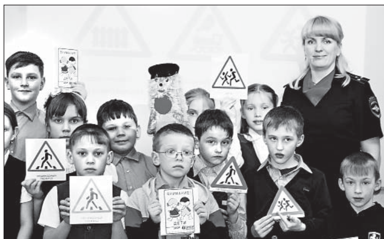
Ребята узнали много нового о дорожных знаках и не только