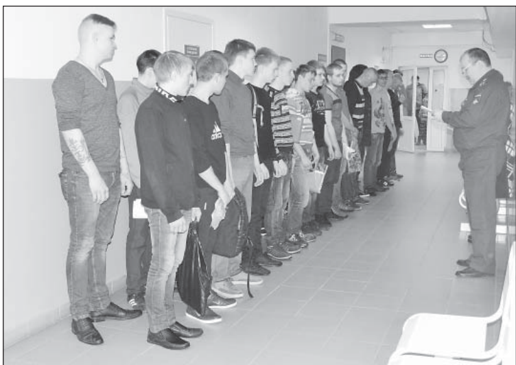
Из 40 человек, прошедших комиссию, служить отправятся десять верховажан

По итогам работы комиссии, из сорока юношей в ряды Российской армии призовут десять человек. Всего же из двух районов их будет 16. Новобранцы начнут отбывать к месту службы с 11 мая. Выпускникам 11 классов, собирающимся поступать в вузы, при положительных результатах ЕГЭ будет предоставлена отсрочка до 1 октября 2016 года.