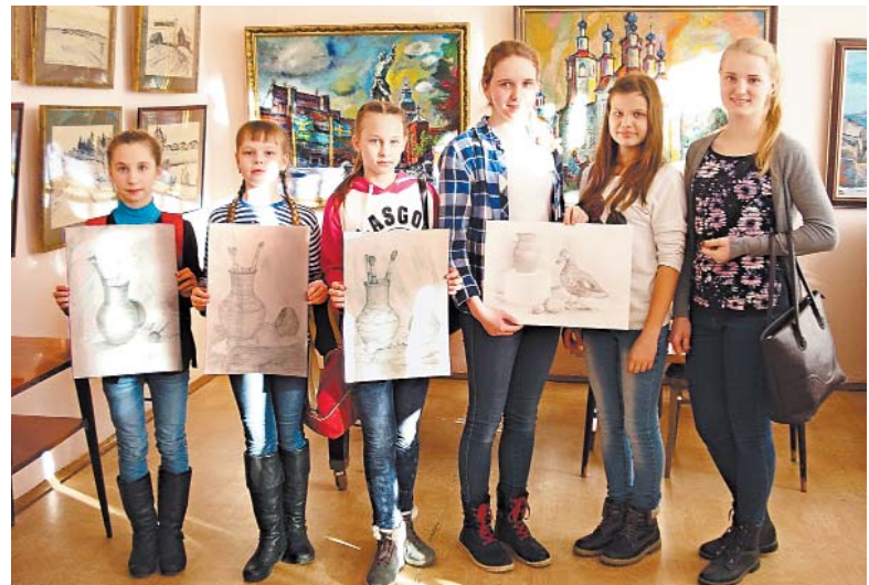
Учащиеся отделения ИЗО на конкурсе в г. Сокол