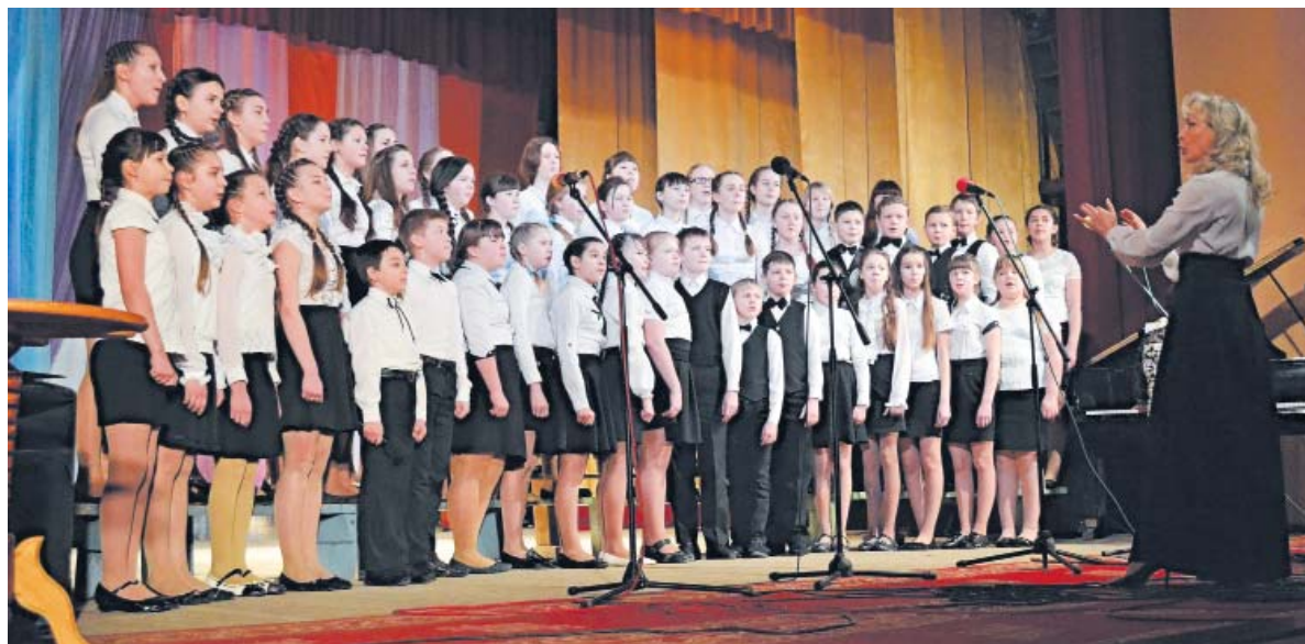
Хор старших классов Школы искусств

Каждый учебный год в школе полон планов и идей. И этот, юбилейный, не стал исключением. Продолжают работать проекты «Уроки детской филармонии», «Школа рисования для взрослых», проходят традиционные «Посвящение в юные музыканты и художники», новогодние представления. Цикл мероприятий и концертов этого года, конечно же, посвящен 45-летию школы. Познавательным и интересным событием стал фестиваль эстрадной и джазовой музыки « Музыкальный калейдоскоп », который прошел как совместный вечер отдыха и музицирования преподавателей и учащихся. В апреле состоится II районная ученическая конференция « Известные и знаменитые », которая посвящена юбилейным датам великих музыкантов и художников. В мае впервые в школе пройдет фестиваль семейного творчества « Музыкальная гости-