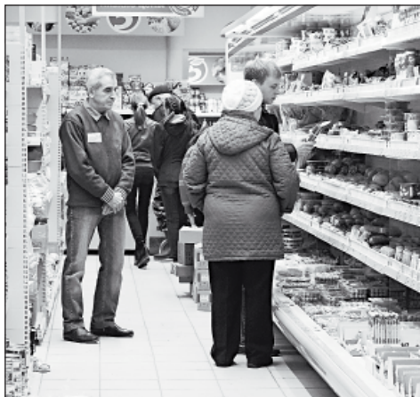
В верховажской «Пятерочке» почти всегда многолюдно, но и местные магазины пока позиций не сдают

Проект редакции при поддержке Управления информационной политики правительства Вологодской области