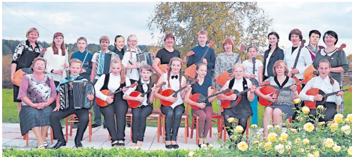
Оркестр русских народных инструментов