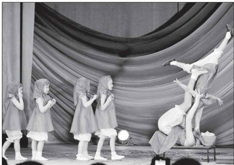
На сцене «Милашки – неваляшки»