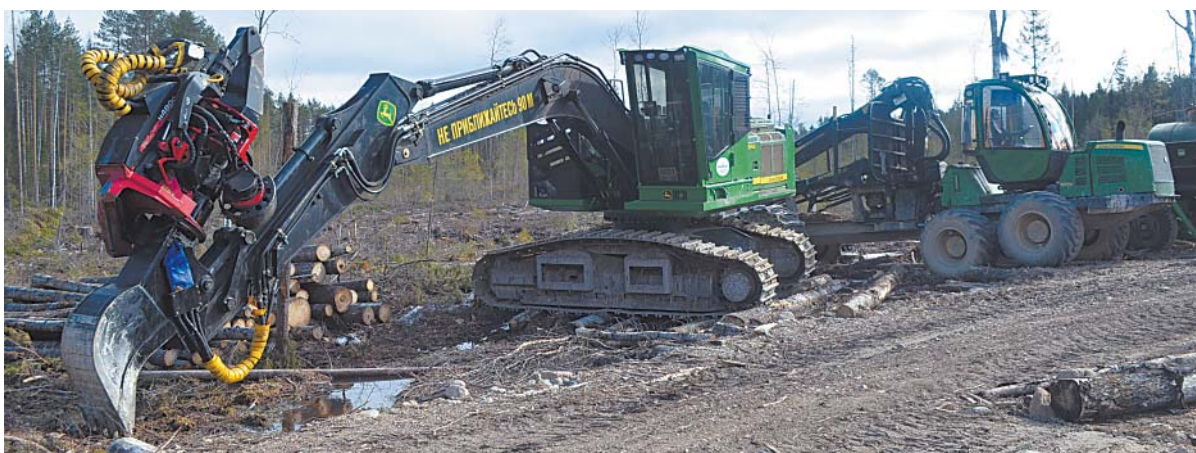
Заготовительный комплекс в лесной делянке.

На лесозаготовке «Верховажьлес», как и вся группа компаний «Вологодские лесопромышленники», использует исключительно высокотехнологичную технику известной шведской компании John Deere.