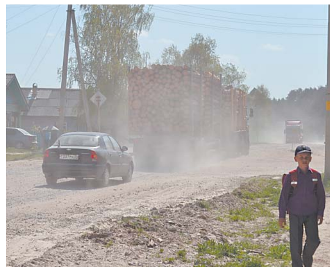
Страдают все: жители, цветы, деревья, пешеходы...