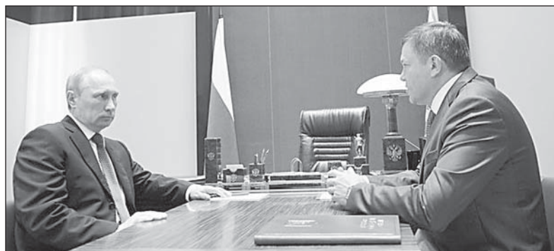
15 мая состоялась встреча Владимира Путина с Олегом Кувшинниковым.

Сейчас региону необходимо идти дальше. Я знаю о том, что программа развития Вологодской области до 2020 года подготовлена и принята. Для ее реализации необходима поддержка населения.