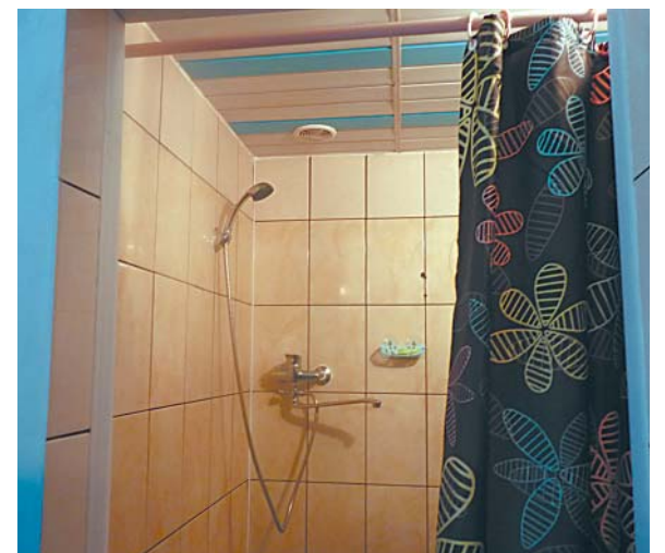
В распоряжении работников Верховажского лесопункта две душевых кабины.