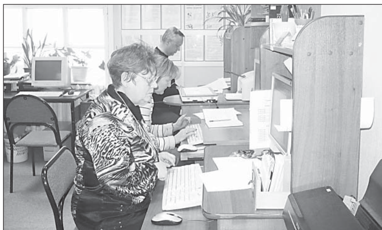
Сегодня в библиотеку идут не только за книгами, но и за компьютерными навыками.

В 1943 году в Верховажском районе насчитывалось 16 изб-читален, три сельских клуба, одна сельская библиотека, дом культуры и районная библиотека. В колхозах было создано 38 красных уголков. Книги в избах-читальнях были в основном политической и сельскохозяйственной тематики, ощущался большой недостаток художественной литературы.