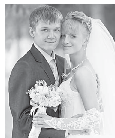
Настоящей любви приметы и предрассудки не помеха.

• После того как невеста отправилась из дома на венчание/регистрацию, нужно хотя бы символически помыть полы, чтобы невесте было легче