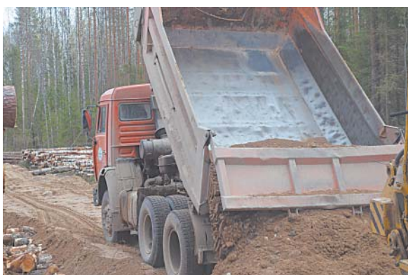
Идет отсыпка лесовозной дороги.