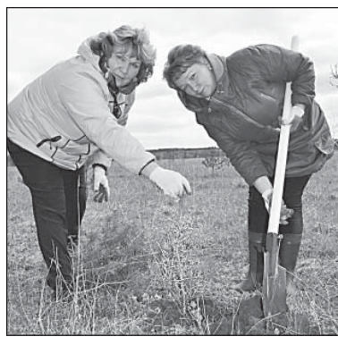
Посадили свое дерево...