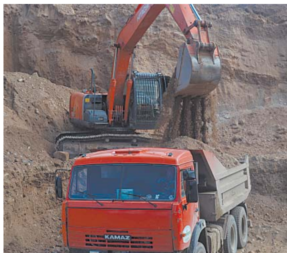
Строительству лесовозных «усов» «Верховажьелес» уделяет большое внимание.