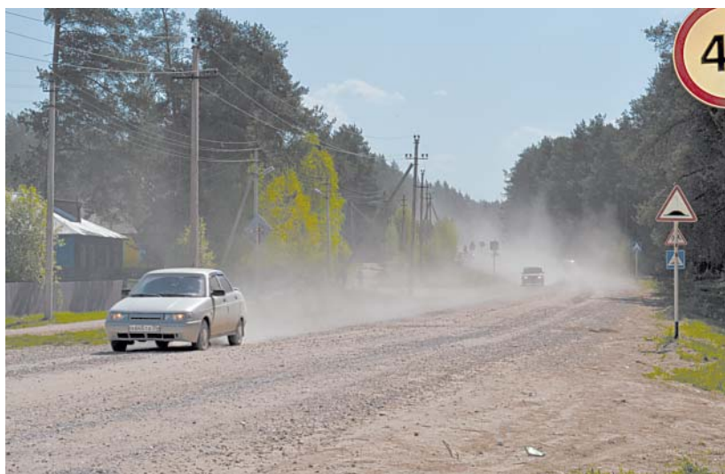
Пыль с дороги летит на территорию детского сада.