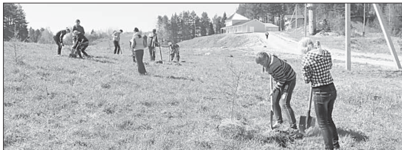
Посадка деревьев у Центра подготовки биатлонистов.