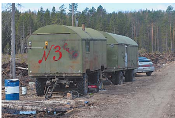
Жилой и сервисный вагончики для персонала.