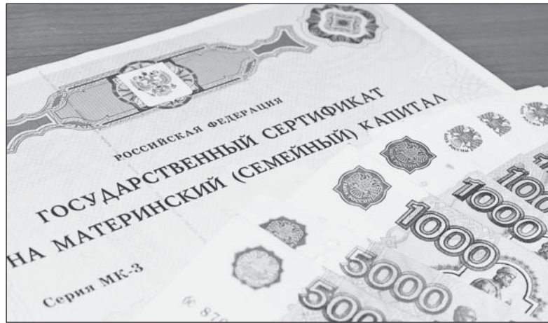
Чаще всего материнский капитал тратят на покупку жилья

При приобретении жилого помещения не всегда есть реальная возможность сразу оформить его в общую собственность