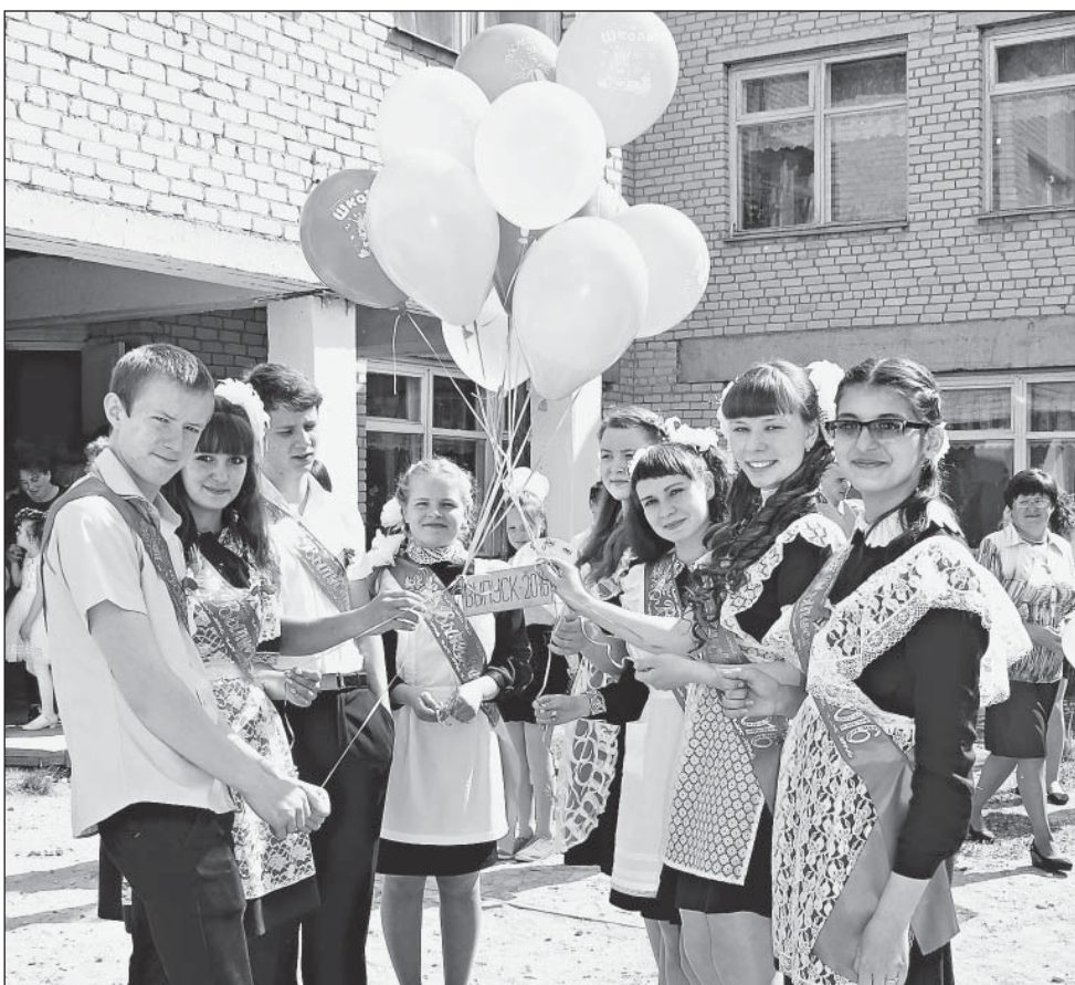
Одна из традиций нижекулойских выпускников – отпустить в небо воздушные шары