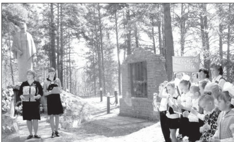
Митинг прошел у памятника Скорбящей матери

гармошка» и «Вальса фронтовой медсестры» зрители не только дружно аплодировали, но и плакали.