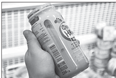
Цены на детское питание находятся «под присмотром» прокуратуры