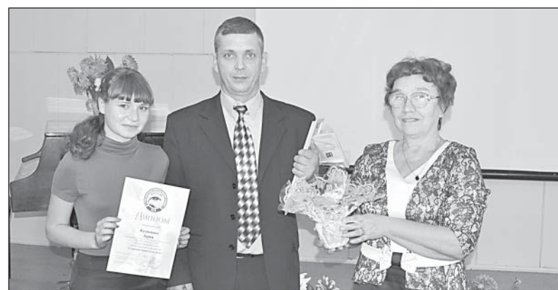
Участники первой экологической конференции «Сохраним природную среду». Такие мероприятия систематизируют разрозненный опыт в сфере экологии.

- Несколько лет назад я писал о трудовом лагере, который был создан при ДДТ. Преподаватели и учащиеся тогда здорово помогли навести порядок в окрестностях Верховажья. Вполне возможно, одной акции «Чистым рекам — чистые берега», которая запланирована на 6 июня, может оказаться недостаточно.