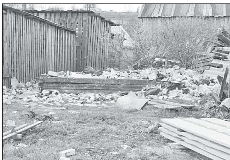
Люди ли тут живут? Один из дворов по улице Смидовича.

Пока подобная «модернизация» сделана лишь в двух многоквартирных домах, поскольку у коммунального предприя-