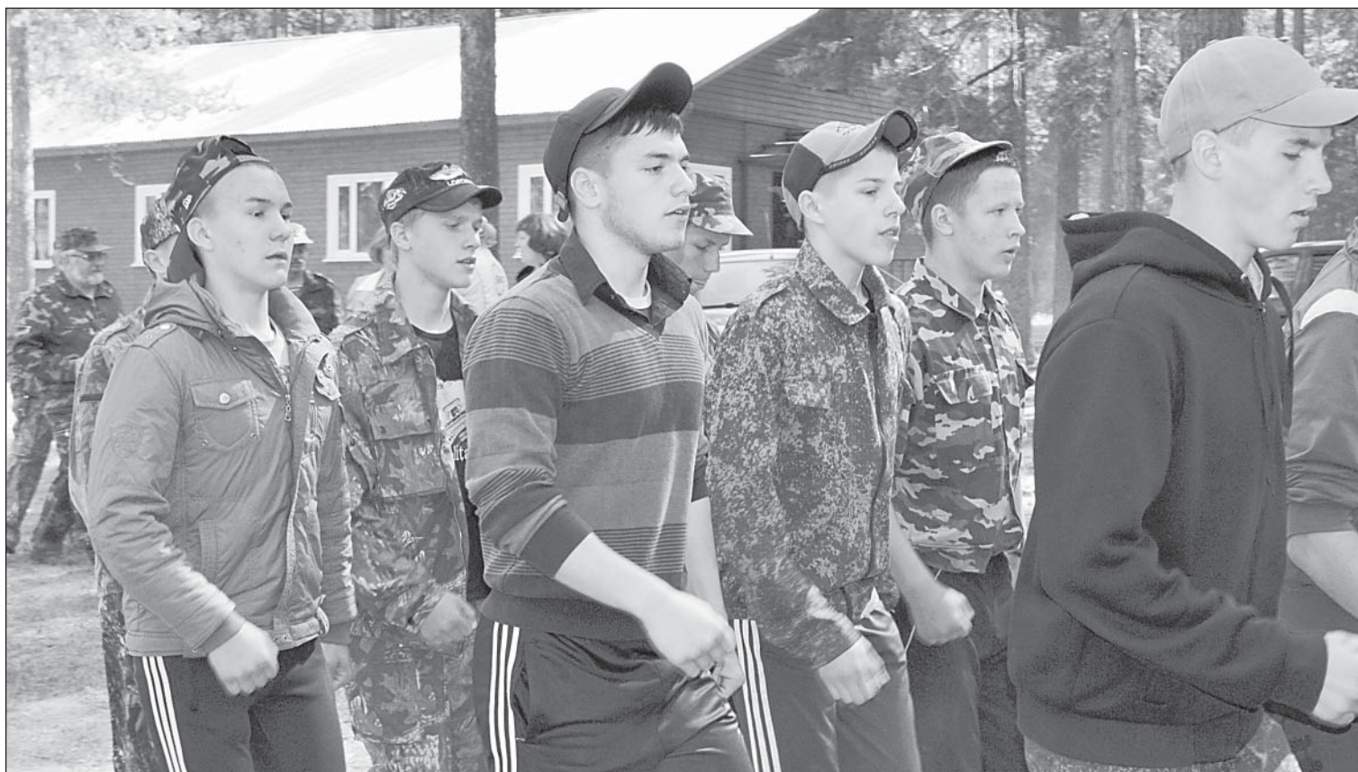
На общее построение — четким шагом!