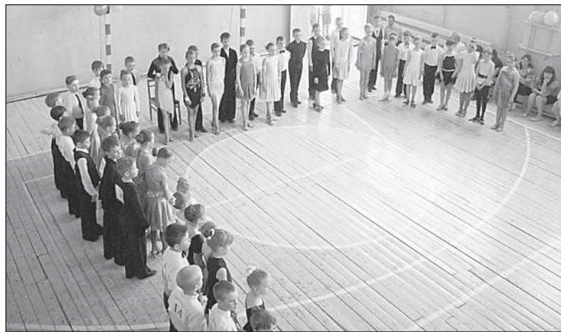
Парад награждения собрал вместе всех участников первой части соревнований.