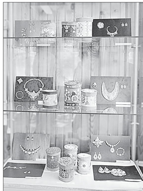
Макеты украшений и расписные туюсы.

школы рисования для взрослых «Вдохновение» относятся с таким же старанием, как и их младшие коллеги. Для выставки они подготовили новые интересные работы.