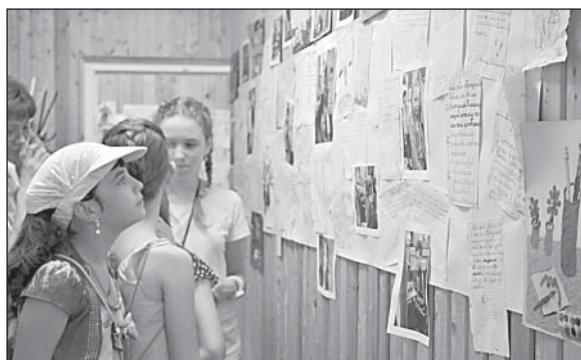
Заметки и фото о жизни отделения вызывают не меньший интерес, чем работы.

Настоящей изюминкой вернисажа, по мнению многих, кто присутствовал на открытии, стали работы по декоративно-прикладному искусству — макеты сказочных теремов, открытки, расписные туюски из картона, батик, а еще удивительные