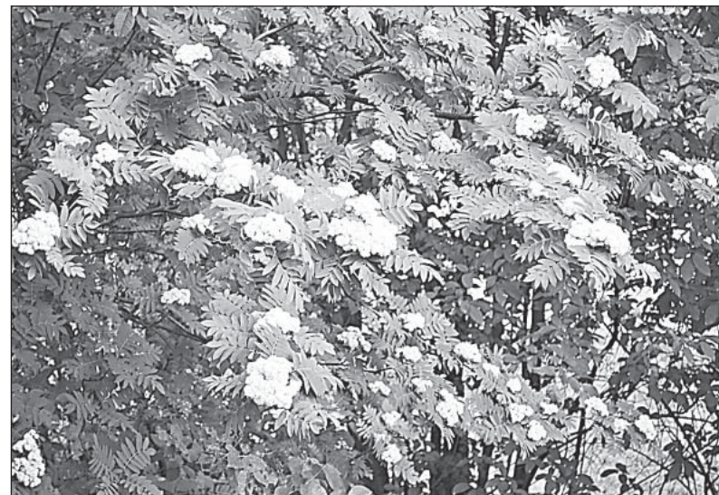
Рябина зацвела в конце мая, что случается нечасто.

Еще одна аномалия — устойчиво высокое атмосферное давление на протяжении длительного времени. В течение многих дней оно колебалось очень незначительно и составило в среднем 753 миллиметра ртутного столба.