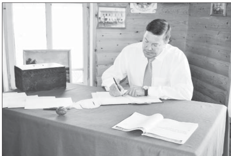
В книге отзывов ЦТНК теперь есть и мнение главы региона.

Представителю каждого района была дана возможность высказаться. Они рассказали о своей работе, какие вопросы и проблемы приходится решать, с какими заботами обращаются к ним люди.