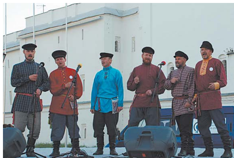
Выступление коллектива «Вагане» на Кремлевской площади.