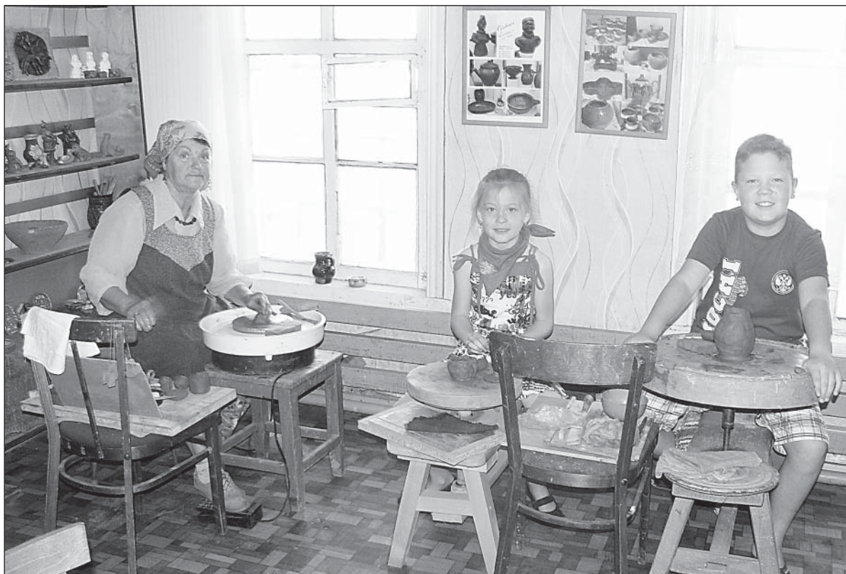
Дети с интересом изучают гончарное ремесло.