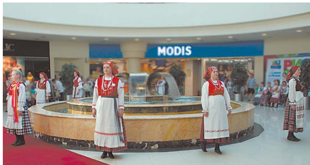
Дефиле в народных костюмах (ансамбль «Кукушечка»)