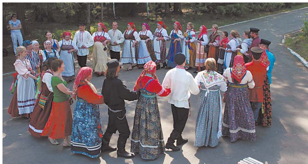
Разучивание хоровода «Ты заря, ты моя зоренькая» Новосибирской области.