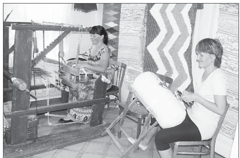
Кружевоплетение и ткачество осваивает молодежь.