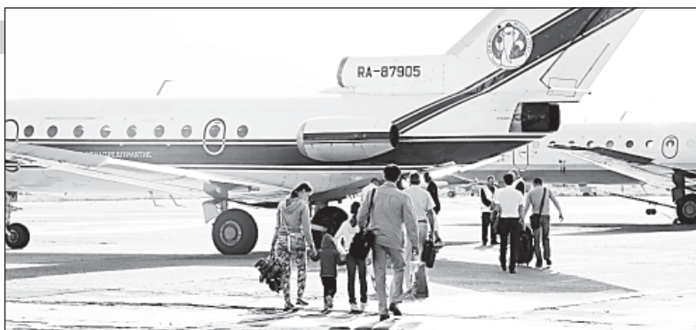
Первые пассажиры Як-40

Подписывая соглашение с городом о сотрудничестве и взаимодействии в развитии авиасообщения, нынешний врио Губернатора подчеркнул, что с просьбами о возобновлении полетов к нему неоднократно обращались жители и Почетные граждане