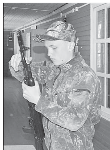
Сборка автомата Калашникова.

В связи с этим, помимо уроков ОБЖ и других обучающих практик, связанных с военной подготовкой, на территории Российской Федерации уже на протяжении нескольких лет для учащихся 10-х классов практикуются военно-полевые сборы. Традиционными они стали и для Верховажского района.