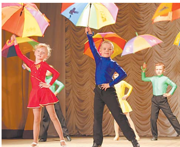
Танец «Капельки» исполняет новый состав — младшая группа коллектива (руководитель О.В. Курочкина).

Лучше всего о впечатлениях, которые зрители получили