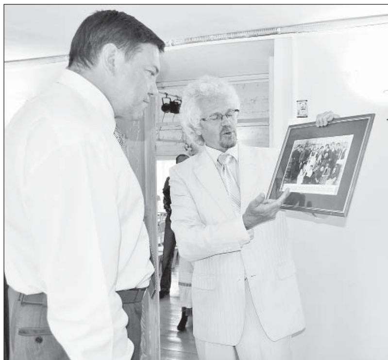
Сергей Истомин: «У верховажских купцов тоже был свой театр».