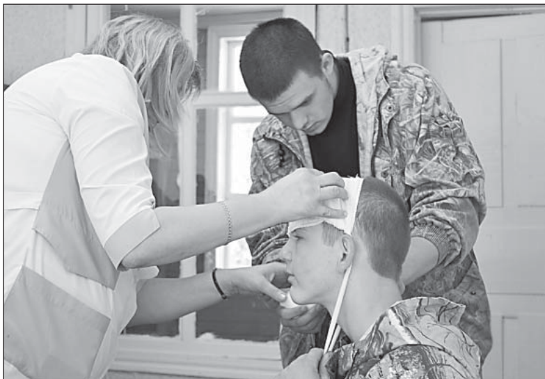
Ребята прошли курс медподготовки на практике.