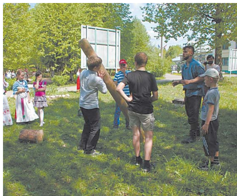
Дети получили возможность поучаствовать в мастер-классах.