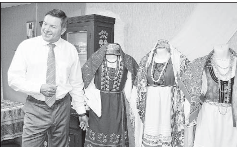
На выставке традиционных женских костюмов Поважья.