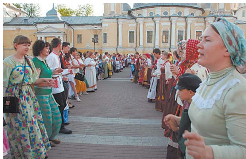
Гуляние по Кремлевской площади.

«Радоница» — лауреат I степени за сохранение и восстановление народных традиций родного края.