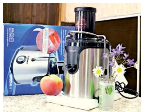
Приз летнего розыгрыша среди подписчиков – соковыжималка – уже ждет своего обладателя в редакции

Выписывайте «Верховажский вестник» – газету о вас и для вас!