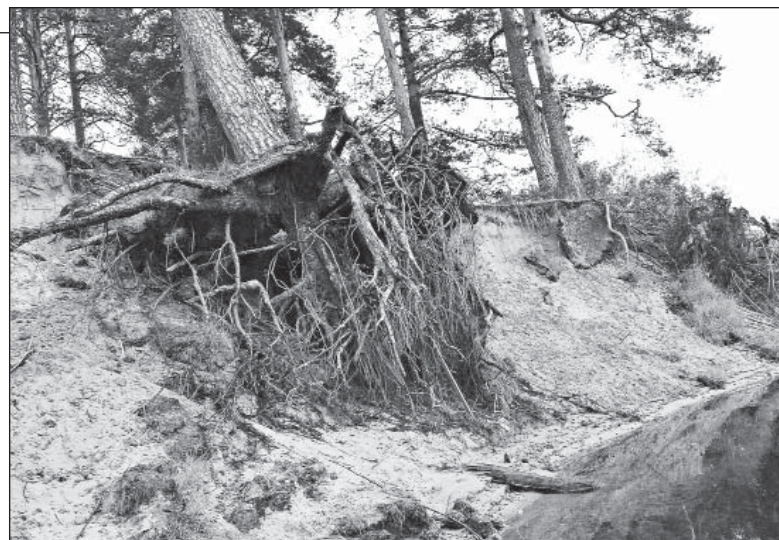
Прибрежные сосны Пестерёвской рощи обречены на гибель

– Да, Юрий, полностью с вами согласен по поводу того, что все очень серьезно. Одна сосна – мелочь. Беда в том, что обречены на гибель ещё несколько старых деревьев, находящихся практически на самом берегу Ваги. Не раньше, так позже вода подмоет обрыв, в который они из последних сил цепляются корнями, а