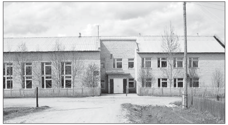
При хозяйском использовании бывшее здание Ногинской школы может еще долго служить людям

– Вы имеете в виду репрофилирование зданий будущими хозяевами для