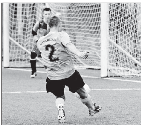
Опасный момент у ворот соперника