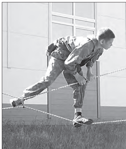
Переправа через «водную» преграду.