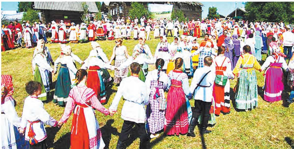
Общий хоровод перед началом проходки по деревне Пожарище.