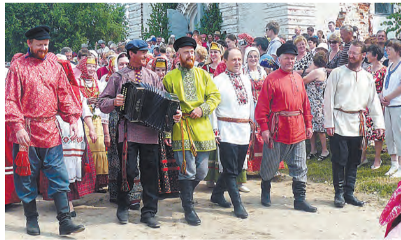
Проходка по деревне Макаровская.