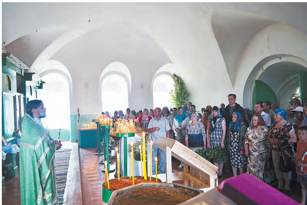
Праздник начался с Литургии в храме Пресвятой Троицы.