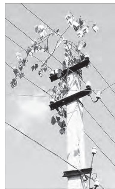
Порыв ветра забросил на линии электропередачи тополиную ветку.

Было достигнуто соглашение и по поводу уборки опа-