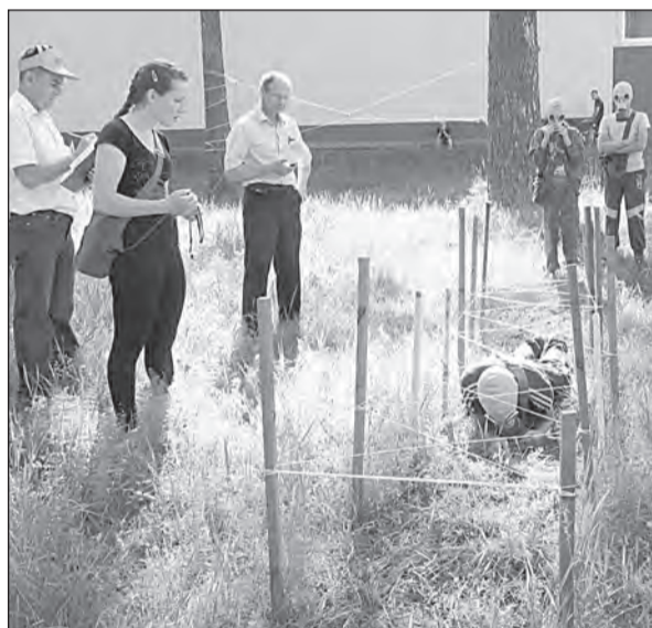
Преодоление «опасного» участка.