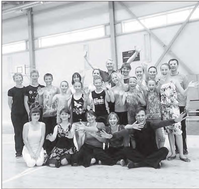
Участники первого дня семинара.