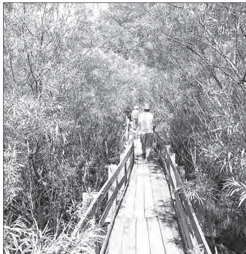
Ходить по мосткам стало опасно.

Но и это еще не все. Другой проблемой улицы Заозерной являются тополя. Четыре мощных, раскидистых дерева растут совсем рядом с жилым домом Gladковых. В опасной близости от них прохит и линия электропередачи. Электрики спилили часть мешающих ветвей, но недавно пронесшийся над Верховажьем предгрозовый шквалистый порыв ветра показал, что этого явно недостаточно. Сломанные стихией хрупкие тополиные ветки падали прямо на провода. Часть из них так и