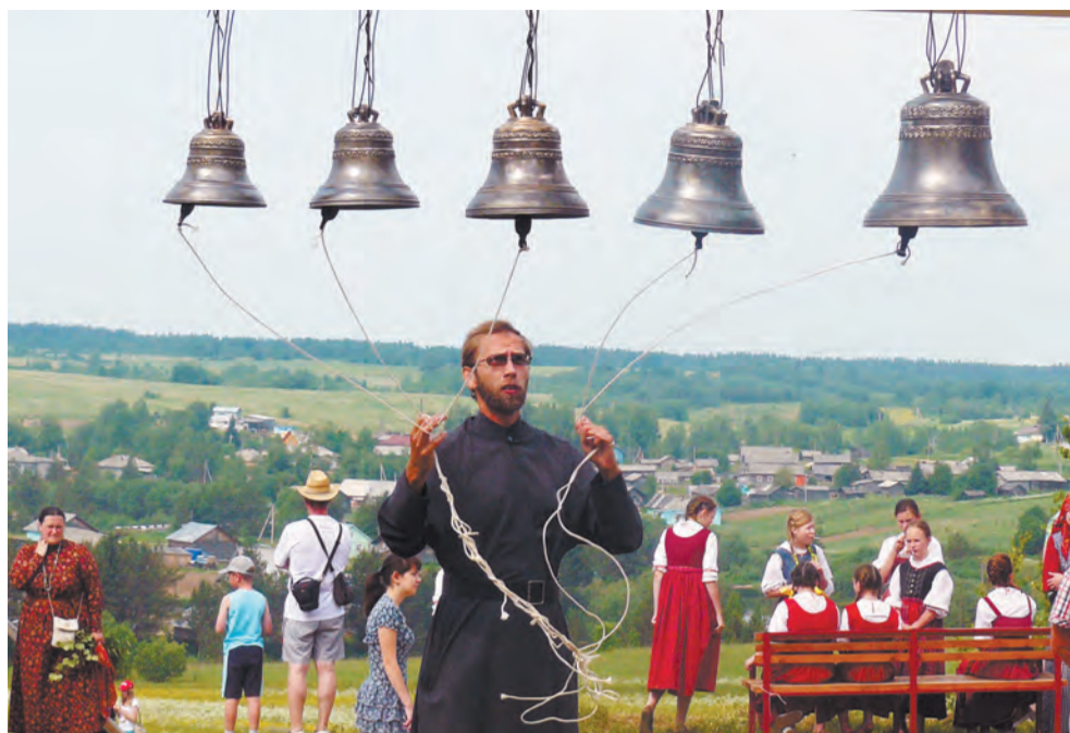
Колокольный звон разливался над Шелотами.