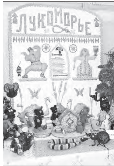
Экспозиция «Лукоморье» — работа В.А. Зайцевой из Терменьги.