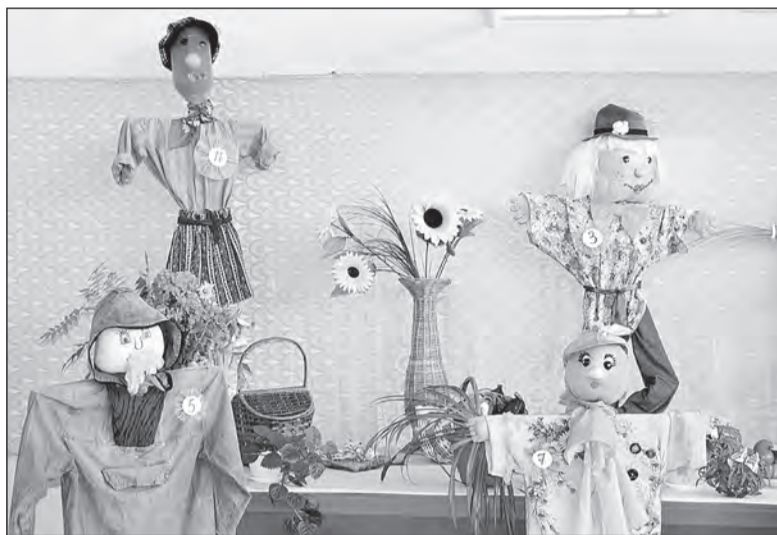
«Измюминка» выставки 2013 года — парад огородных пугал.

- В отделе хранятся журналы, начиная с 1980 года. Правда, тогда выставка называ-