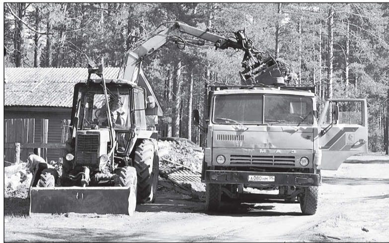
За день было вывезено 70 кубометров мусора и бытовых отходов.