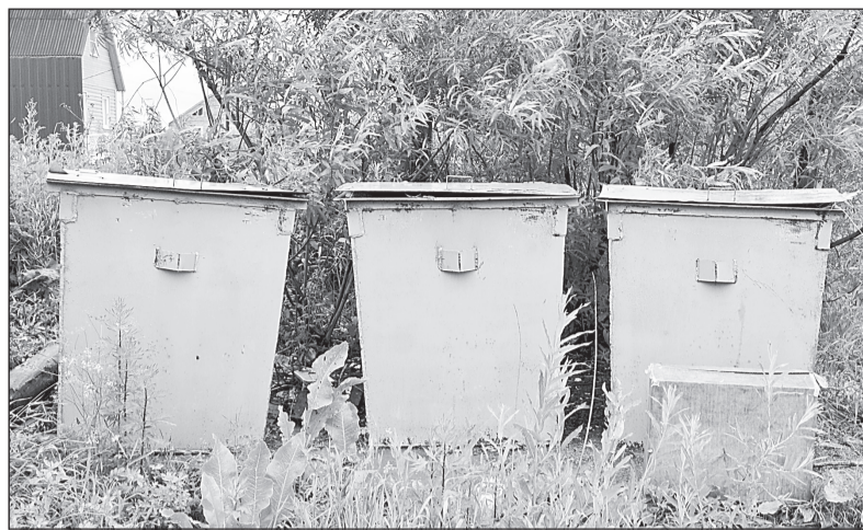
Такой контейнер при желании можно поставить и у частного дома.

Речь о специальных мешках для отходов с логотипом ООО «ВерховажьеСтройСервис». Поначалу они раскупались населением достаточно активно, но, видимо, за последнее время верховажане о такой возможности изба-