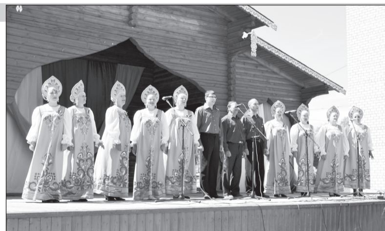
«Край мой Верховажский — родина моя» исполняет народный хор русской песни.