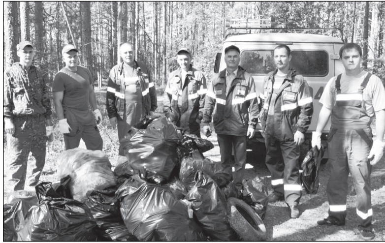
Активно вышли на уборку бора работники верховажской газовой службы.