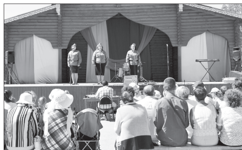
Ансамбль «Мелодия» из Чушевиц.