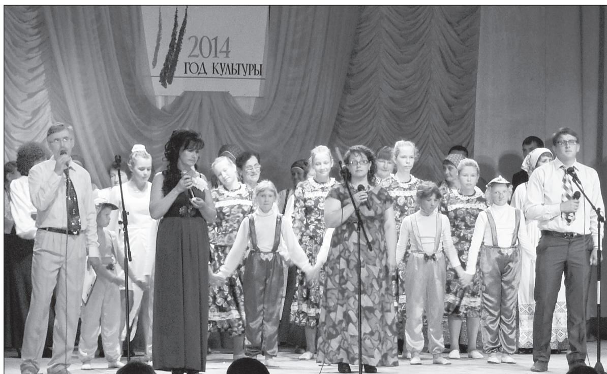
Концерт окончен, а аплодисменты в зале не утихают...