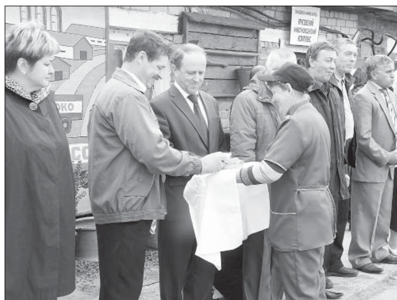
Гостей встречали по русской традиции — хлебом-солью.