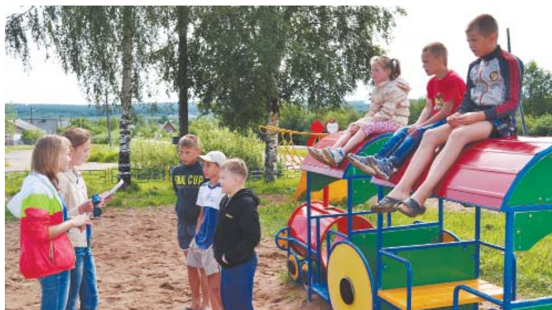
Викторина, посвященная Дню России (Наумиха)