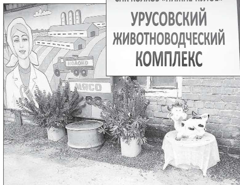
Так была оформлена территория около фермы Урусовской.