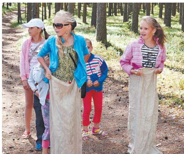
Испытание - прыжки в мешках (Т. Ручей)

возили ребят из Верховажья. Развлечения на каждый день придумывали Ольга Полежаева и Настя Самылова. На этой площадке пришлось корректировать время: к 10.00 утра никто не приходил, поэтому занятия начинались с 11.00. Кроме подвижных игр,