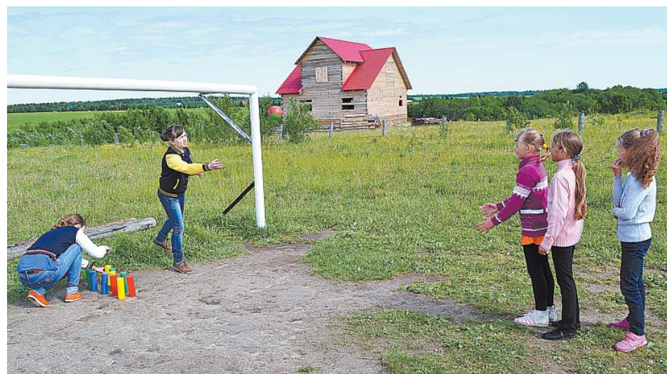
Игра в городки (Решетиха).