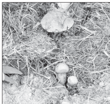
Удивление и радость вызвали красные грибы под березами.