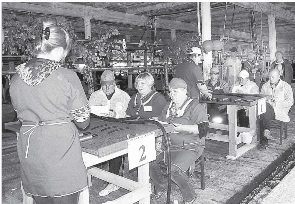
Идет очередной этап конкурса — сборка и разборка доильных аппаратов. Обратите внимание: помещение украшено ветками березы.