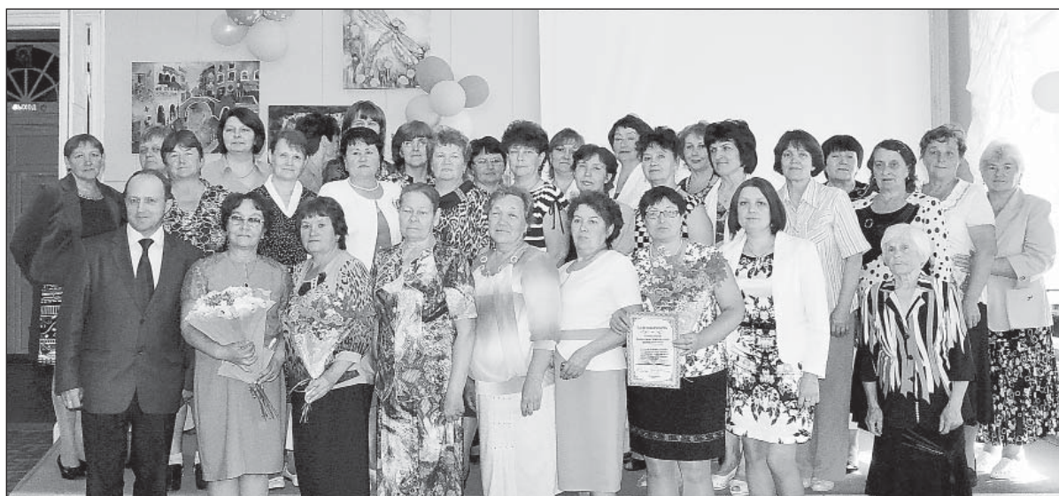
35-летний юбилей ЦБС собрал почти всех библиотекарей нашего района.