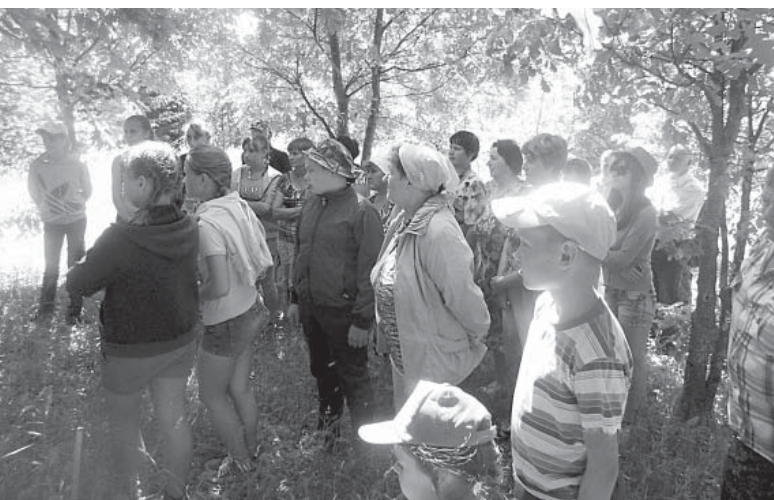
Экскурсия по дендрарию.

парке каждое деревце, каждый кустик, провела интересную экскурсию, познакомила с видами деревьев и кустарников, растущих здесь. Рассказала, что бы нам хотелось восстановить в парке: смотровую вышку, пруд с рыбками, пещеру Кощей Бессмертного, отремонтировать все мостки, ведущие к строениям. Гости встретились со сказочными героями, поселившимися здесь, в Чуглах.