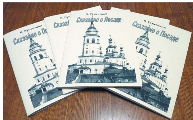
На титульном листе книжки — изображение Успенского собора.

- Сделать жизнеописание районного центра - очень трудная задача, - признается автор. - Память людей недолговечна, источники крайне скудны, малочисленны и противоречивы. О том, как уда-