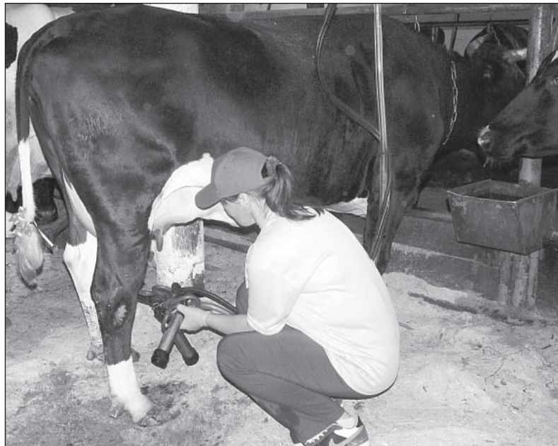
Подготовка коровы к доению. На хвосте каждой буренки, участницы конкурса, бант.

Скоро зрители услышали музыку, на сцену вышли