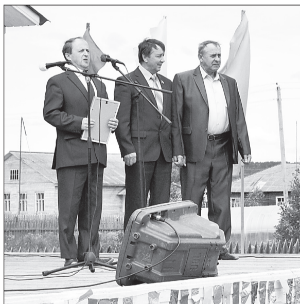
Приветственный адрес от главы района.