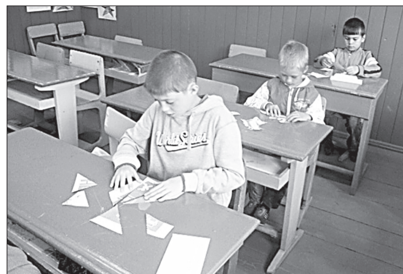
Ребята собирают из пазлов дорожный знак.

Ребята разделились на пять команд по четыре человека в каждой. Состязания проходили в два этапа. Теоретический включал в себя пять «станций»: нужно было решить кроссворд, отгадать загадки, разгадать ребусы по правилам дорожного движения, дорисовать дорожный