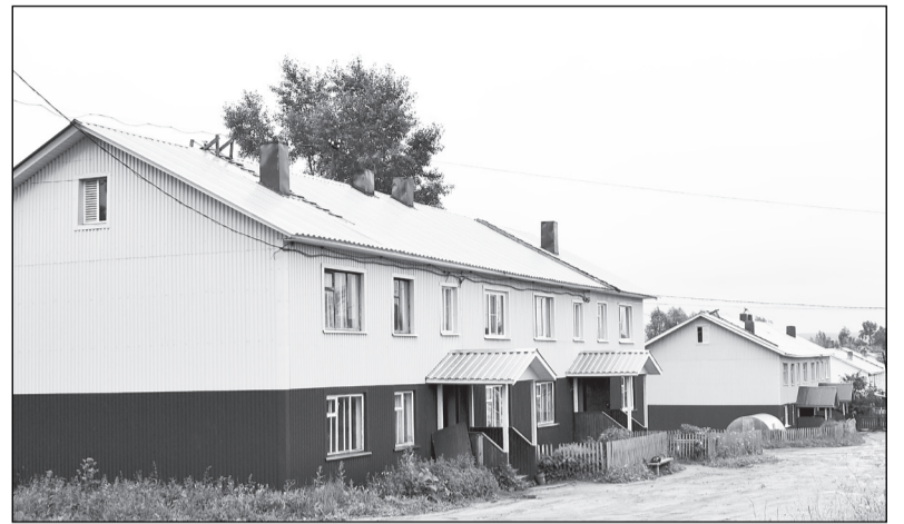
Эти двухэтажные дома отремонтированы по федеральной программе капремонтов в 2012 году. В настоящее время она не действует.

Проект редакции при поддержке Управления информационной политики правительства Вологодской области