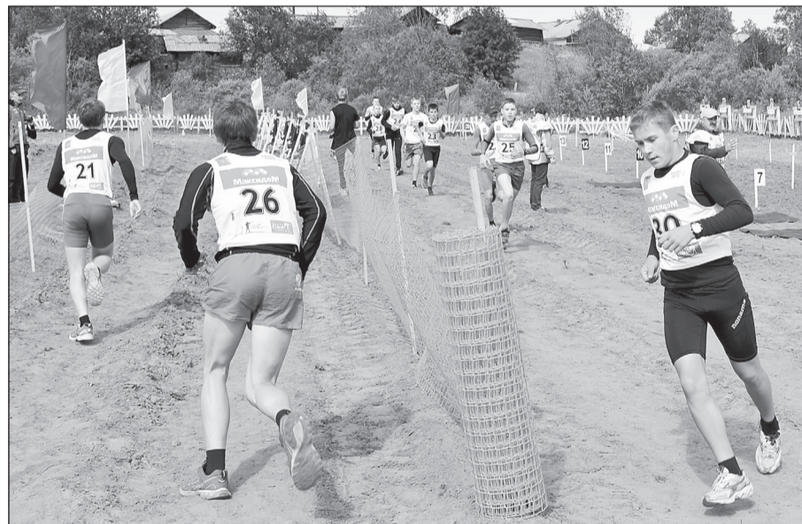
Накал борьбы в летнем биатлоне был нешуточный.