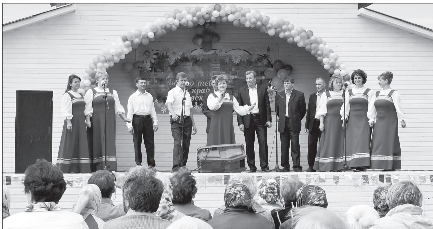
Праздник открыли верховские самодеятельные артисты.