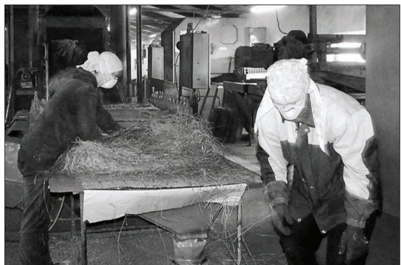
Работу в цехе льнозавода «непыльной» не назовешь