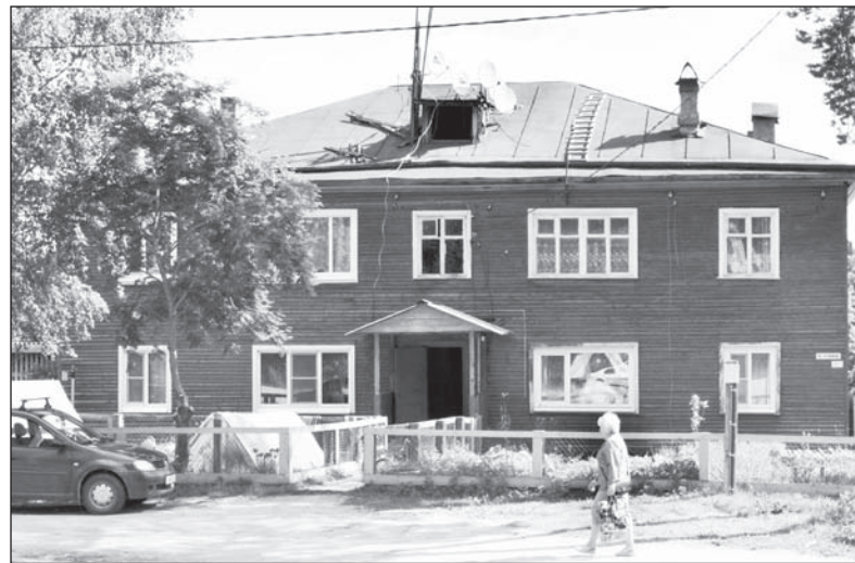
Этот дом по улице Гагарина капитально отремонтируют одним из первых

Хотя, конечно, самым весомым аргументом в пользу фонда капремонта и регионального оператора для людей будут уже отремонтированные объекты. По самым свежим данным, в области завершена реконструкция 11-ти многоквартирных домов в Вашкинском, Великоустюгском, Кадуиском, Кирилловском районах, в Вологде и поселке Майский Вологодского района. В ближайшее время будут приняты еще четыре дома в Грязовецком и Великоустюгском районах. Работы по капремонту ведутся на 31 многоквартирном доме в Белозерском, Грязовецком, Бабаевском и Вашкинском районах. Здесь будут отремонтированы крыши, системы водоотведения и водоснабжения, установлены общедомо-