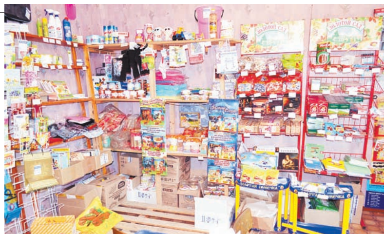
На почте можно не только отправить письмо, но и купить товары первой необходимости