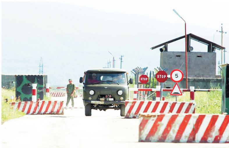
На контрольно-пропускном пункте

И пока там стреляют, гремят взрывы, наши ребята будут достойно выполнять поставленные перед ними задачи.