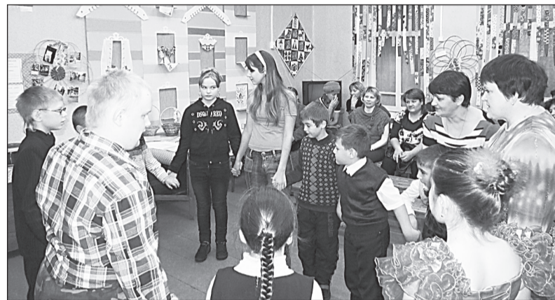
На детском празднике в верховском Доме творчества.