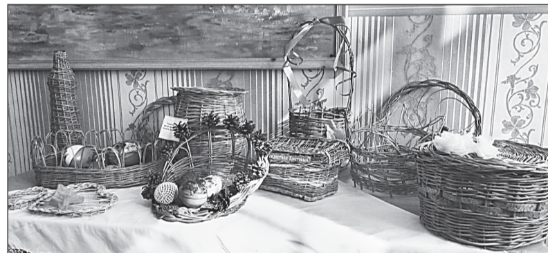
Выставка работ из ивового прута.

с районной библиотекой проводились мероприятия по творчеству поэтов, писателей — наших земляков.