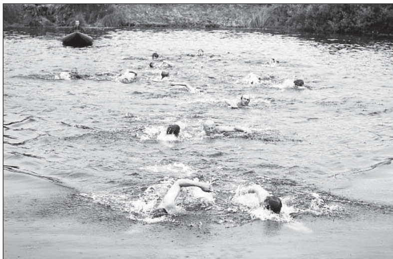
Лидеры определились уже в заплыве