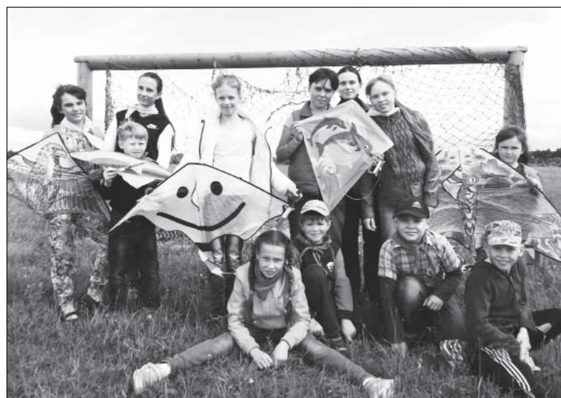
Воздушные змеи готовы к запуску.

ке по очистке берега Ваги. День индейцев, Минута славы, игра «Форд-Боярд», День Нептуна, бенефис Бабы-Яги, конкурс рисунков, дискотека, день самоуправления и множество других мероприятий сделали детский отдых незабываемым.