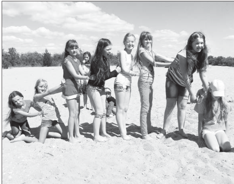
На пляже всегда было весело.

О самых ярких из них рассказывала стенгазета, которую каждую неделю выпускали сами ребята: о том, как они все вместе веселились на пляже, играли в подвижные игры и в мяч, как запускали воздушных змеев у реки в Пестерёвской роще, как участвовали в субботни-