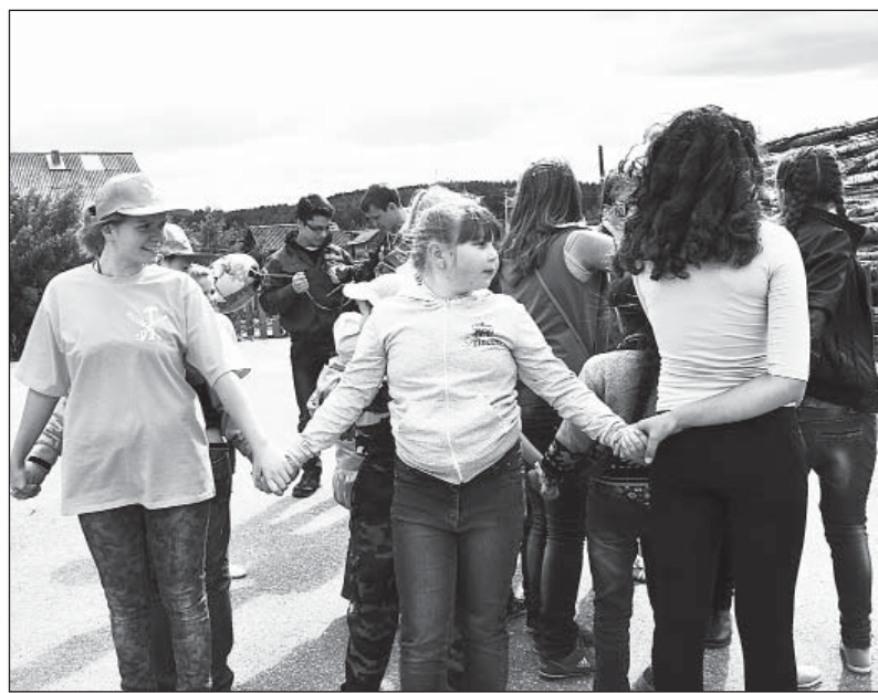
Студентки ВГМХА провели для детей игровую программу.