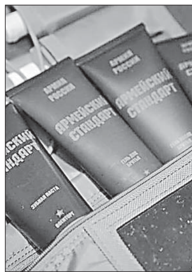
Все призывники в этом году получают специальный армейский несессер с предметами гигиены на год.

- В свое время немало верховажан становились кадровыми офицерами армии и флота, дослужились до высоких званий. Поступают ли сейчас наши земляки в военные училища? Если да, то в какие?