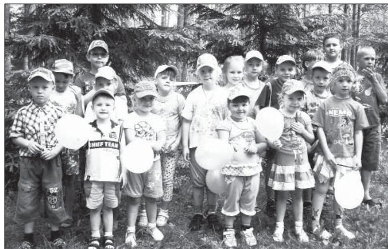
Участники конкурсной программы, Терменгская библиотека.