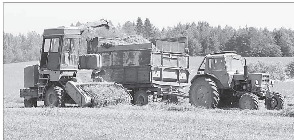
На погрузке зеленой массы.