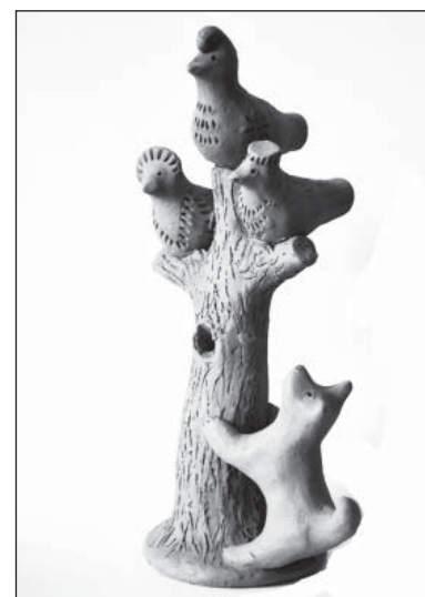
«Поющее дерево», 2014 г. (Е. Пан).