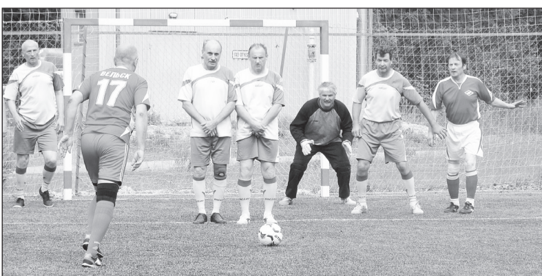
Момент игры между командами Вельска и Череповца

Встретившись на поле боя с каждой сборной, в лидеры