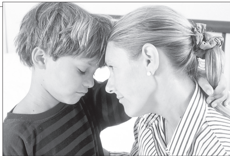
«Прости, мамочка, я больше так не буду»

Когда родители дома запрещают детям играть на компьютере, не организуют других занятий, привлекательными становятся заманчивые при-