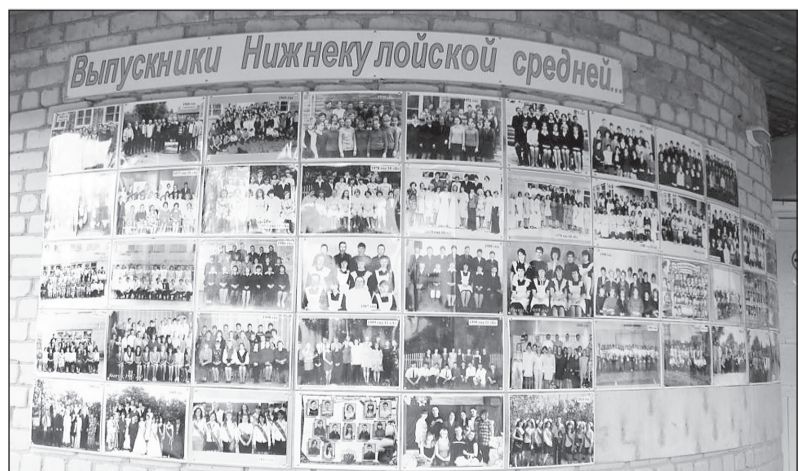
Фотографии выпускников Н-Кулойской средней школы