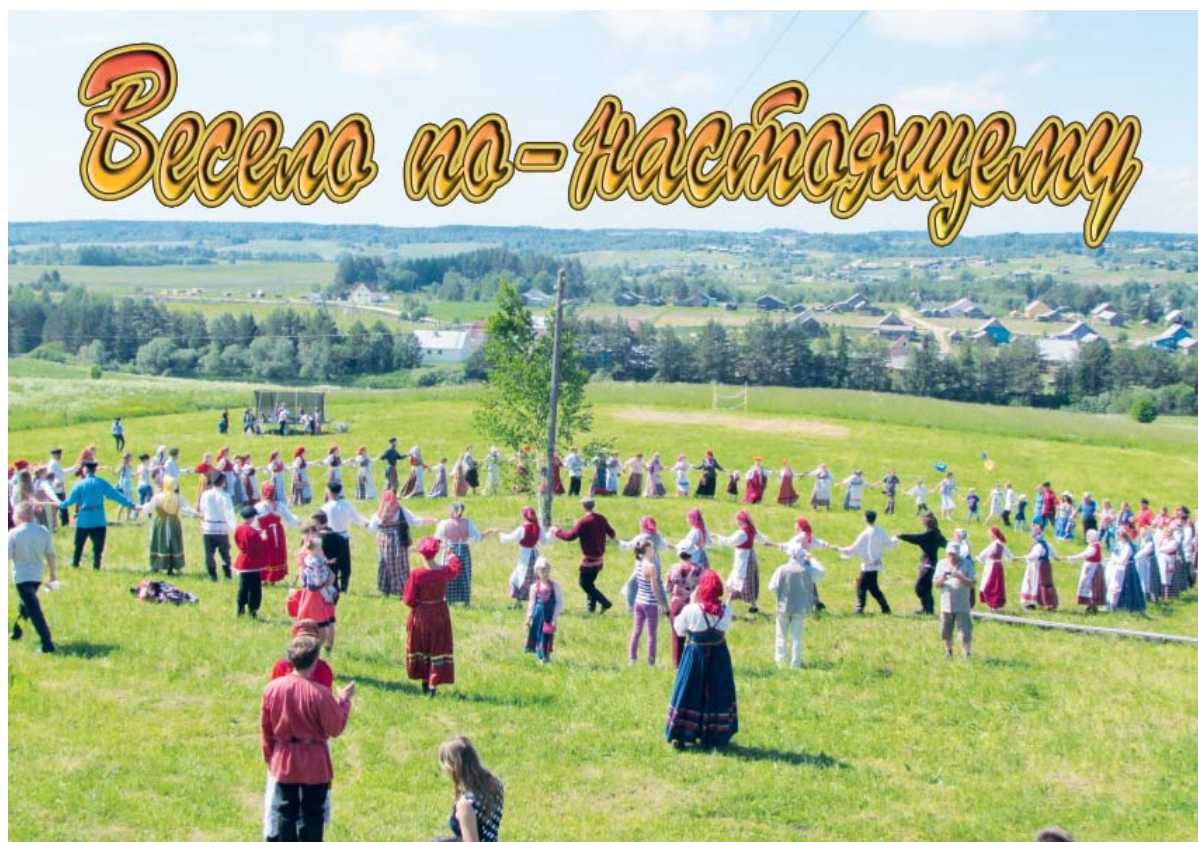
Уж мы по лугу...

трапеза с молитвой и благословением. На столах - окрошка, картошечка, капуста, свежесолёные огурчики, пироги и домашнее пиво. Все так же, как и в старину.