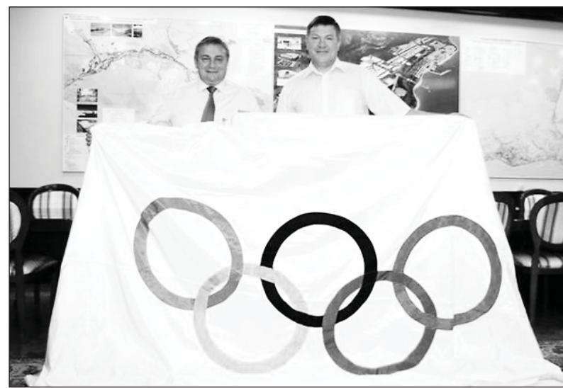
Опубликовано в соответствии с договором на освещение деятельности Губернатора и органов государственной власти Вологодской области.