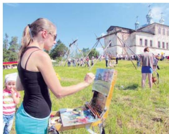
За вдохновением - в Шелота