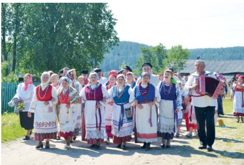
Заиграла гармошка в деревне...

Вернуться на один день в прошлое и погулять на празднике в лучших русских традициях могли в день Святой Троицы жители и гости Шелот.