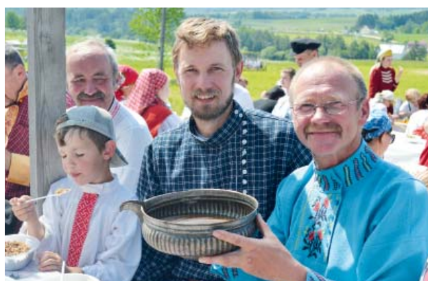
Из братины пиво вкуснее. «Подходите, угощай!»