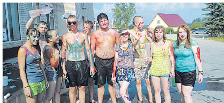
Результаты совместного «творчества».