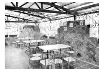
Новое летнее кафе