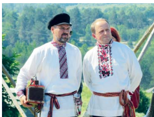
«Вот это праздник...»