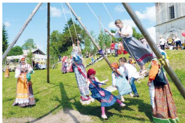
В восторге и дети, и взрослые