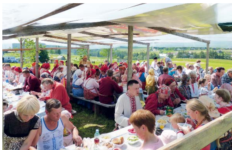
За праздничной трапезой