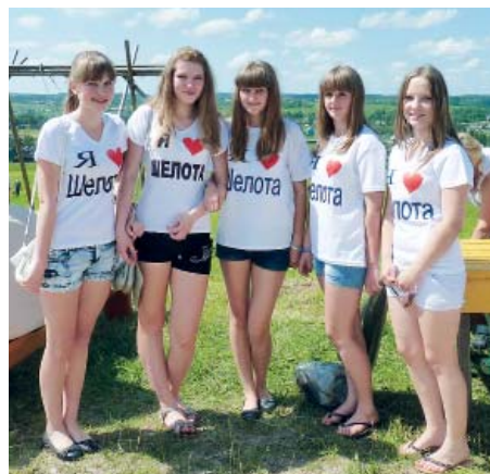
Шелотские девушки - самые патриотичные