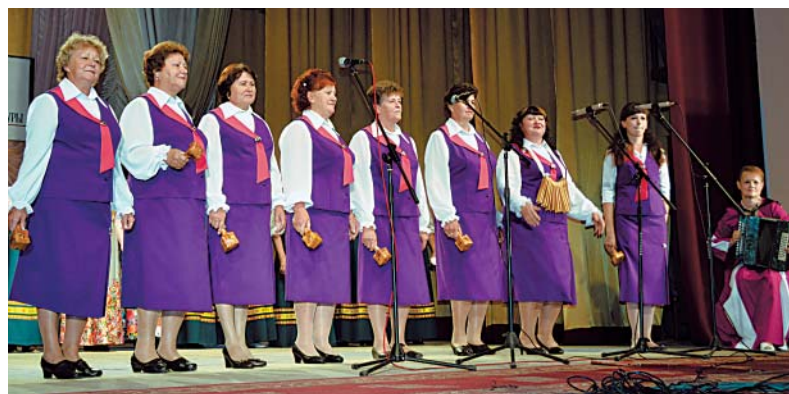
Выступление ансамбля из Терменги.