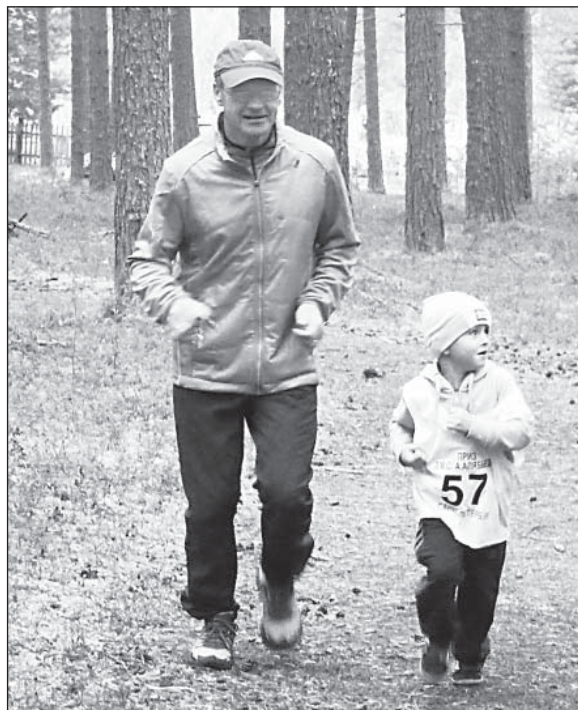
Бег на свежем воздухе полезен многим.

Для здоровья важна систематичность занятий. Значит, писать надо и о пользе обычной физкультуры, утренних пробежек, пешей ходьбы, осо-