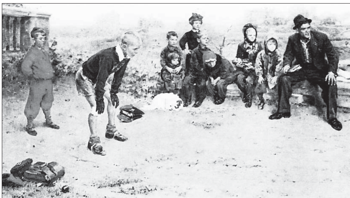
Знаменитая картина С. Григорьева «Вратарь» хорошо передает атмосферу середины прошлого века, когда футболом были увлечены все от мала до велика.

Естественно, пройти этот опасный путь решались далеко не все. Счастливики, преодолевшие свой страх, показавшие свою удачу и сноровку, получали дополнительные бонусы к своей детской биографии.