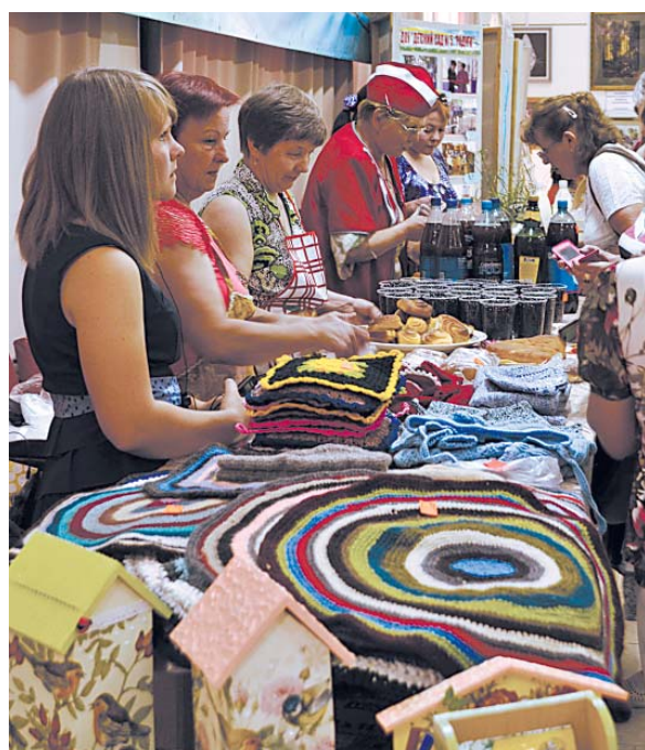
Товары мастеров из Наумовского поселения.