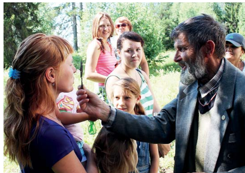
Желающих приложиться к маленькому кресту было много.