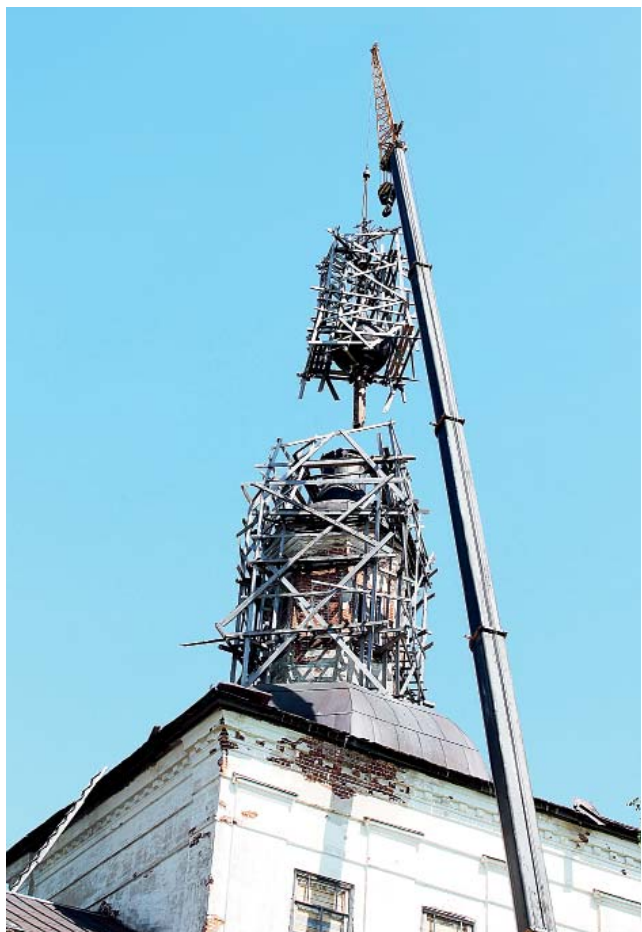
Купол с крестом отделили от светового барабана только со второго раза.