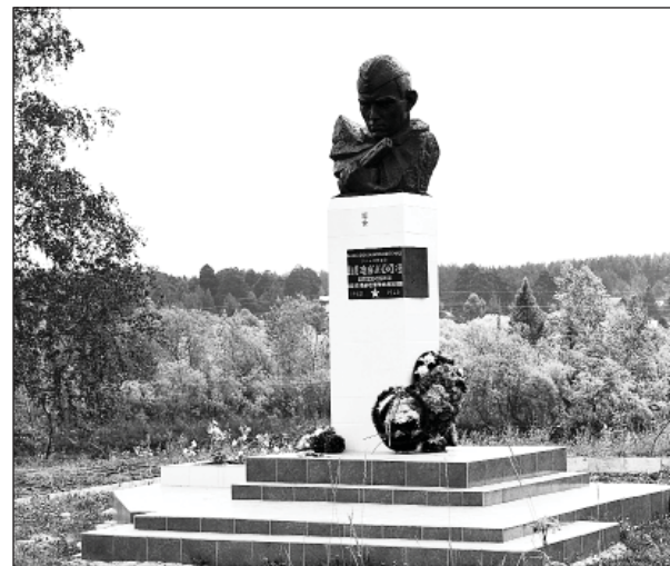
Так памятник выглядит сейчас

газопровод проходит по правой стороне улицы Гагарина. То есть, для газификации домов, находящихся на левой стороне, придется перекапывать проезжую часть. После ремонта перекапывать улицу никто не даст, придется делать «прокол». А это гораздо дороже. Поэтому лучше оформить все документы сейчас, пока ремонтные работы на дороге еще не начались.