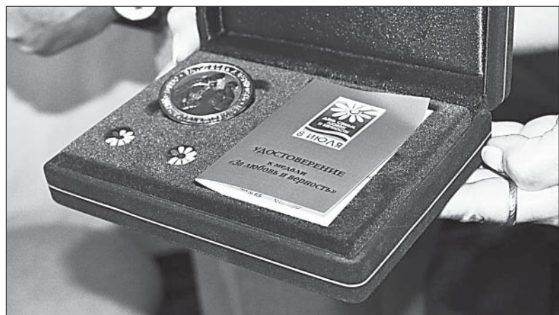
Медаль, как и жизнь, — одна на двоих.