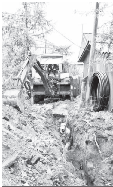
Дома по улице Стебенева были подключены к центральному водопроводу в 2013 году

Понятно, что население в первую очередь интересуется ожида-