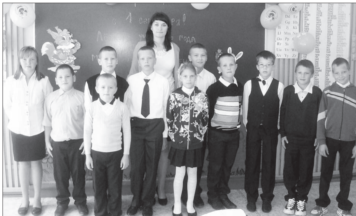
Пятиклассники первыми начали осваивать ФГОС