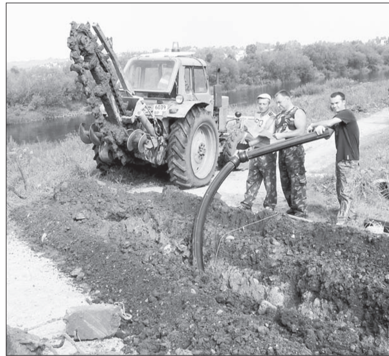
2014 год. Прокладка газопровода. Нынче эти работы начнутся после аукциона по выбору подрядной организации. Скорее всего, в августе