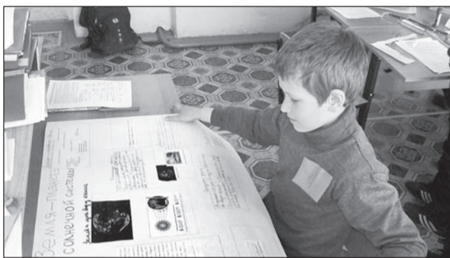
Проектная деятельность — одно из направлений новых Стандартов

Современная жизнь предъявляет к человеку жесткие требования – высокое качество образования, коммуникабельность, целеустремленность, креативность, качества лидера, а самое главное – умение ориентироваться в большом потоке информации. Новые федеральные государственные образовательные стандарты (ФГОС) все настойчивее входят в современную школу, где учителя, учащиеся, родители – непосредственные участники важных для жизни общества изменений.