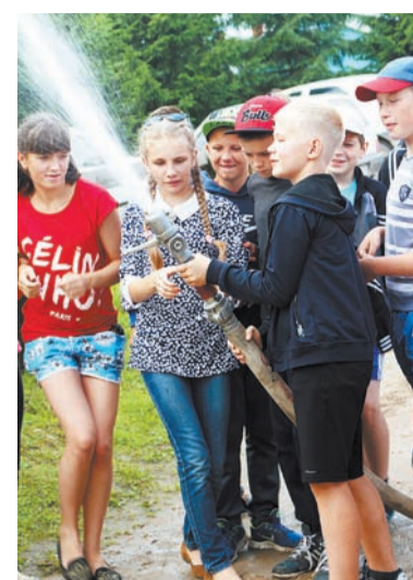
На экскурсии в пожарной части

струкции одного из корпусов в распоряжении самых младших отрядов — горячая вода, душевые кабинки, теплый туалет и просторные комнаты на три-четыре человека.