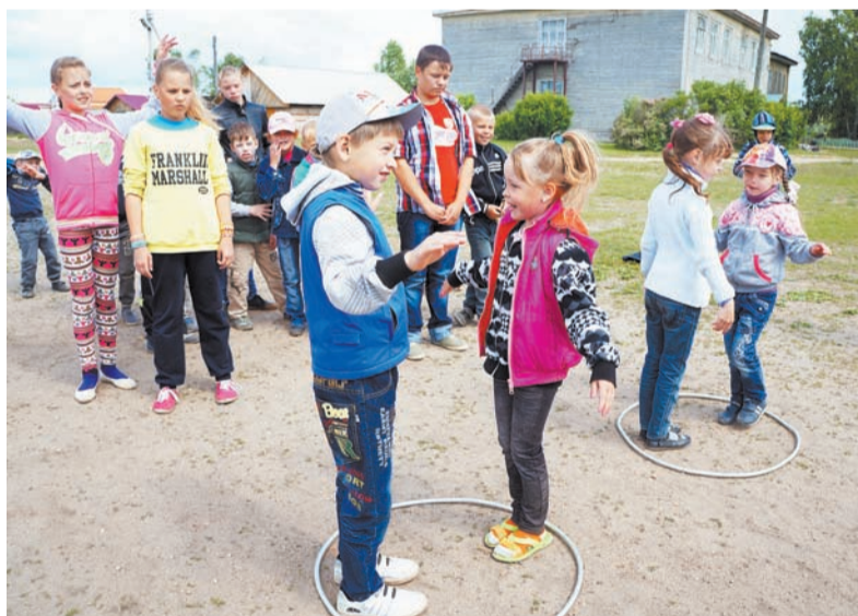
Эстафетные игры нравятся всем