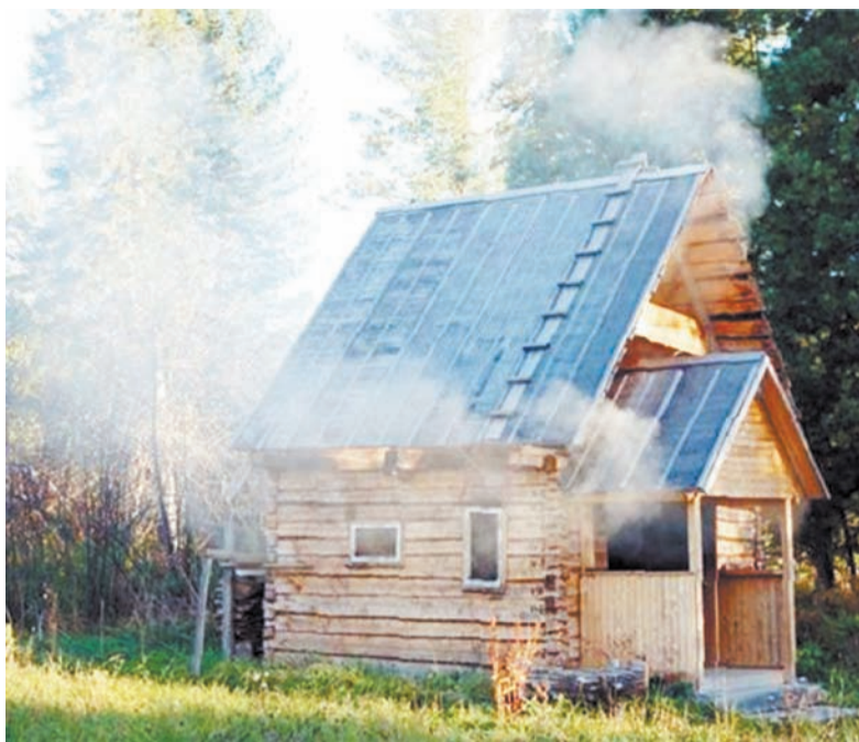
«Топится, топится в огороде банька...»

В наших местах, как в XX, так и в XXI веке, банные веники заготавливаются в разные периоды. В каждой деревне существуют свои приметы, сроки и правила. Одни их «ломают» в конце июня. Другие – после Иванова дня (7 июля). Заканчивают заготовку, как правило, через неделю после Петрова дня. Он приходится на 12 июля ежегодно. Все зависит от пого-