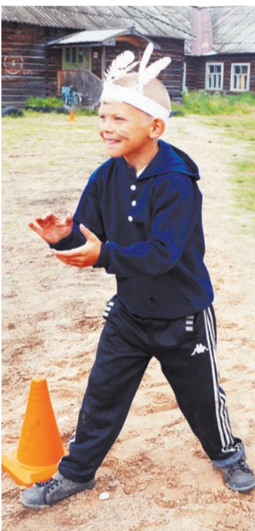
«Зоркий глаз» на старте

Перед Днем деревни всем лагерным коллективом провели экологический десант под