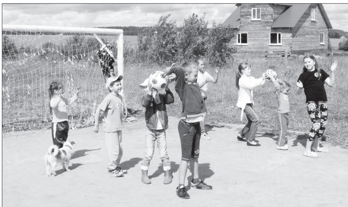
В эстафете победила команда девчонок