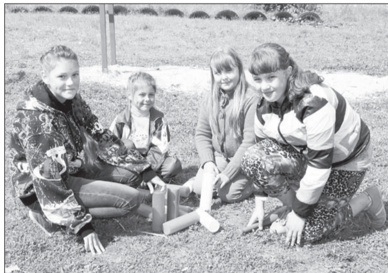
Игра в городки у ребят - одна из самых популярных