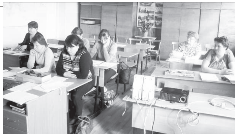
Родители должны тоже постигать азы ФГОС

Рабочая группа, созданная в школе, разработала основную образовательную программу основного общего образования и Положения, касающиеся