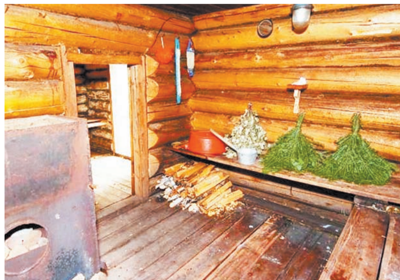
В деревенской бане

Но банные процедуры требуют специальной подготовки и выполнения определенных правил, а также консультации врача, если у вас есть какие-то хронические заболевания. И, конечно, желания очистить не только тело, но и душу. Только тогда вы поймете смысл поговорки – «Баня – мать вторая» .