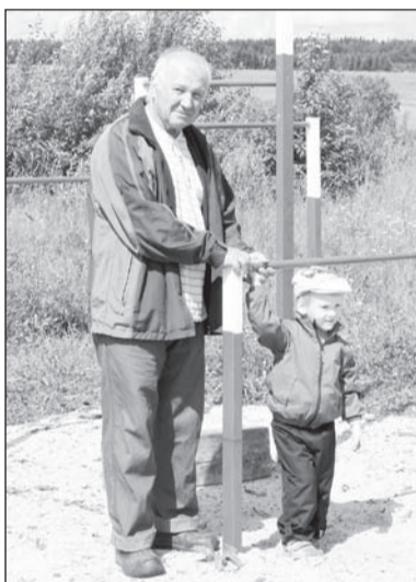
Дачники из Ухты - частые гости на игровой площадке