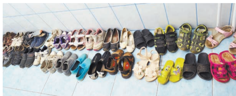
У малышей в третьем отряде — тихий час

Две недели, как для ребят, так и для воспитателей, пролетели быстро. Но наверняка время, проведенное вместе, останется в их памяти надолго.