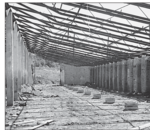
Ферма «Вага» будет восстановлена к зиме.