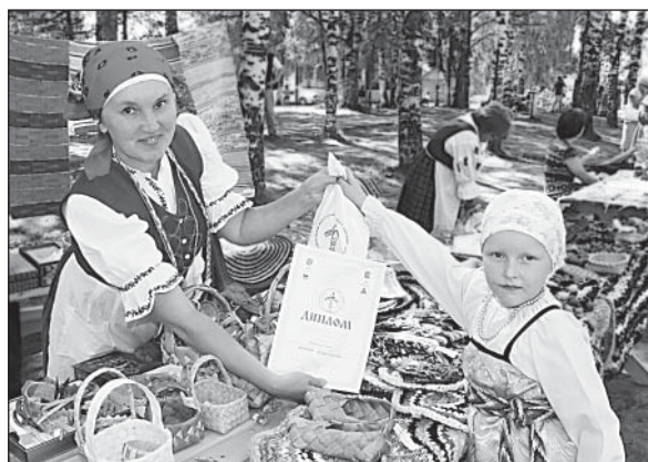
За участие в празднике каждый мастер получил диплом и сувенир на память.

Верховажане приняли активное участие в празднике. Два фольклорных коллектива, «Вагане» и «Кукушечка», а также народные мастера Центра традиционной народной культуры достойно представили наш район. Погожий солнечный денек, прекрасная северная природа, разноцветье костюмов участников праздника, общие хороводы, песни и пляски, широкая ярмарка — всё это перенесло множество жителей и гостей Тарногского района в далёкое прошлое. Вечером за круглым столом состоялось подведение итогов фестивальных дней и награждение.