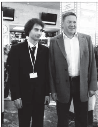
В Ленкоме с одним из организаторов VOICES.