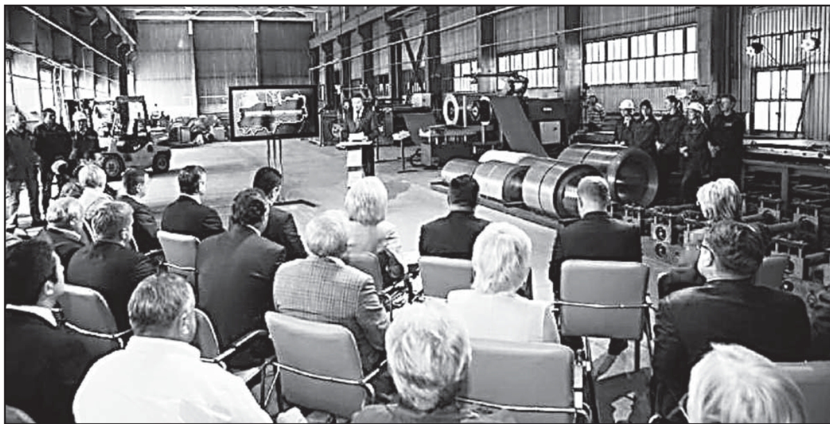
Выступление врио Губернатора на Вологодском заводе строительных конструкций и дорожных машин.

Говоря о комфортной среде обитания человека, мы не можем не говорить об экологической составляющей.