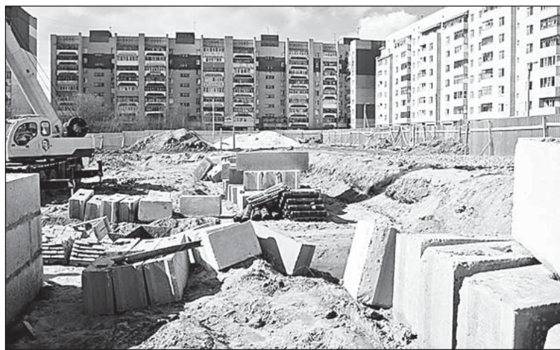
Стройка на ул. Фрязиновской (г. Вологда) - в конце 2014 года там появится новый детсад.