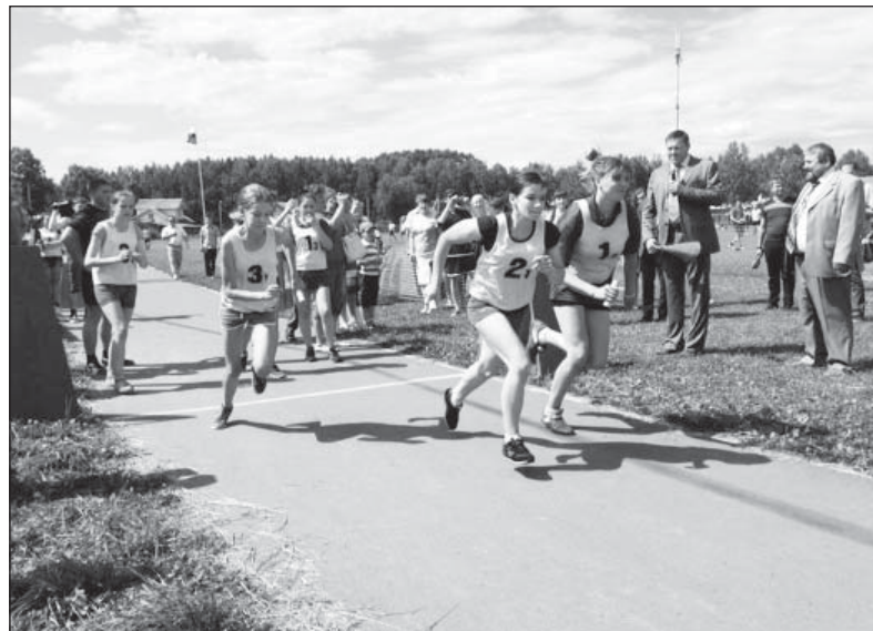
Эстафета, село Кичменгский Городок, июль 2014 года.

Мы будем использовать наши конкурентные преимущества как промышленно развитого региона (40% промышленности в ВРП). Ведь даже по итогам 2013 года, не самого успешно-