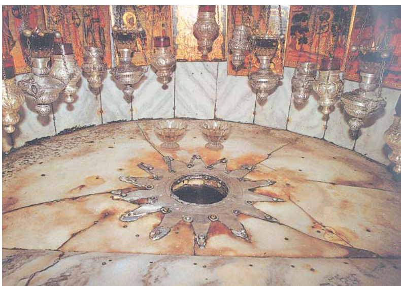
Серебряная звезда в Пещере на месте рождения Иисуса Христа (храм Рождества Христова в г. Вифлееме)