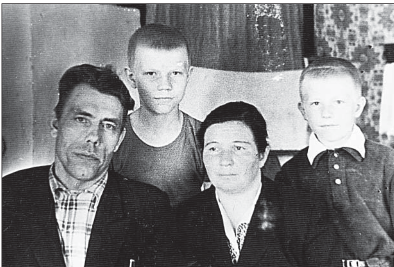
«Эта фотография сделана в квартире своего дома. Дер. Слудная, Олюшино».