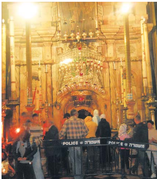
Кувуклия - часовня внутри храма Гроба Господня