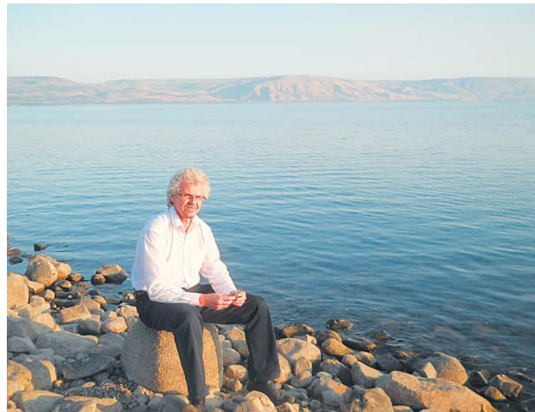
Автор на берегу Генисаретского озера