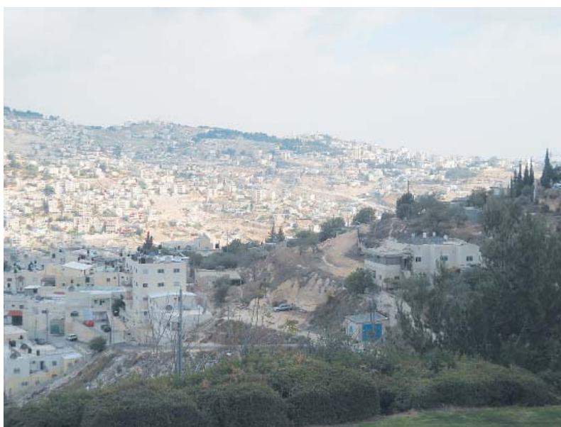
Панорама Святого Города Иерусалима