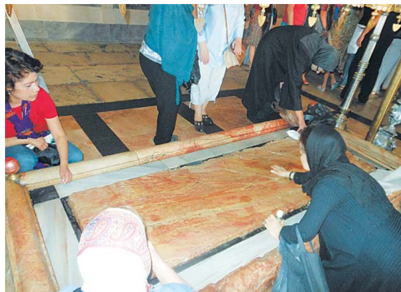
Камень Помазания в храме Гроба Господня