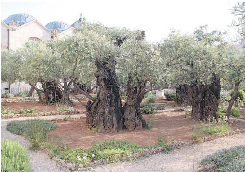
Оливковые деревья в Гефсиманском саду