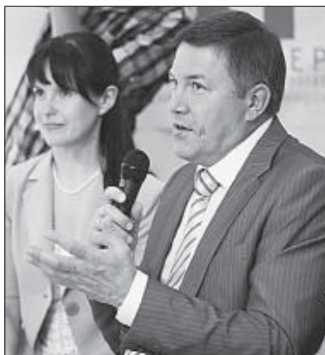
Так выглядит «Активация» творческого объединения «АВО!» в Вологде. Олег Кувшинников отметил, что такие проекты требуют минимальных финансовых вливаний.