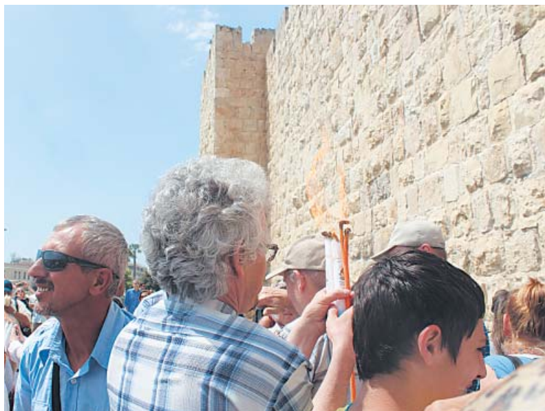
Встреча Благодатного Огня