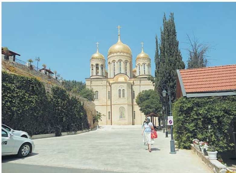
Храм Всех Святых в русском Горнем монастыре в Иерусалиме