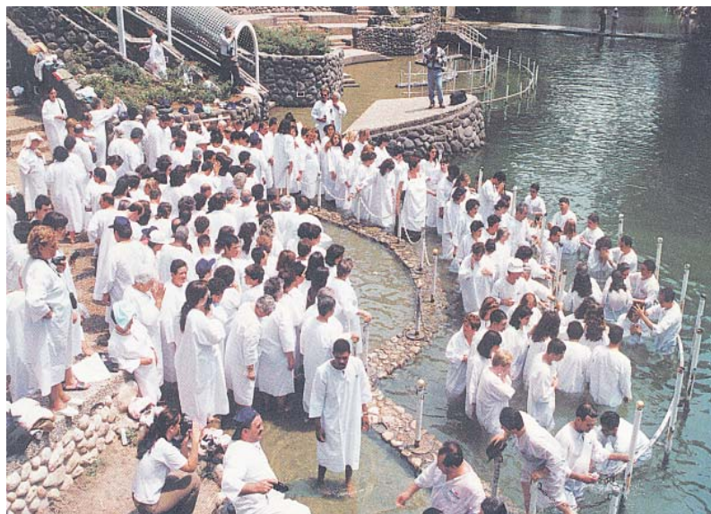
Паломники на Святой реке Иордан