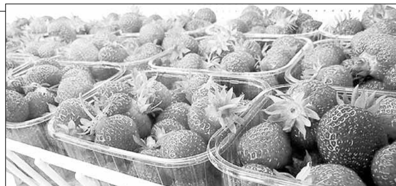
В этом году урожай клубники в Финляндии составил 14-15 миллионов килограммов

Разместившись в гостинице, мы отправились на выставку, где была представлена техника, и не