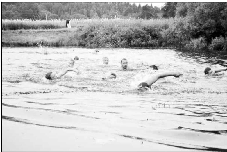
Заплыв на 80 м – первый этап соревнований