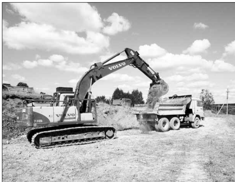
Погрузка гравия в карьере