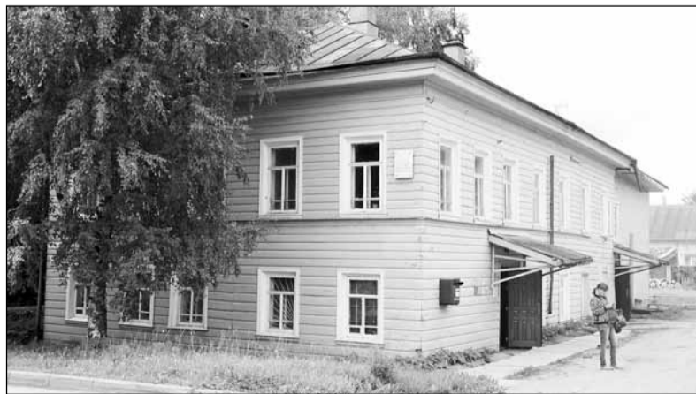
Здание почты в Верховажье – запланированная на 2015 год реконструкция отложена на неопределенный срок

Не осталась в долгу и редакция районной газеты. Мы считаем почтовых работников своими главными партнерами в пространстве «Верховажского вестника». В непростых условиях повышения цен на доставку периодики нам совместными усилиями удалось сохранить тираж на второе полугодие 2015 года на уровне трех тысяч экземпляров. Половина почтовых отделений (11 из