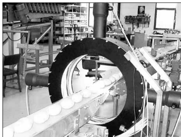
Цех по переработке картофеля