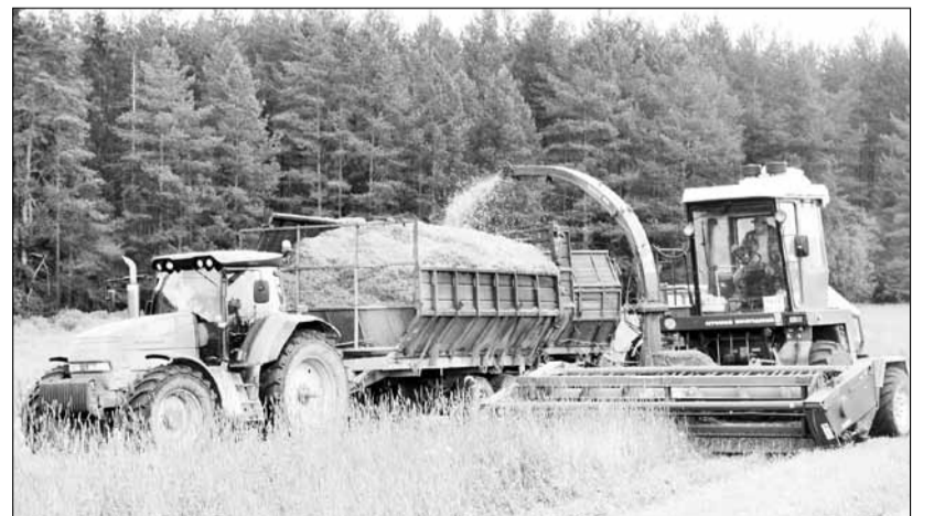
На погрузке зелёной массы в «Новом поле»

Силосование кулояне начали 11 июня. По состоянию на минувшую пятницу было заложено пять ям и одна прямо на поле. Мы побывали в колхозе 17 июля. В этот день силосная бригада трудилась на колгоспных полях, закладывала траншею возле телятника.