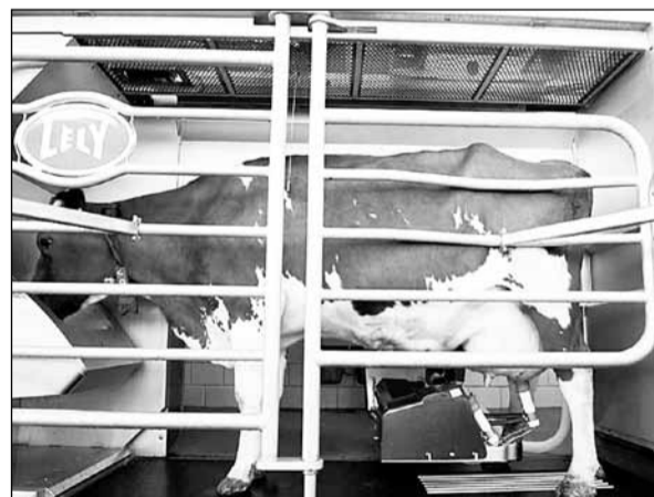
Доильный робот в действии