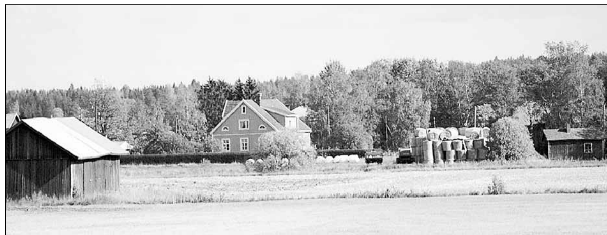
Хозяйство финского фермера