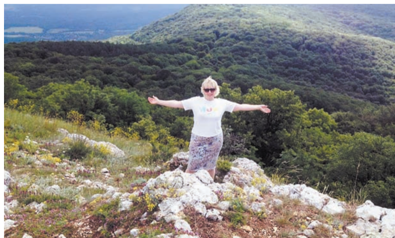
Красота и простор Лысой горы — неописуемы

С этой экскурсии мы и начали знакомство с ним. Побывали в Севастополе – городе-герое, городе боевой Славы. Это сердце Черноморского флота. Страшные события пережили Крым в годы Великой Отечественной войны. Храбро сражались за независимость своей земли крымчане и бойцы Красной Армии. На мемориальных досках много фамилий исконно русских.