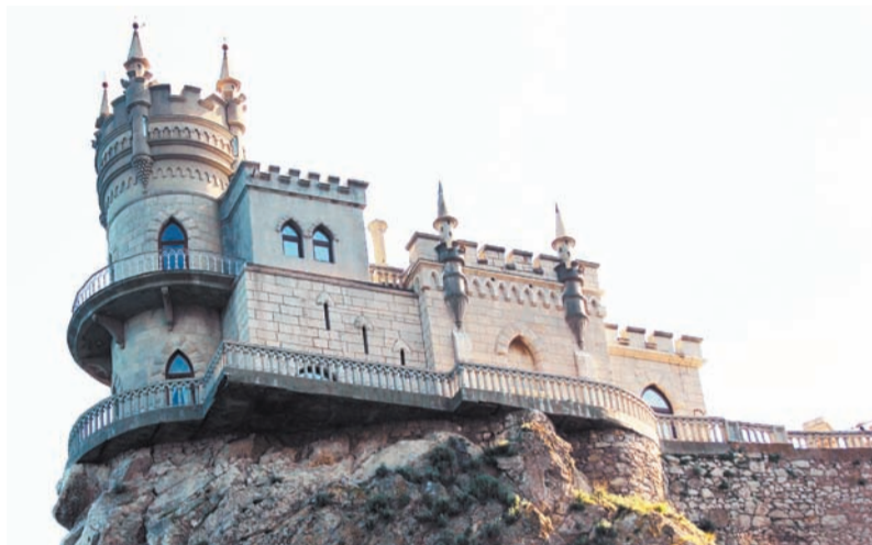
«Ласточкино гнездо» — визитная карточка Крыма