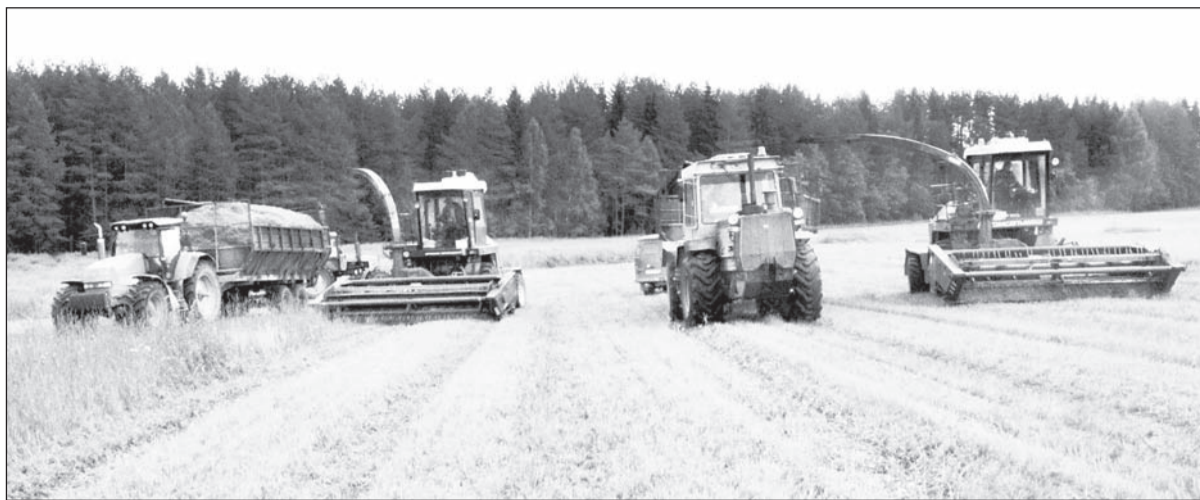
Силосная бригада на коленских полях

а когда силосовали прямо в поле, то работали в две смены. В траншеи закладываем смесь многолетних трав, без соли. В этом году очень сочной была трава второго года. В день удавалось заготовить примерно по 300 тонн зелёной массы, получается, что яму объёмом в 1000 тонн заполняем за 3-4 дня.