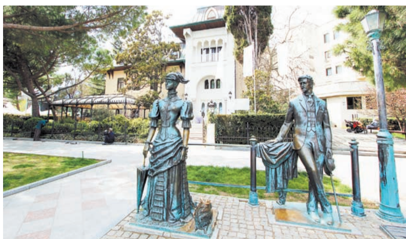
Возле «Дамы с собачкой» часто фотографируются отдыхающие