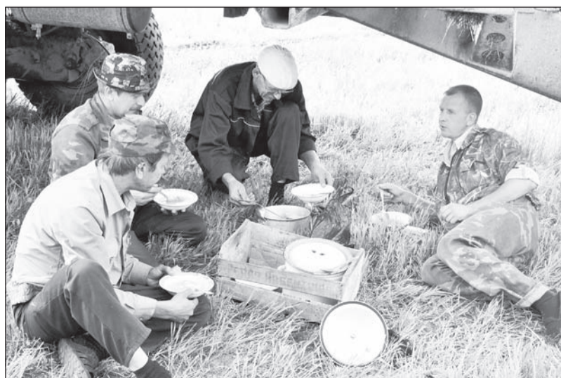
Во время обеденного перерыва