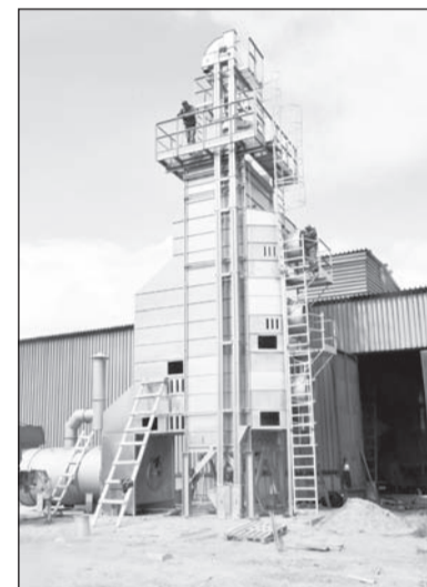
Новую сушилку собирает бригада под руководством Михаила Астафьева

«Молоко в этом году сдаём только классами люкс и экстра, в основном, конечно экстра, пока не удаётся выйти на белок выше 3,3, - рассказывает Нина Ионовна. - Гордимся, что в районе цена на наше молоко самая высокая - 20 рублей