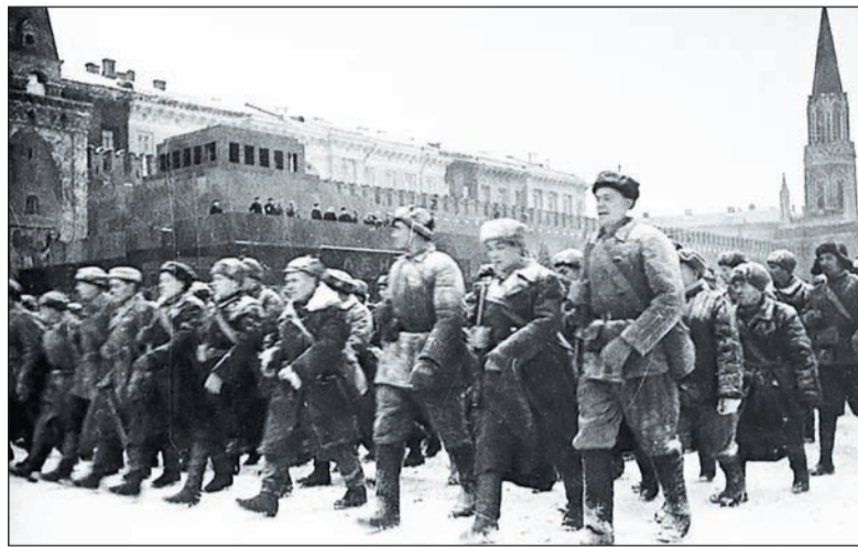
7 ноября 1941 г. С парада — на передовую