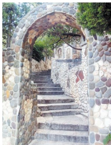
Улочка в Симеизе