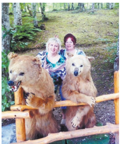
На экскурсии по Крыму