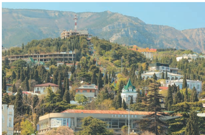
Город Ялта расположен в гористой местности