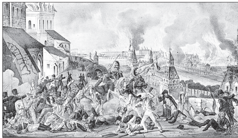
Гравюра И.Л. Ругендаса «Пожар Москвы в 1812 году»

Мне не очень понятно, зачем Наполеону вообще нужен был Восточный поход? Что он хотел найти в суровой и холодной России? Может, он и те, что стояли за ним, надеялись обзавестись ещё одной колонией? Мол, пусть дикари охотятся и добывают меха для Запада.