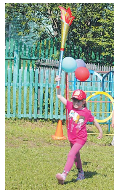
Все как на настоящей Олимпиаде.

Проведение такого рода мероприятий в детском саду способствует нравственному воспитанию дошкольников — и в ходе подготовки к соревнованиям, и участвуя в играх дети учатся ответственности за свои поступки, поддерживать друг друга в случае неудачи, радоваться успехам товарищей, тем самым приобретая крупный бесценный опыт совместной деятельности.