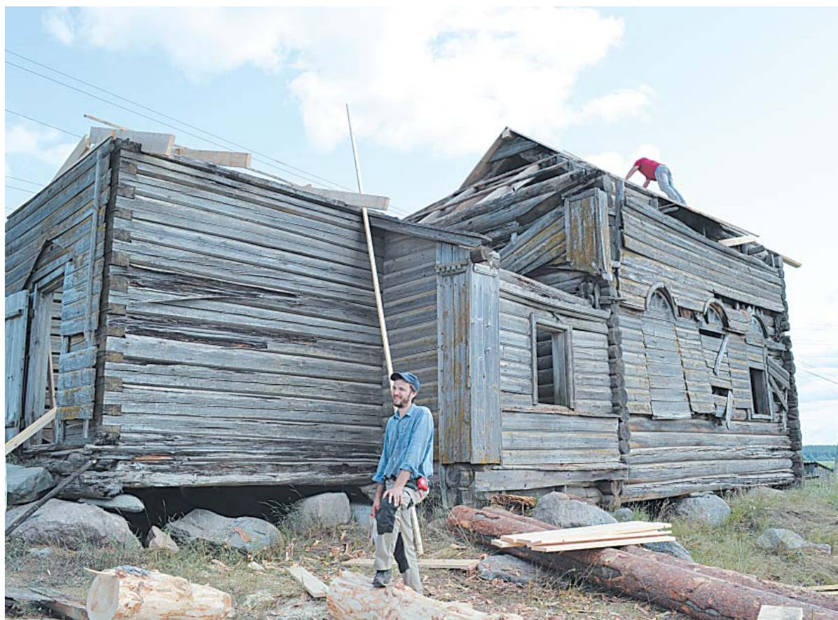
Основная задача волонтеров «Общего дела» — не дать святыням исчезнуть.