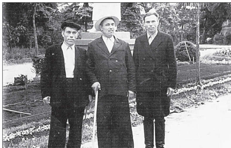
«1958 год. В июне мне дали путевку в санаторий, г. Кисловодск. Посмотрел, что такое Кавказ».