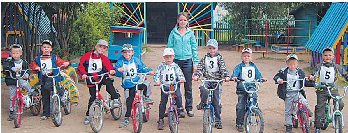
На четвертый день малых Олимпийских игр состоялись гонки на велосипедах.

В первый день Олимпиады воспитатели и детвора, собравшись на спортивной площадке, участвовали в командных эстафетах, которые организовали сказочные герои. За I место боролись две команды — «Радуга» и «Апельсин». Дети бегали, прокатывали мячи, пры-