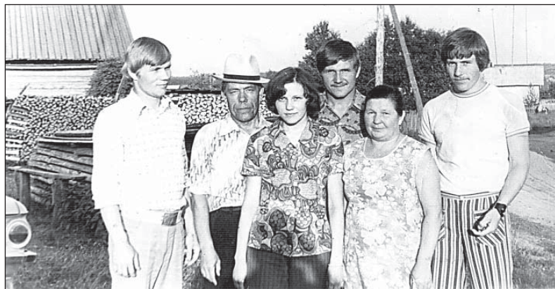
«1977 год. Один раз случилось, что собралась вся семья в сборе».