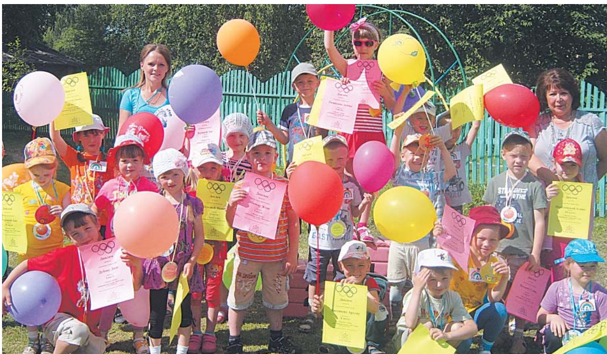
Все победители получили памятные медали, дипломы, воздушные шары и сладости.

гали через препятствия, бросали предметы в цель. Никто не хотел проиграть, все участники были ловкими, быстрыми и меткими. Но победа досталась сильнейшим — команде «Радуга». Справедливые судьи вручили всем участникам заслуженные награды.