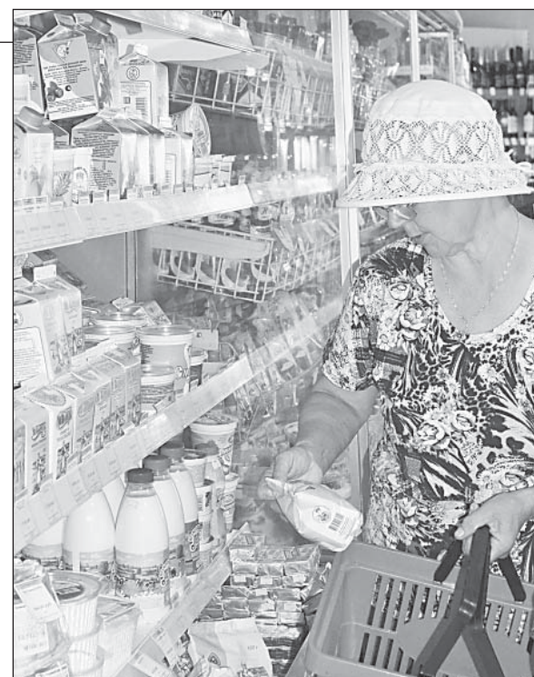
У покупателей пользуется спросом вологодская молочная продукция

веденным внутри области. То есть, так называемые «зеленые» ценники покупателей своим внимание не обходят. В Верховажье ставку на продвижение в том числе и бренда «Настоящий Вологодский продукт» сделали в райпо и в магазине «Контакт». Что бы ни говорили, а гарантия качества покупки неизмеримо возрастает.