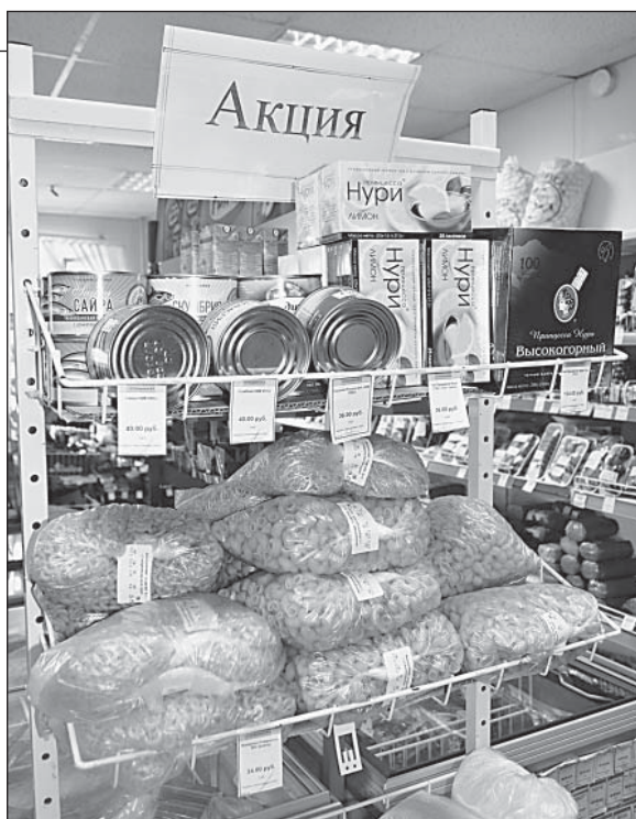
В «Контакте» регулярно проводятся акции — продажа товара по сниженным ценам