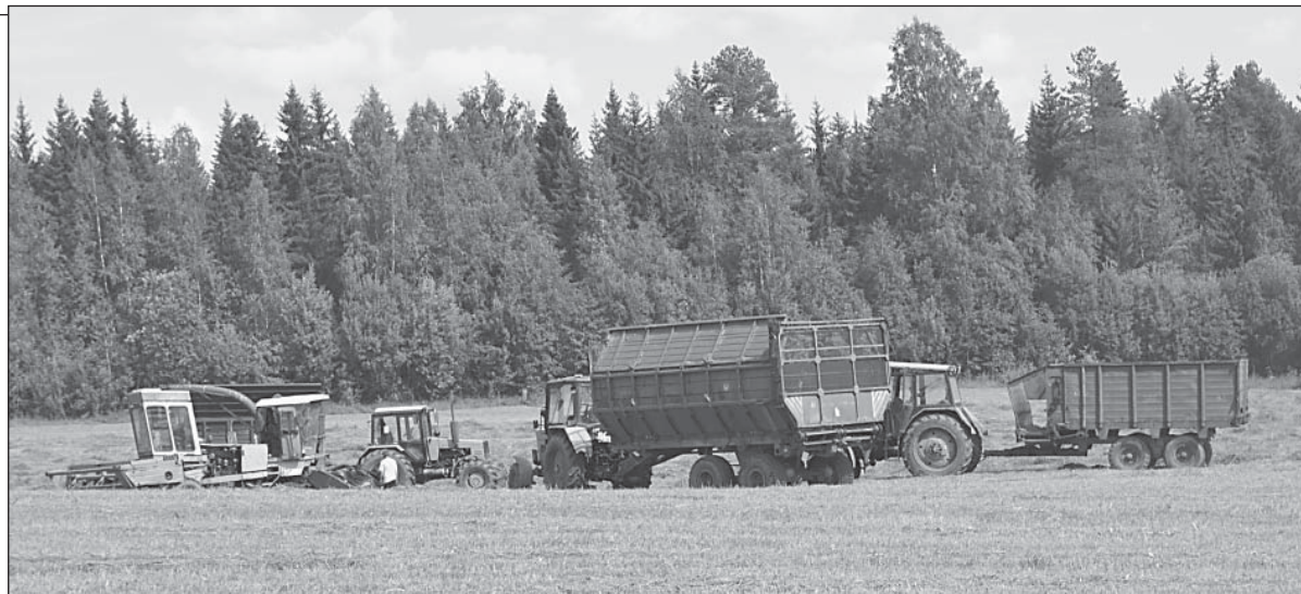
Заготовка кормов идет слаженно. Почти вся техника в поле