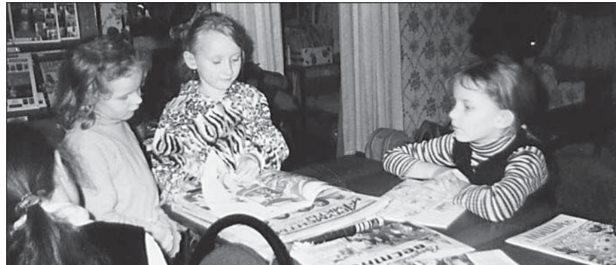
Знакомство с журналами и газетами