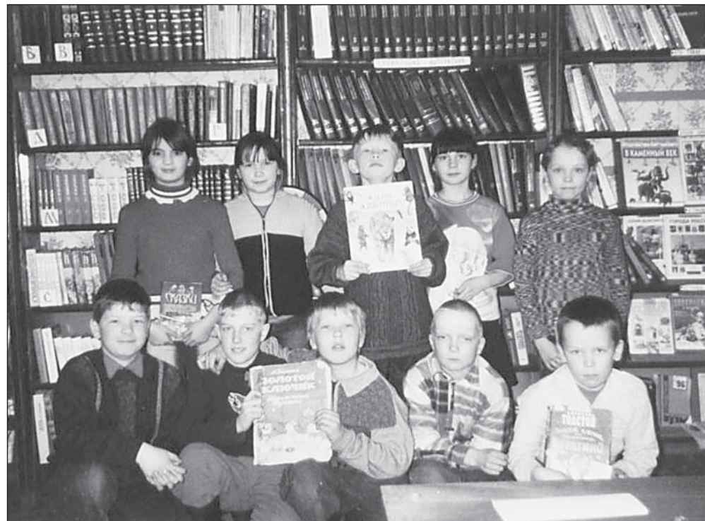
Участники праздника «Книжкины именины»