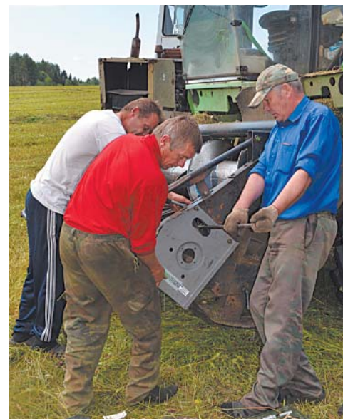
Технику приходится ремонтировать прямо в поле

«Считаю, что в школе нынче не совсем правильно строят профориентационную работу, - продолжает руководитель. - Наверняка многие из вас слышали, как педагоги говорят ученикам: «Будешь плохо учиться — пойдёшь работать на ферму», «Тебе одна дорога — в СПТУ». Да и местные власти тоже не особо интересуются нашей деятельностью, редкие гости в поле и на ферме. А чем работа в колхозе, на своей земле плоха? Нам нужны специалисты, которые за качественно выполненную работу будут получать достойную заработную плату, у нас нельзя работать как попало. Насколько мне известно, эта