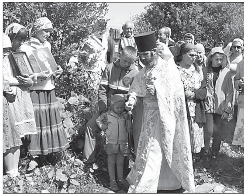
Освящение Никольского источника

ную Божественную Литургию, по окончании которой молящиеся прошли крестным ходом до Никольского источника для его освящения. Праздник завершился общей трапезой.