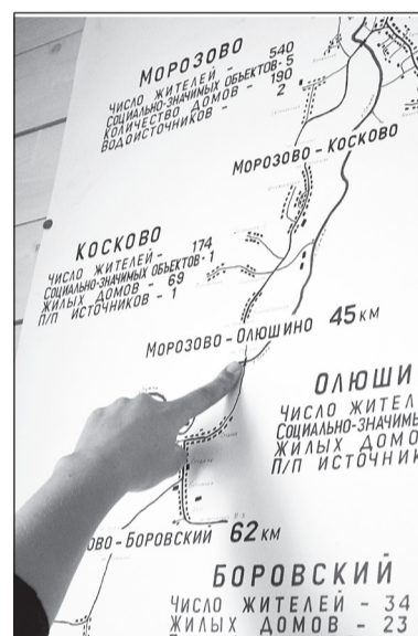
Ежедневно лишние километры в объезд делают десятки машин

то мост нуждается в капитальном ремонте.