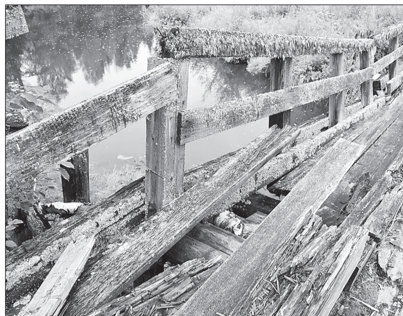
Сейчас по аварийному мосту даже пешком пройти страшно. Перила поросли мхом, настил превратился в труху.

Если внедорожнику такая задача под силу, то нашей редакционной «семерке» пришлось нелегко - на каждом повороте то и дело возникала опасность, что мы останемся в яме. Впрочем, мои опасения подтвердились - на обратном пути толкать машину нам так пришлось. Кстати, доехали мы только до моста. Огромные зияющие дыры и гнилые доски нас остановили от дальнейшего движения. Если дорогу можно засыпать и разровнять,