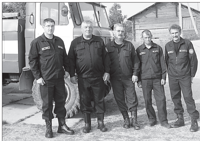
Личный состав отдельного поста №88 (Шелота)