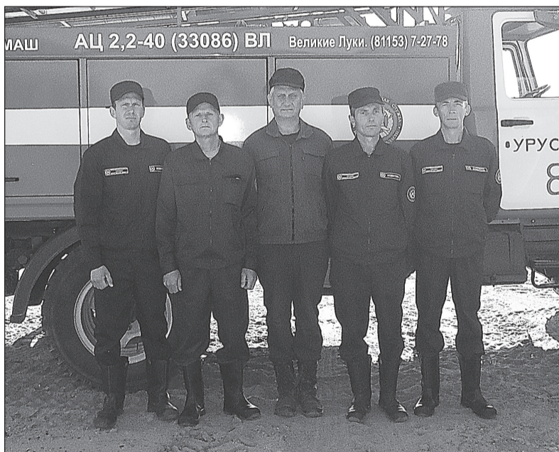
Личный состав отдельного поста №87 (д. Урусовская)