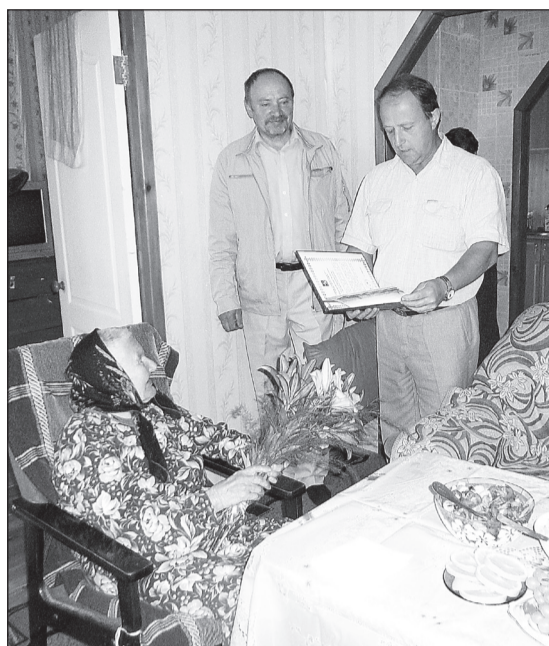
Глава района зачитывает поздравление от Президента России