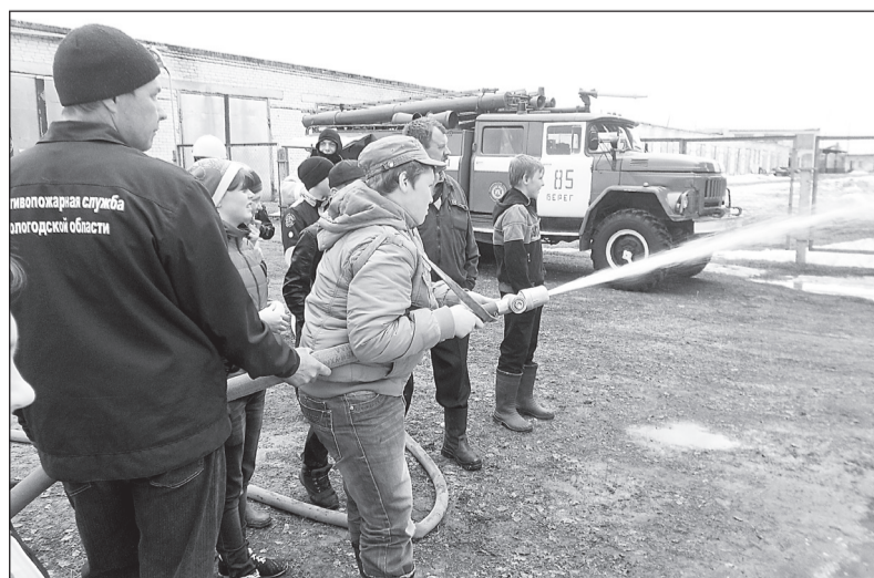
Открытый урок для школьников, ОП №85 (д. Берг)