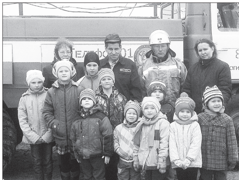
Малышам было очень интересно, ОП №86 (д. Ногинская)