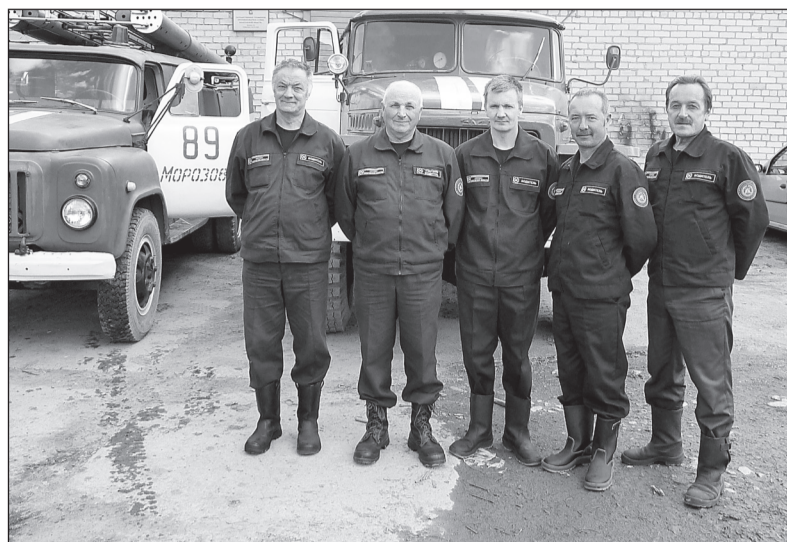
Личный состав отдельного поста №89 (с. Морозово)